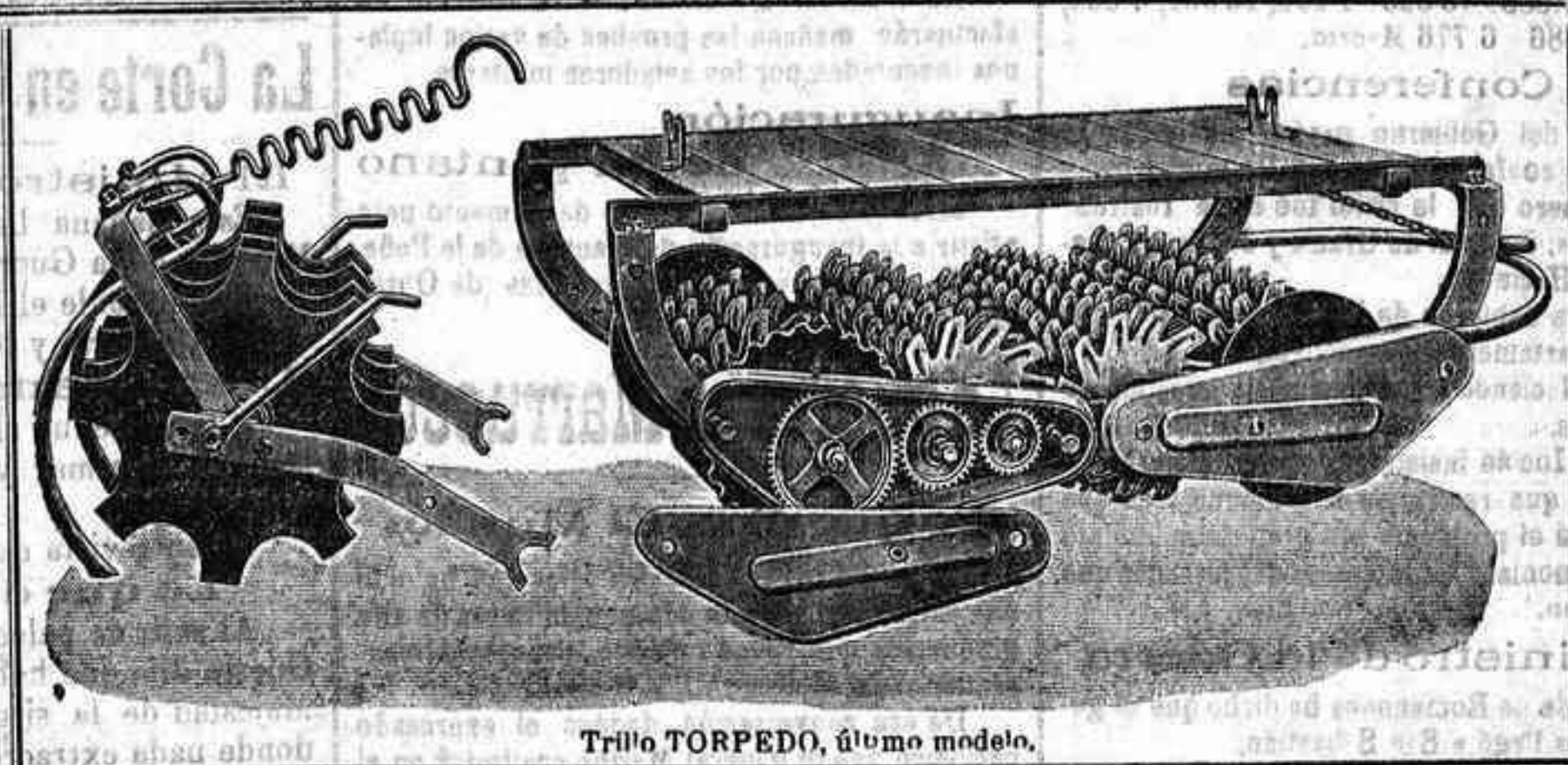
Trillo TORPEDO, último modelo.

Arados y Sembradoras Rud-Sack .—Distribuidoras de abonos Westfalla . —Segadoras y guadañadoras Deering Ideal .—Trillos rotativos reformados Torpedo .—Arados Melotte y Plutón .—Cultivadores Planet .—Gradas de Estrella Bajac .—Gradas de flejes Hércules .