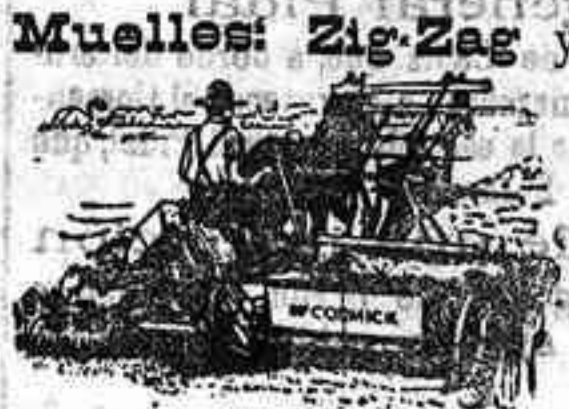
Muelles: Zig-Zag y

Nuevos Arados Brabanes reforzados León . Arados Janus ; Gradas de Rotativas de Estrellas . Cultivadores; Sembradoras; Renombradas Segadoras Mo. Cormick ; Trituradores de grano; Trillos Rotativos de gran trabajo; Hilo de Abacá , las célebres Trilladoras Clayton ; Aventadoras Ciutat de gran trabajo, movidas á malacate y á motor para limpiar 10, 20 y 30 carretadas por día, mies hecha parba.