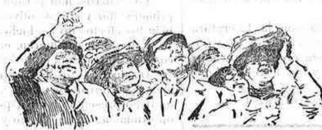
Siguiendo las evoluciones de un aeroplano en un vuelo de altura.

Madrid y San Sebastián disfrutan actualmente del sorprendente efecto que produce en el ánimo ver cómo el hombre-pájaro surca el espacio con su maravillosa máquina, arrancando al viento gemidos que, al mezclarse con el rugir del motor que da vida al férreo aparato, parecen entonar apocalíptico himno a la aviación, uno de los más portentosos inventos de nuestros días. Sin embargo de tratarse de la capital de España y de celebrarse simultáneamente en dos lugares distintos, en los velódromos de Chamartín de la Rosa y de la Ciudad Lineal) pruebas de avia-