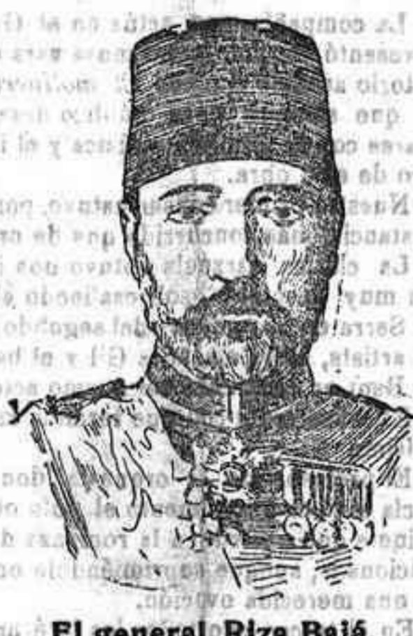
El general Riza Bajá, comandante del ejército turco que pelea contra los griegos en Macedonia