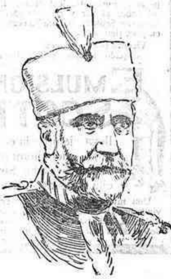
El general Putnik, uno de los reorganizadores del ejército búlgaro, y en la actualidad jefe de su Estado Mayor