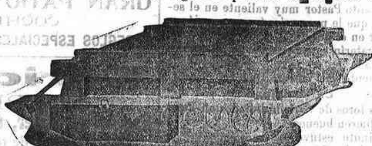
TRILLO ROTATIVO DE GRAN TRABAJO para una sola yunta de mulos.