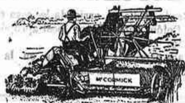
Aradoras Macormick — ÚLTIMA PERFECCIÓN