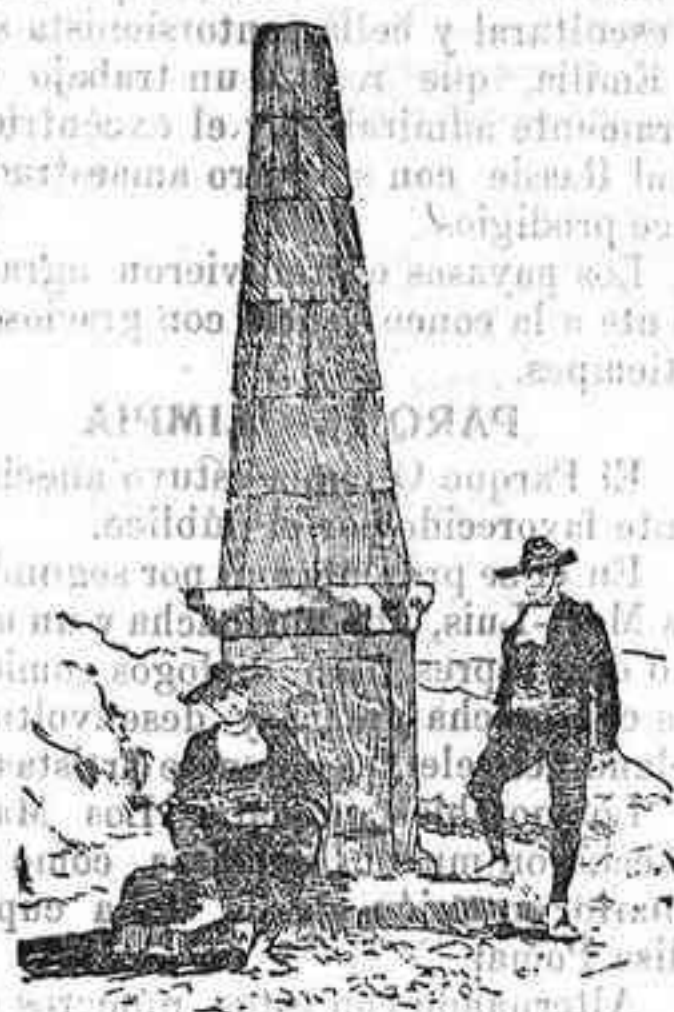
Obelisco levantado en el lugar en que se libró la batalla.

Por iniciativa de un simpático y veterano periódico salmantino, «El Adelanto», Salamanca ha enviado, al lugar en que se libró la batalla, a los cerros Arapil alto y Arapil bajo, lindas representaciones, para, sobre el mismo teatro de sus heroicas hazañas, rendir patriótico homenaje a los que supieron vencer y morir por la independencia patria.