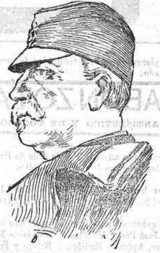
FIGURAS DE LA GUERRA.—El general Stefanovich, comandante del ejército serbio que opera en el Nord-Este de Monastir.

En la Gaceta de Madrid del día 1 del corriente ha sido publicada la siguiente Real orden: Ante el temor de que el aumento incesante de la exportación de aceites de oliva pudiera comprometer la conservación de las reservas necesarias para atender las necesidades del consumo nacional, fueron dictadas por este Ministerio las Reales órdenes de 4 y 13 del corriente mes, que dejaron limitada la salida para el extranjero a los productos refinados, cuya concurrencia en los mercados exteriores no podía interrumpirse sin causar grave daño a los intereses de la producción olivarera. No han sido suficientes estas precauciones para contener el aumento de la exportación de aceite refinado y continúa subsistiendo el problema de restringir la salida del mismo para el extranjero, empleando medios legales que armonicen los intereses de los productores con la imperiosa necesidad de retener en España las cantidades que sean indispensables para el consumo interior; ambos objetos sólo pueden lograrse mediante la imposición de un gravamen sobre la exportación que contenga la salida exagerada de nuestros aceites con destino a países extranjeros y beneficio al consumidor español.