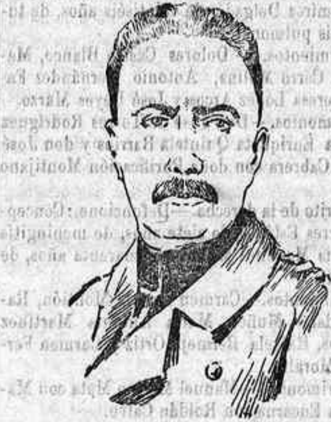
El general alemán Curetzky Cornitz, cuya división tomó el fuerte de Vaux.

Con favorecer la colonización agrícola — incitándose el Estado de los bienes que tan abandonados tienen los Municipios — la producción aumentaría en centenares de millones y se cortaría la emigración, lo mismo la que cae sobre Madrid, Barcelona y otras capitales, dejando abandonados los pueblos del interior, y descendiendo a la condición de metecos , que la que va a parar a América, en concepto de gringos y gallegos. Alfredo Opisso.