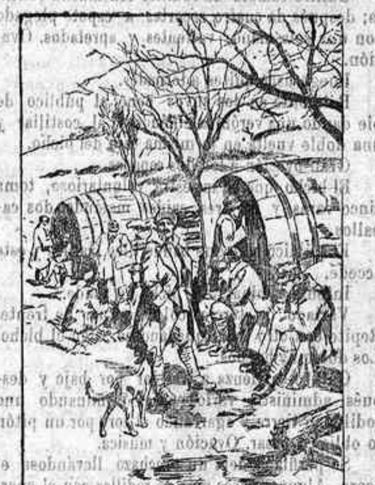
CUADROS DE LA GUERRA Original campamento italiano en las líneas de retaguardia. Como se vé en él son utilizados los grandes toneles como habitaciones.