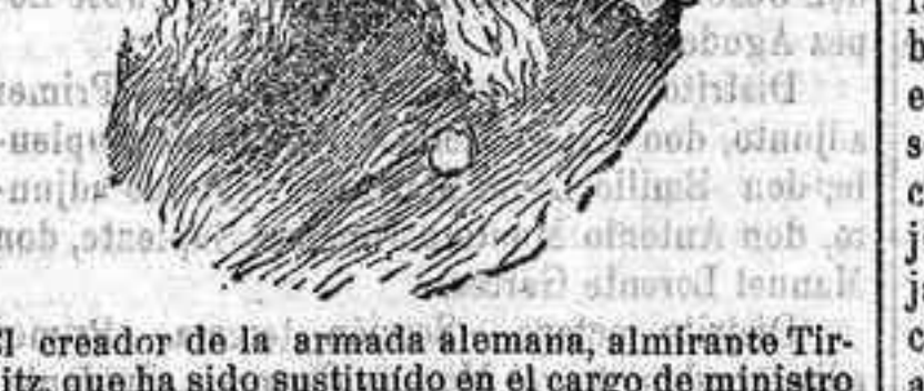
El creador de la armada alemana, almirante Tirpitz, que ha sido sustituido en el cargo de ministro de Marina.

Con el objeto de satisfacer la creciente demanda de ejemplares del DIARIO y para mayor comodidad del público, los números sobrantes de la tirada corriente quedan puestos a la venta en los kioscos de las Tendillas, la calle del Conde de Gondomar y la Estación, dejándose de expendernos en la Administración de este periódico.