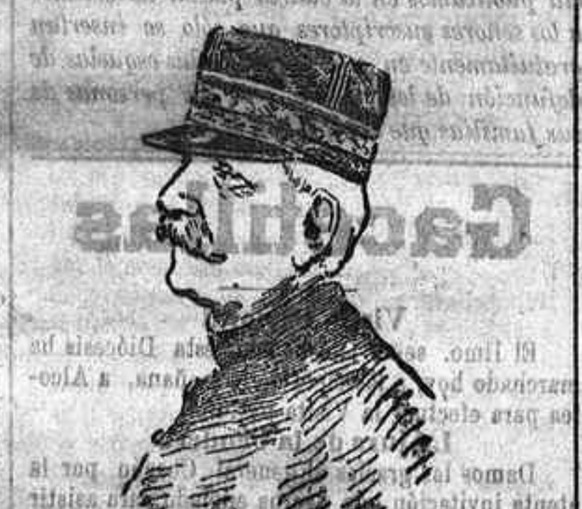
El general Torres, que preside la Conferencia de altos mandos que actualmente se celebra en el Cuartel general, en Francia.

Esta es la gran hora, la hora heroica que pasa. Si pasa inútilmente como todas las demás han pasado para España, nosotros, cuando menos, habremos cumplido señalándola, anunciándola directamente en esta parálisis crónica de las Cortes, a las representaciones supremas del Estado y a la opinión de España entera.