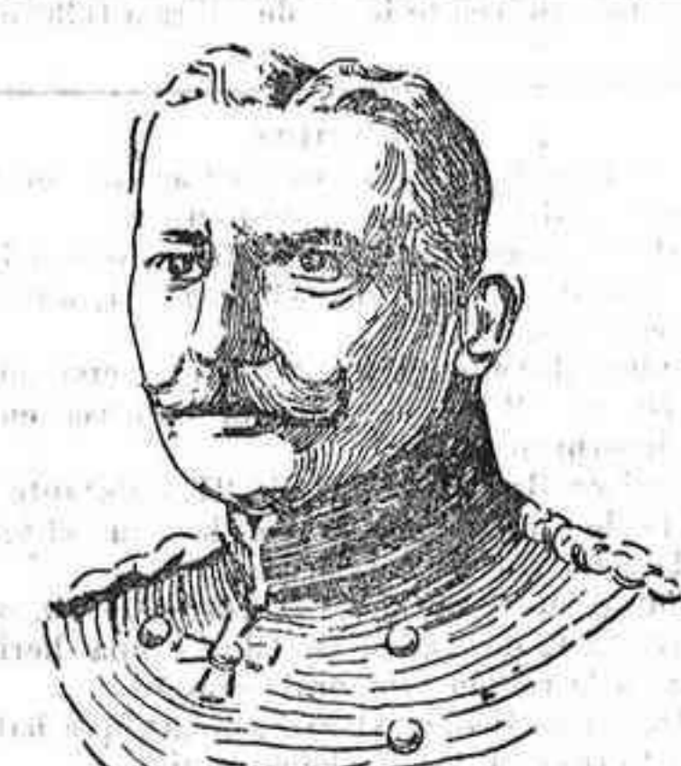
FIGURAS DE LA GUERRA.—El general alemán Emmin, jefe de uno de los cuerpos de ejército que acaban de vencer a los rusos en la Prusia oriental

Cambios sobre el extranjero.—París a la vista, 98'80.—Londres a la vista, 00'00.