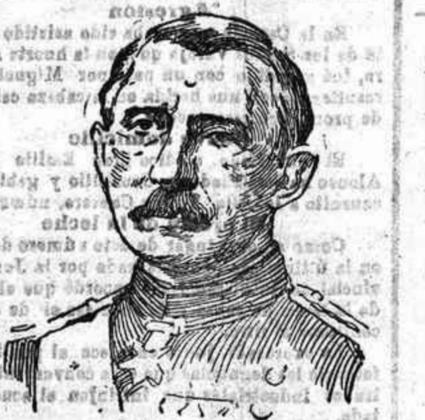
El general Leonard Wood, que según se dice, será nombrado presidente de Norte América.