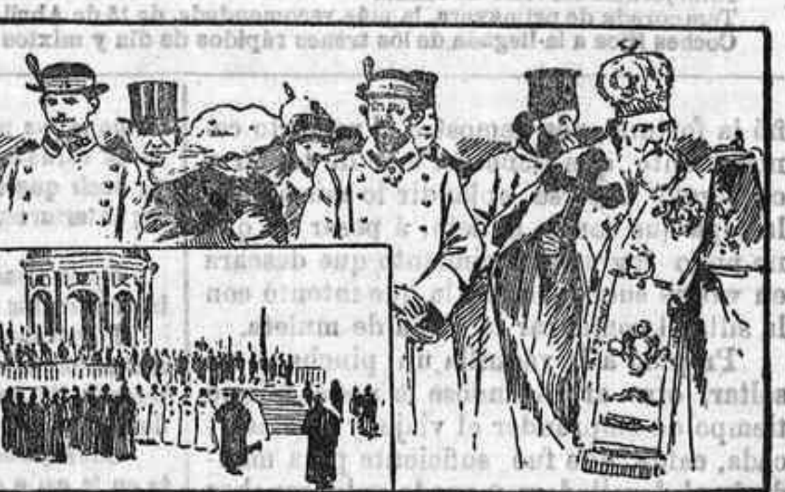
La bendición de las aguas en Búcarést y en San Petersburgo.

Nuestro grabado representa, en el cuadro grande, la bendición de las aguas en Búcarést, bajo la presidencia del príncipe heredero de Rumania, y en el pequeño, la bendición de las aguas del Neva por el emperador Nicolás, ceremonia que se celebra en el kiosko del Palacio de Invierno de San Petersburgo.