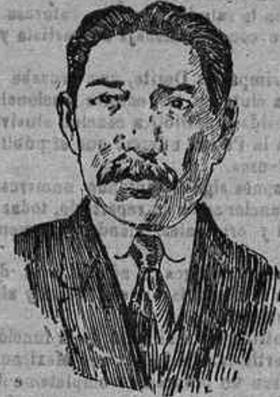
El Vizconde Chinda, diplomático japonés, que se encuentra en París representando a su país en las conferencias de la paz.

De Abastecimientos En una de las dependencias del Gobierno civil continúan reuniéndose los inspectores delegados de Abastecimientos.