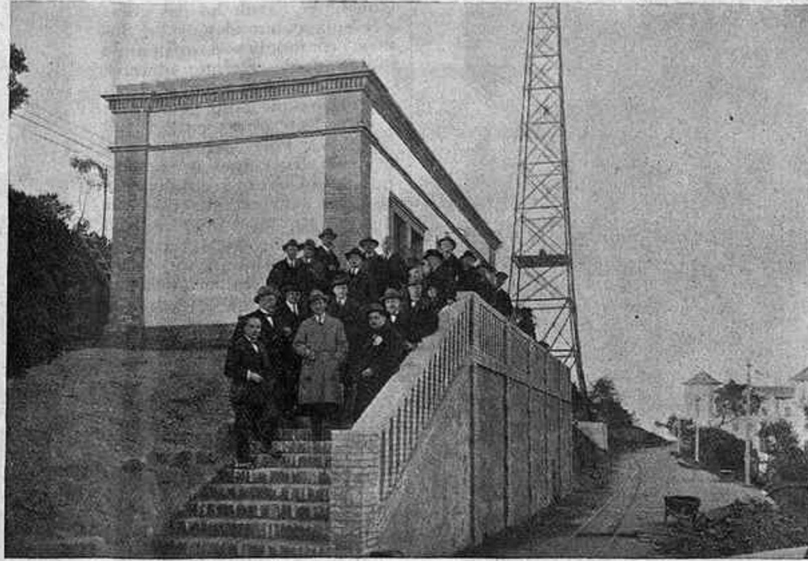
L'emissora del Tibidabo

Entre els antics directius de Ràdio Barcelona i les persones que envià Unió Radio, de Madrid, sorgiren moltes divergències. Tant és així, que l'Associació Nacional de Radiodifusió es separà d'Unió Radio Barcelona el dia 20 d'agost de 1929.