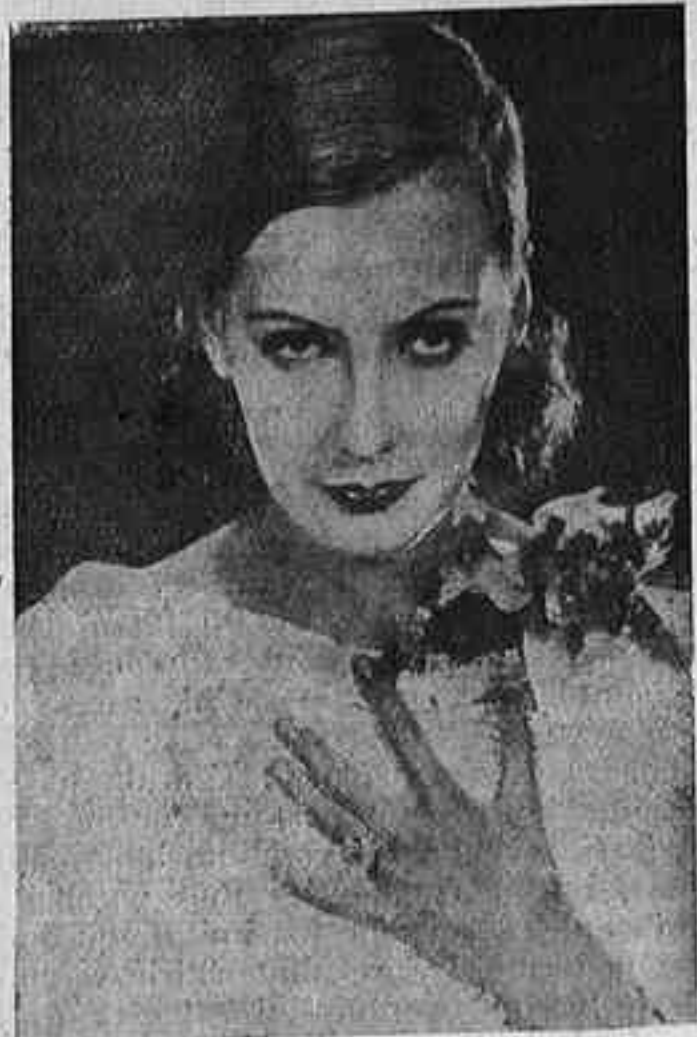
GRETA GARBO la protagonista d'Ana Karenina

Ha començat el que hem convingut d'anomenar temporada d'estiu. Preus reduïts i programes a base de represes.