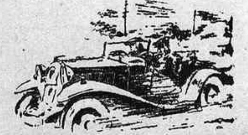
—Cauen gotes, noi. Ens haurem d'aturar en algun lloc, a veure si podem robar una conducció interior. (The Humorist, Londres)