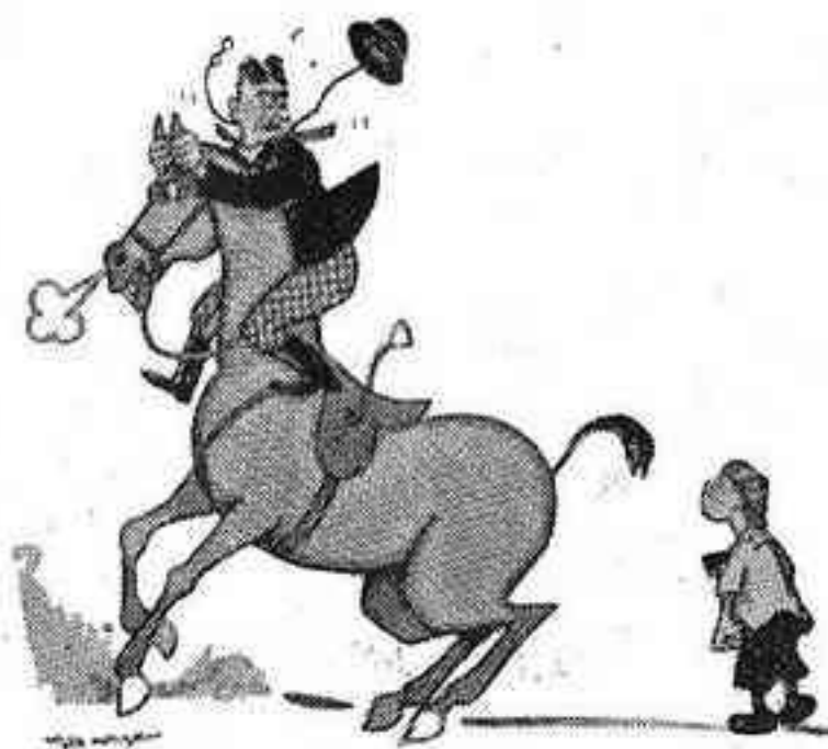
—Nen, que tens un terròs de sucre per donar-li? (Saturday Evening Post.)