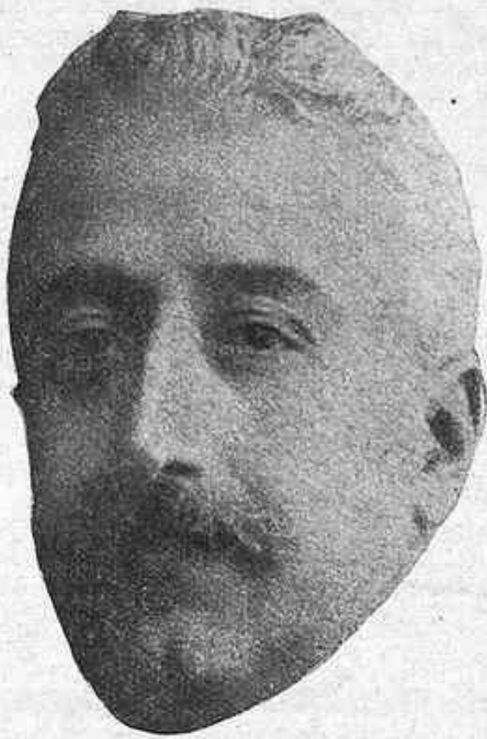
NICETO ALCALA ZAMORA