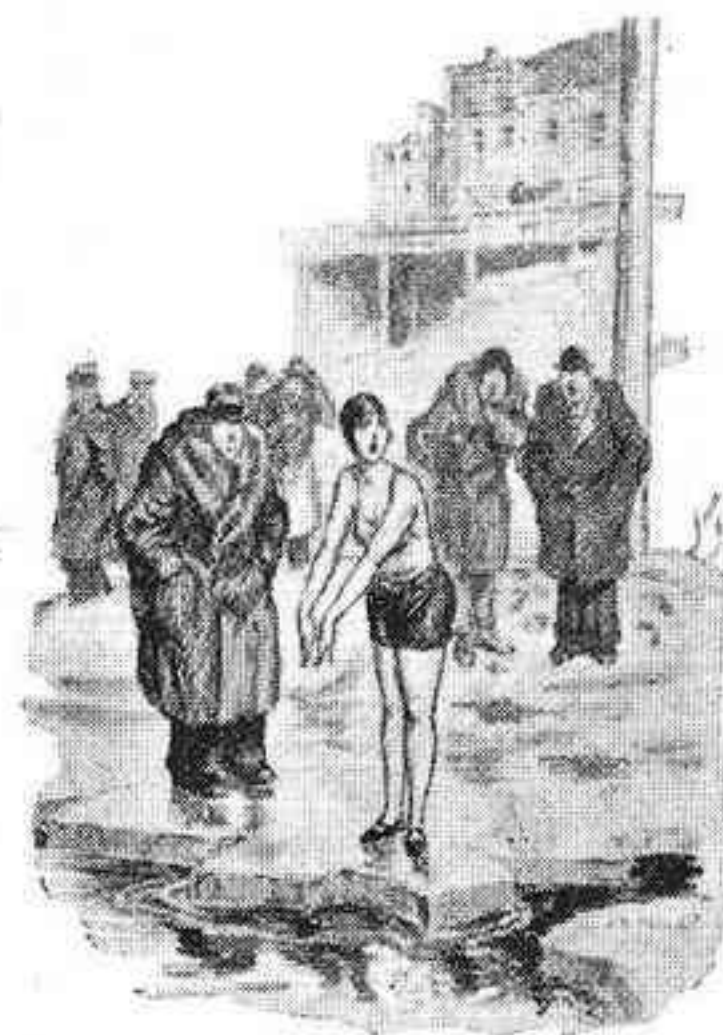
La banyista en ple hivern. — Quina delícia!... Però on dimoni són els fotògrafs?