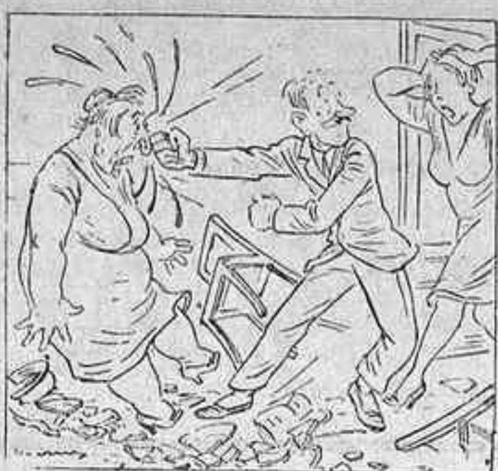
— Poca vergonya! Tractar així la meua mare, malalta com està... — Per això mateix: aplico l'asueroteràpia. (Guerin meschino.)