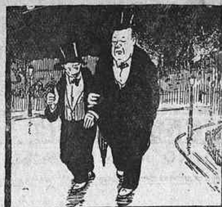
— M'agradaria saber qui ha estat l'animal que ens ha canviat els barrets. (Lustige Kölner Zeitung.)