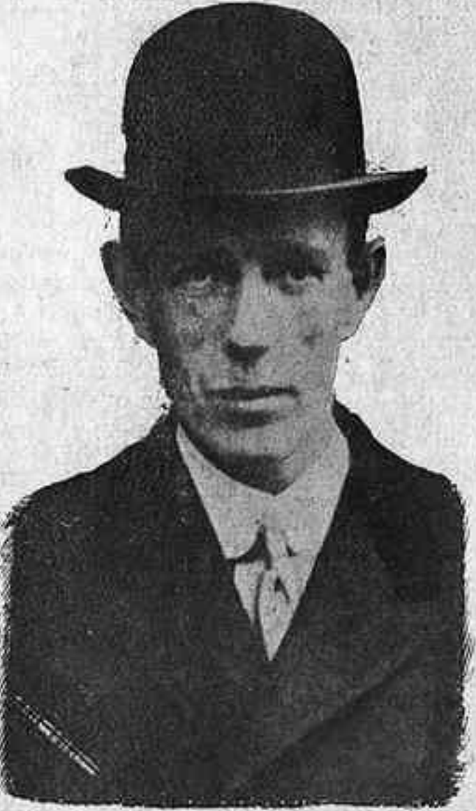
LORD IRWIN Virei de l'Índia

Entretant dintre la boira de Londres un govern que també posseïx secrets de redempció de la humanitat rumia i cavilla com poden conciliar-se la seva tesi i la tesi de l'Índia amb el punt de vista d'Anglaterra, o de l'Imperi britànic. Com a representant d'un partit socialista té una doctrina liberal i humanitària, i com a repre-