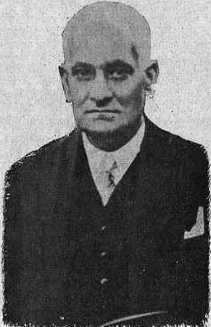
JAWHARAL NEHRU President del Congrés de Lahore

Des de Jerusalem a Xang-Hai, passant per l'Índia, l'Àsia es desvetlla, i el desparter d'aquest continent immens d'un llarg