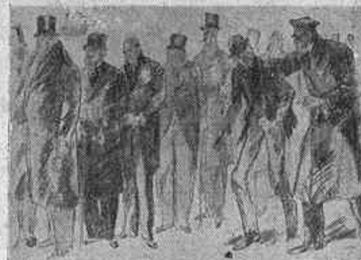
— Fora d'aquí, perdulari! Aquesta cua de pa és la dels milionaris. (Life.)