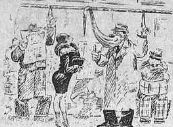
— Senyora, em permet que li ofereixi la meua barba per repenjar-se? (Londagsnisse Strix.)