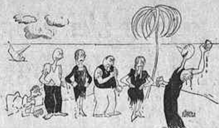
EL DIMONI DEL BRIDGE — No estiguen tan tristos! He salvat un joc de cartes del naufragi. (Life.)