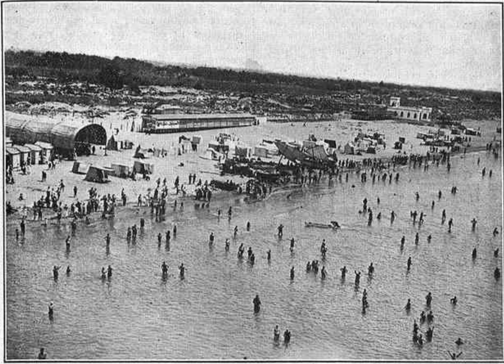
La platja de Castelldefels

NO ES TRACTA DE CREAR UNA PLATJA DE MODA MÉS Res de casinos ni hotels de luxe. La qüestió és satisfer una necessitat del treballador barceloní. La generació proletària anterior passava el dia a la taverna i a les sales de joc; és un deure dels actuals directors de la ciutat facilitar al proletariat la satisfacció de les seves ansies de llum i descans. Barcelona és en totes les seves manifestacions una «Ciutat de Treballadors». L'actual Ajuntament ha de procurar millorar la vida d'aquests en tots els seus aspectes. L'organització del repòs de les masses els dissabtes i diumenges és un punt importantíssim. La qüestió és d'urgència. S'ha d'actuar d'una forma enèrgica, valent-se, si convé — per tractar-se d'un cas de salut pública — de les lleis d'expropiació, evitant la creació en aquest lloc d'un nou paradís burgès, centre d'exploatació assolible solament a les classes privilegiades, abans que realitzin el seu projecte els que somien transformar Castelldefels en un Jean-les-Pins o un Cannes. Si això es portés a cap, fóra una expoliació més als treballadors barcelonins.