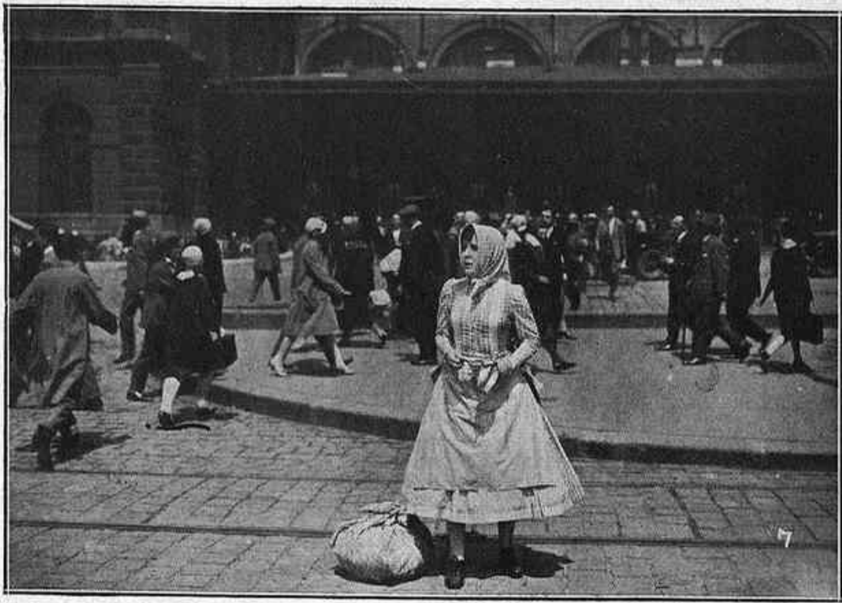
L'arribada de Dita Parlo a Budapest («La melodia del cor»)

s'anunciaven, havia compost un film que demanava música pels quatre costats.