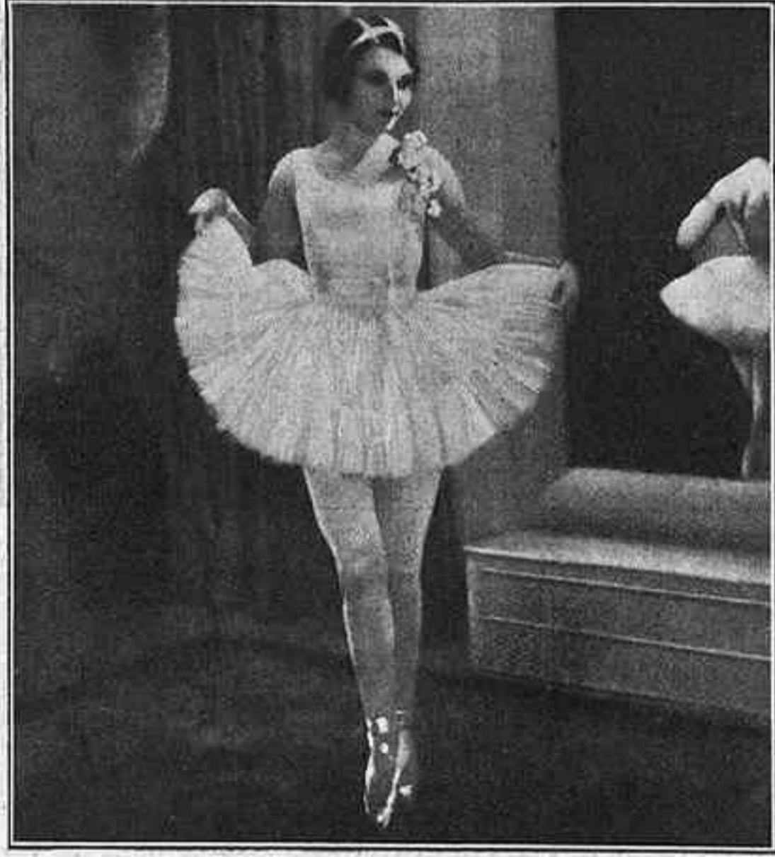
Annabella, protagonista de «Le Million»

En conjunt, la interpretació és excellent