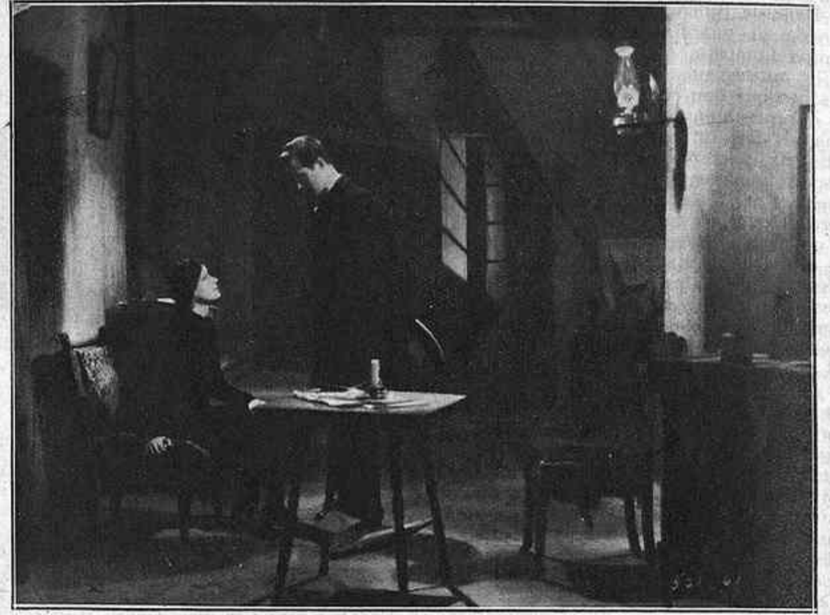
Greta Garbo i Robert Montgomery en «Inspiración»

Greta Garbo és inspiració per a tothom que la coneix, però aquesta dona, quan ja avança cap a la segona joventut, s'adona tràgicament que només ha estat fins aleshores matèria d'inspiració, i mai matèria d'amor com ella exigeix. Haver estat un mitjà pels altres en lloc d'esser un fi com tota dona anhela, és el que li desnatura l'existència i la fa incapaç d'abastar aquella normalitat que és la regla de la majoria. Per això quan, avorrida de l'existència