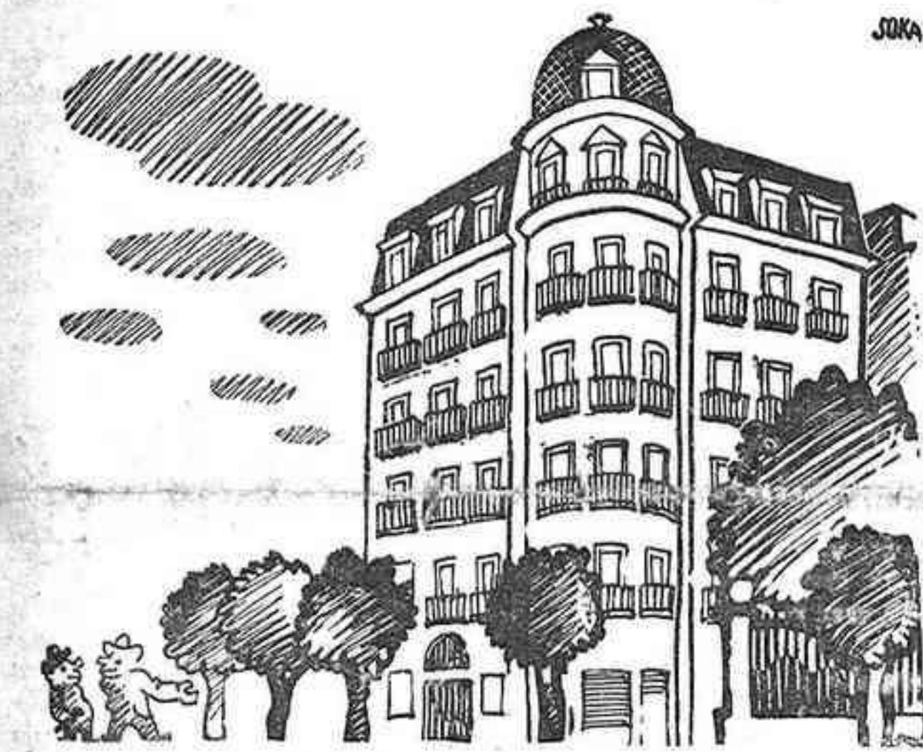
—Qué volen fer amb les banderes? —Tornar a comptar els balcons on no n'hi haurà.

Churrucua yacía en el suelo en un charco de su propia sangre, manteniéndose a duras penas medio incorporado sobre el brazo izquierdo. "Esto no es nada; siga el fuego", dijo serenamente el héroe. Una bala de cañón le había arran-