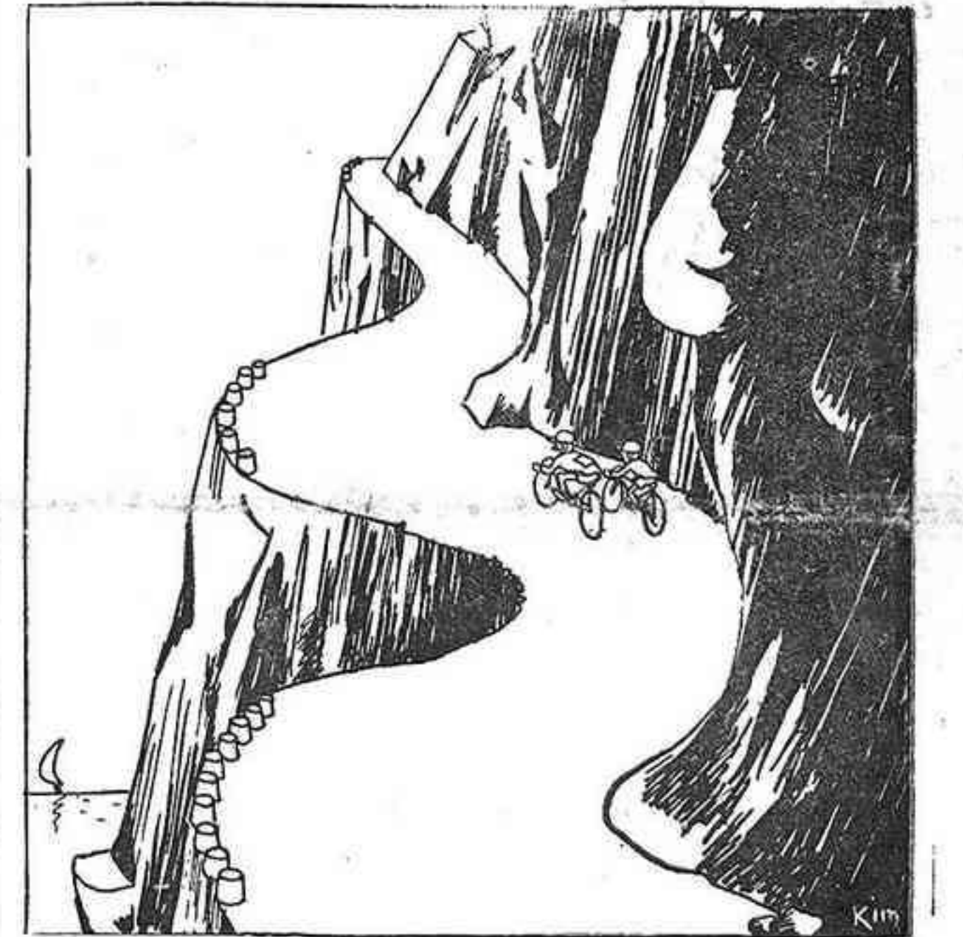
ELS GEGANTS DE LA CARRETERA

—Ja començo d'estar tip de fer els gegants.