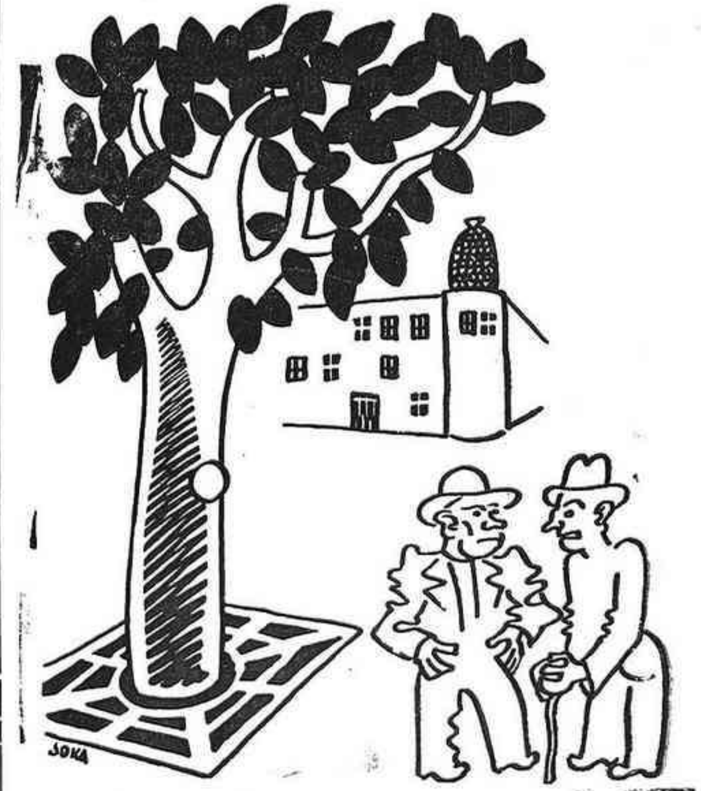
—L'Esquerra també va guanyar una etapa. —I encara no l'han processat?

—Tot el camí que t'arrossegava—deia—en arribar a la meta em deixes plantat. T'has aprofitat que menjava una taronja, per escapar-te.