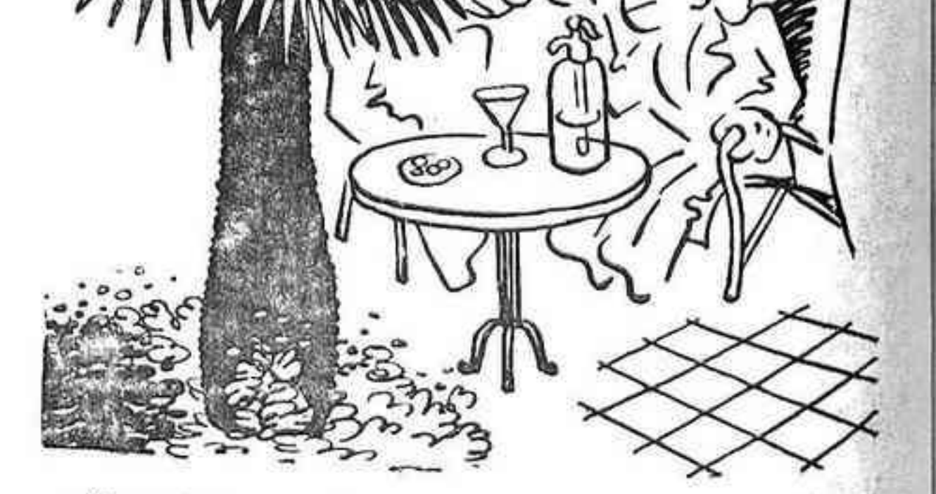
—Els monàrques també van votar la prorroga de l'estat d'alarma. —Doncs miri, és un detall per alumiar a qualsevol.

¿Quién la podrá recoger Y la lucha continuar?... No hay por qué desesperar, Que queda allí una mujer.