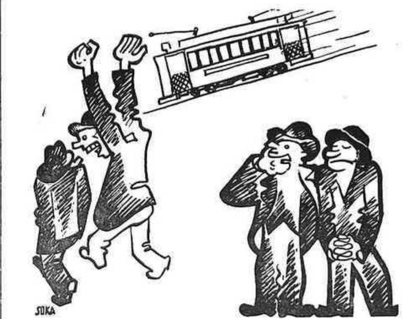
—Com s'exalta! —Sí, està molt cremat, però no vol que sigui dit.