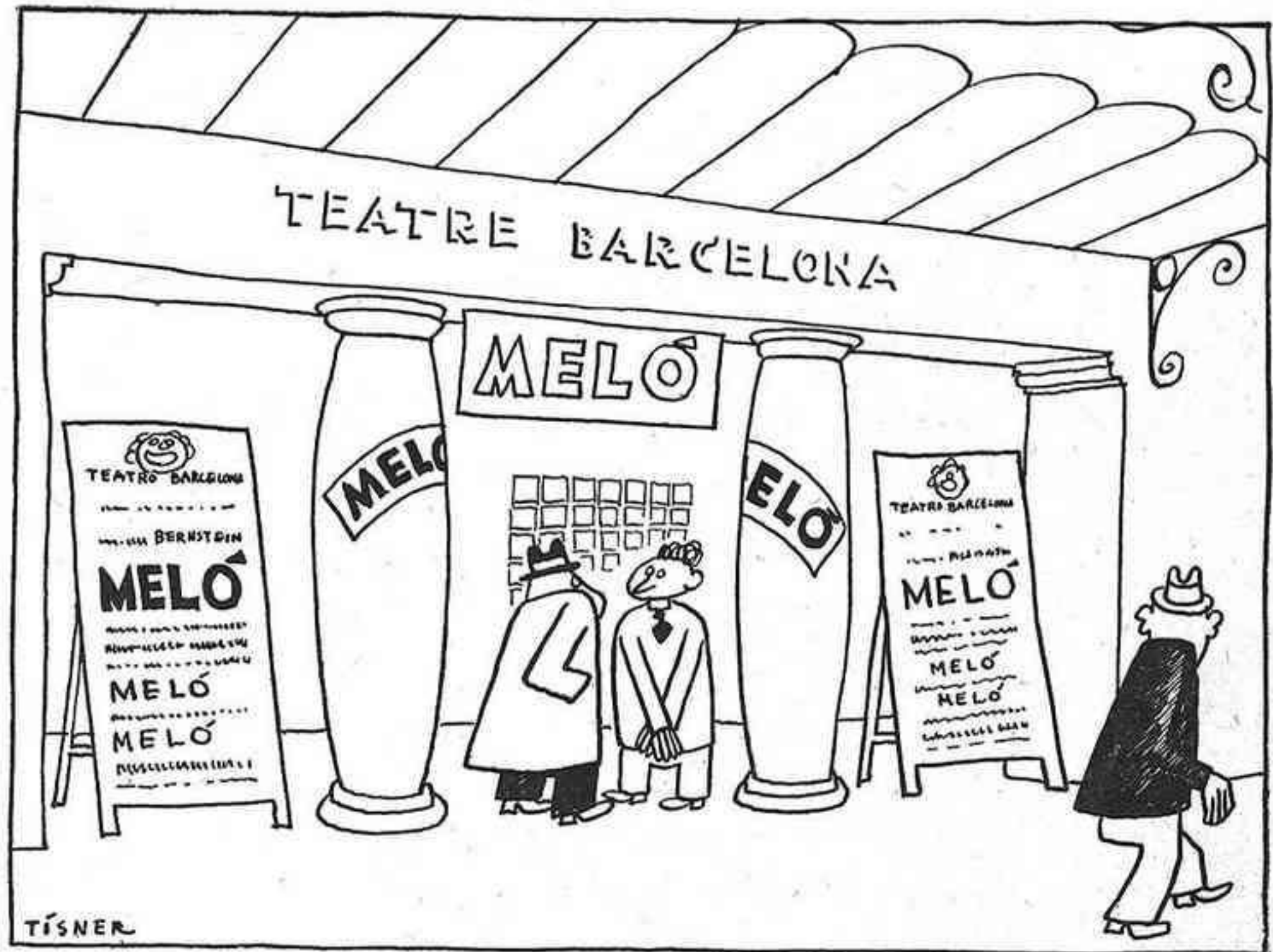
Mira: un meló que no ha estat taxat per la censura!

Mercat d'ocasions Compra - Venda - Canvi de mobles i tota classe d'objectes TOT D'OCASIÓ Corts. 414 - Tel·lèfon 30422