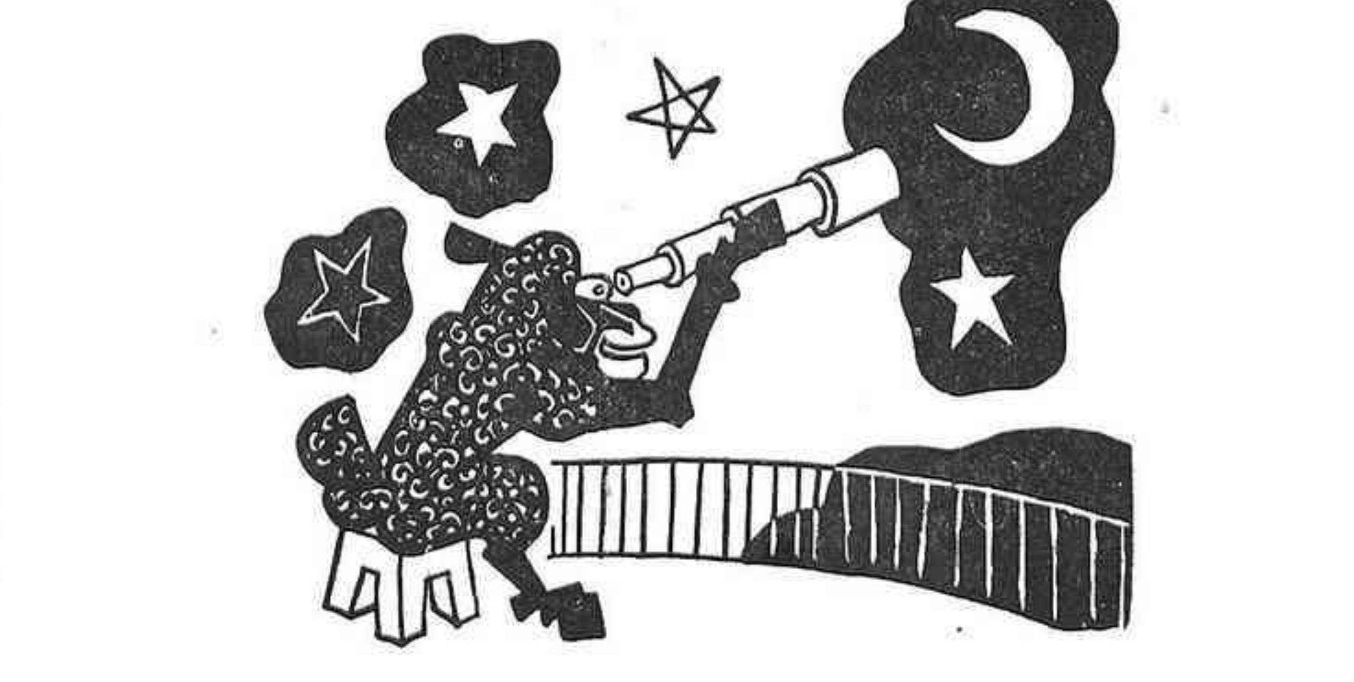
—Ben mirat, això serà la lluna!