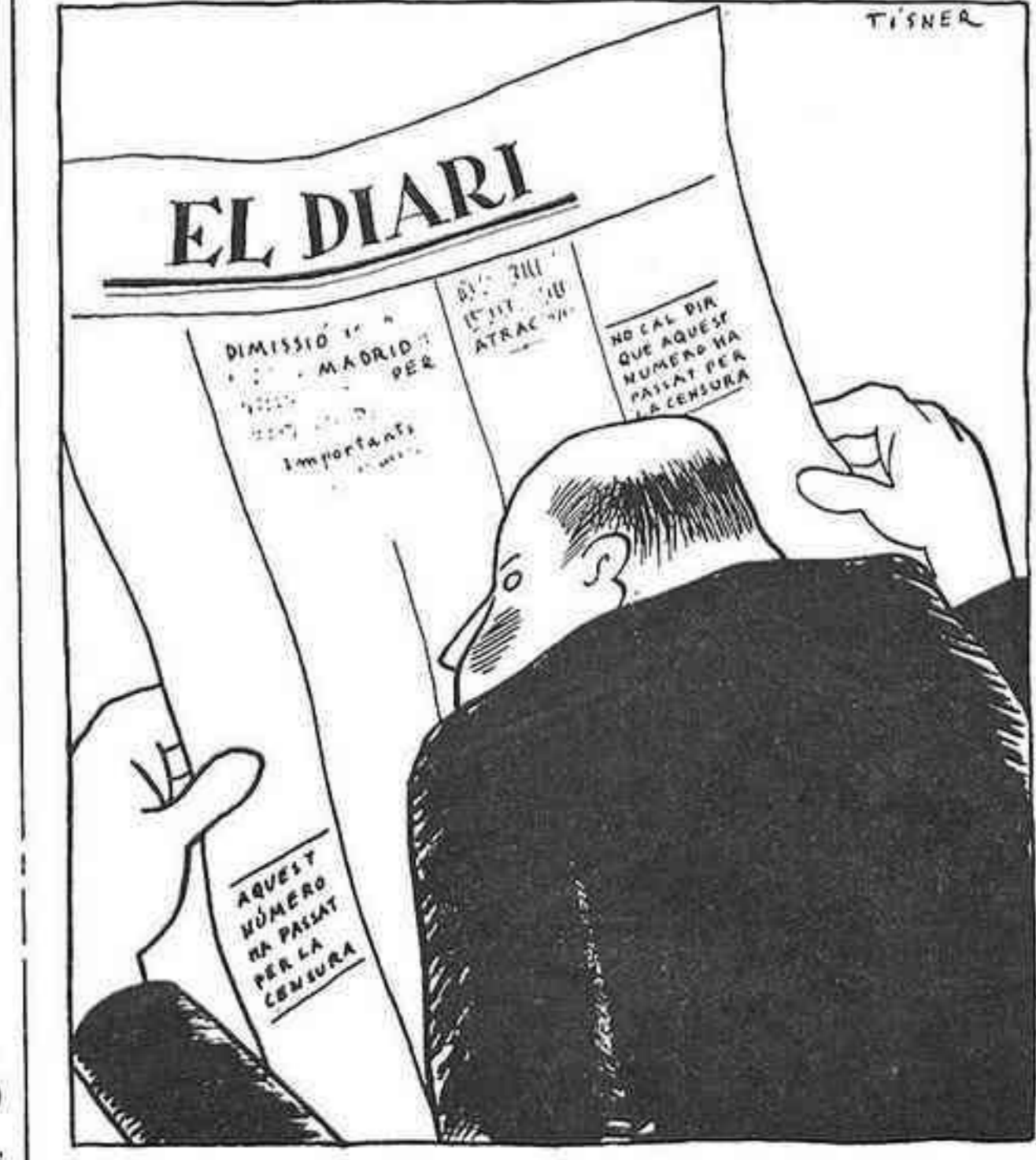
—Cada dia sóc més curt de vista!

Elegància i distinció. Demaneu sempre CORBATES GRANDMOND