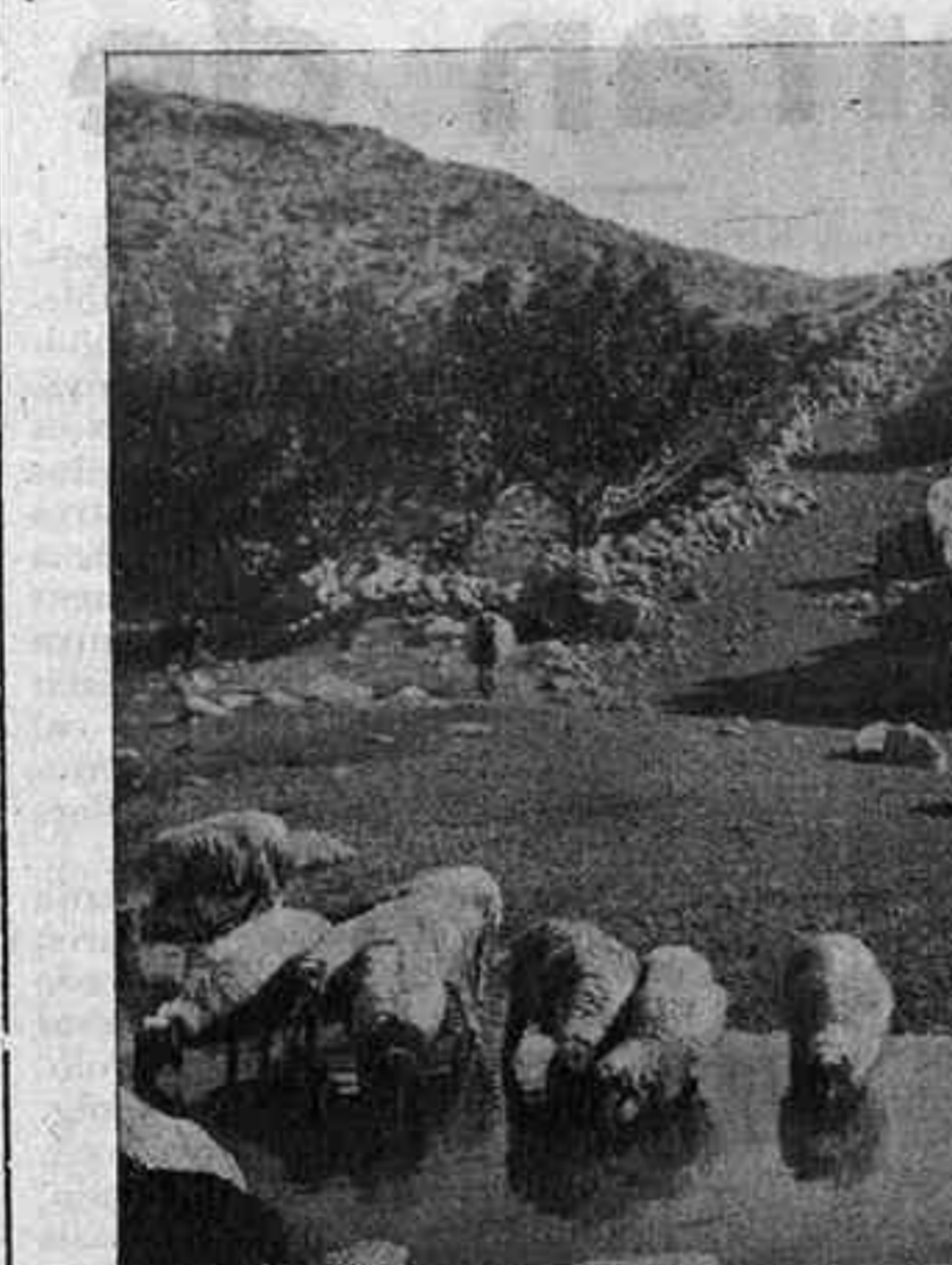
Pastors àrabs de Samària

com de la seva desapareguda beutat. En pocs anys, nosaltres hem fet més que ells en segles. El millor ordi neix a Gaza, arran del mar; els tarongers, amallers i vinyes han tornat a Saron; al peu de Nazareth, la plana d'Esdrelon produeix el sèsam i el blat.