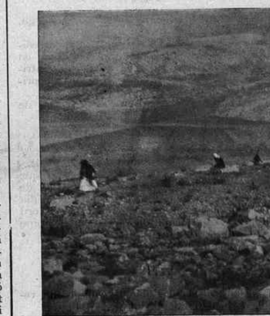
Autèntica vista d'un grup d'àrabs llançant-se a l'atac

per a dir que estem sotmesos, però ningú no negarà que és la renúncia a ésser l'amo en casa pròpia.