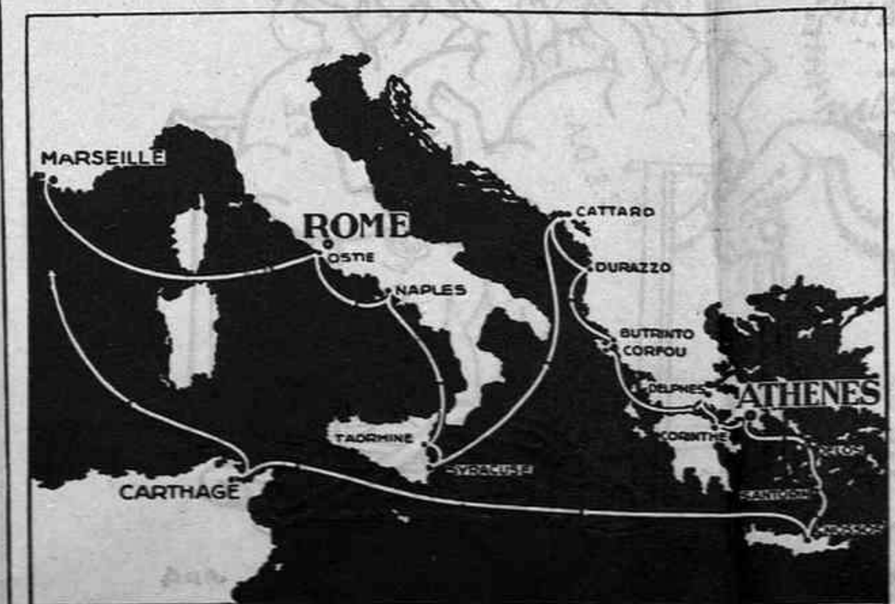
Itinerari del creuer de l'Association Guillaume Budé

Adreceu-vos ràpidament a "MIRADOR" Ronda Sant Pere, 3, Telèfon 24647, i us seran facilitats tota mena de detalls. No us deixeu perdre aquest esplèndid creuer. Aneu a "MIRADOR" a inscriure-us-hi.