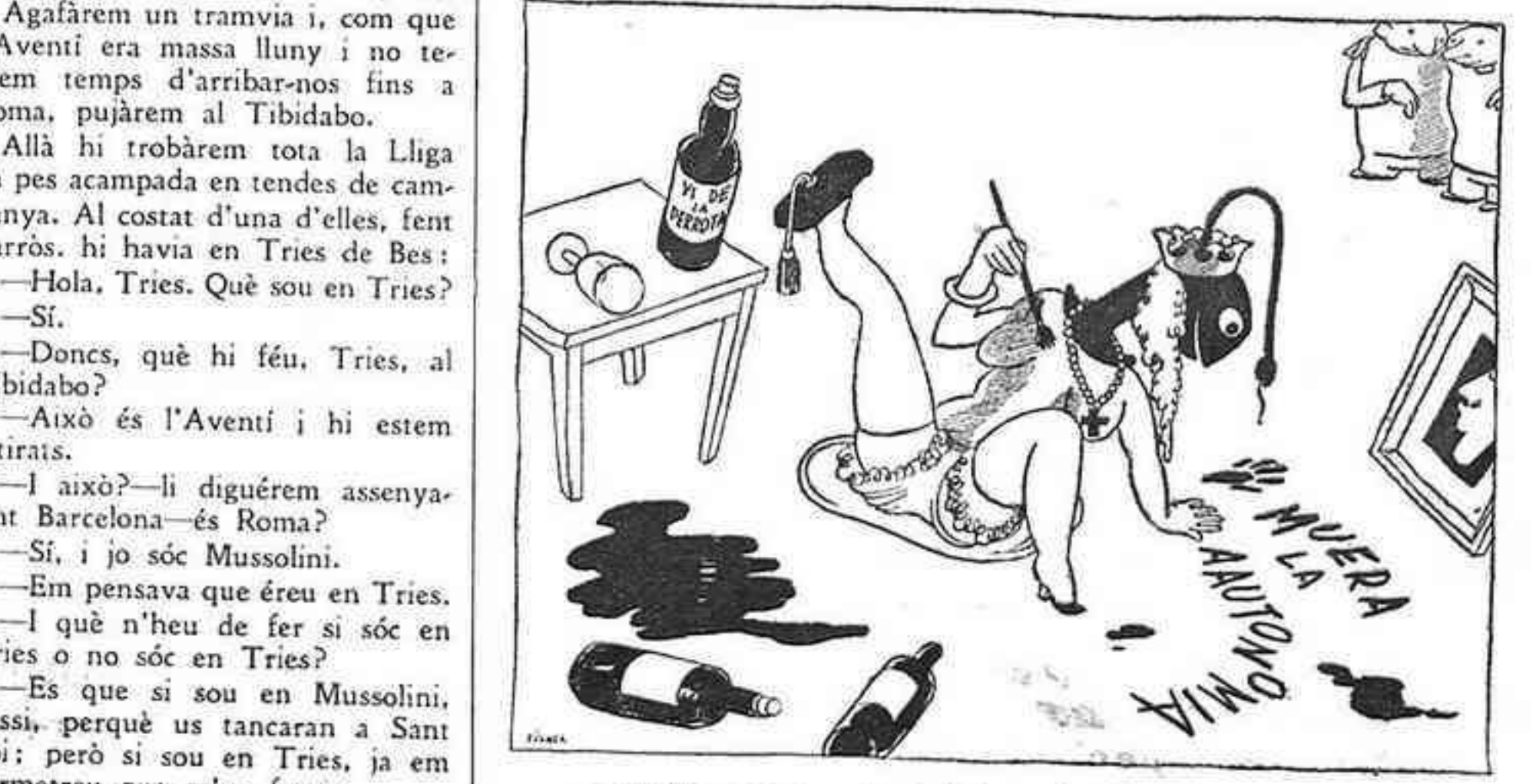
— Sembla que aquest vi li ha pujat al cap!

Ahir al matí els carrers que van cap a la part alta de Gràcia presentaven una animació extraordinària. Gent a peu, gent a cavall, gent a cotxe, en tramvia i en auto, en Rolls i en cafetera, en patinet i cotxet de criatura anaven a corrua feta carrer de Salmeron amunt.