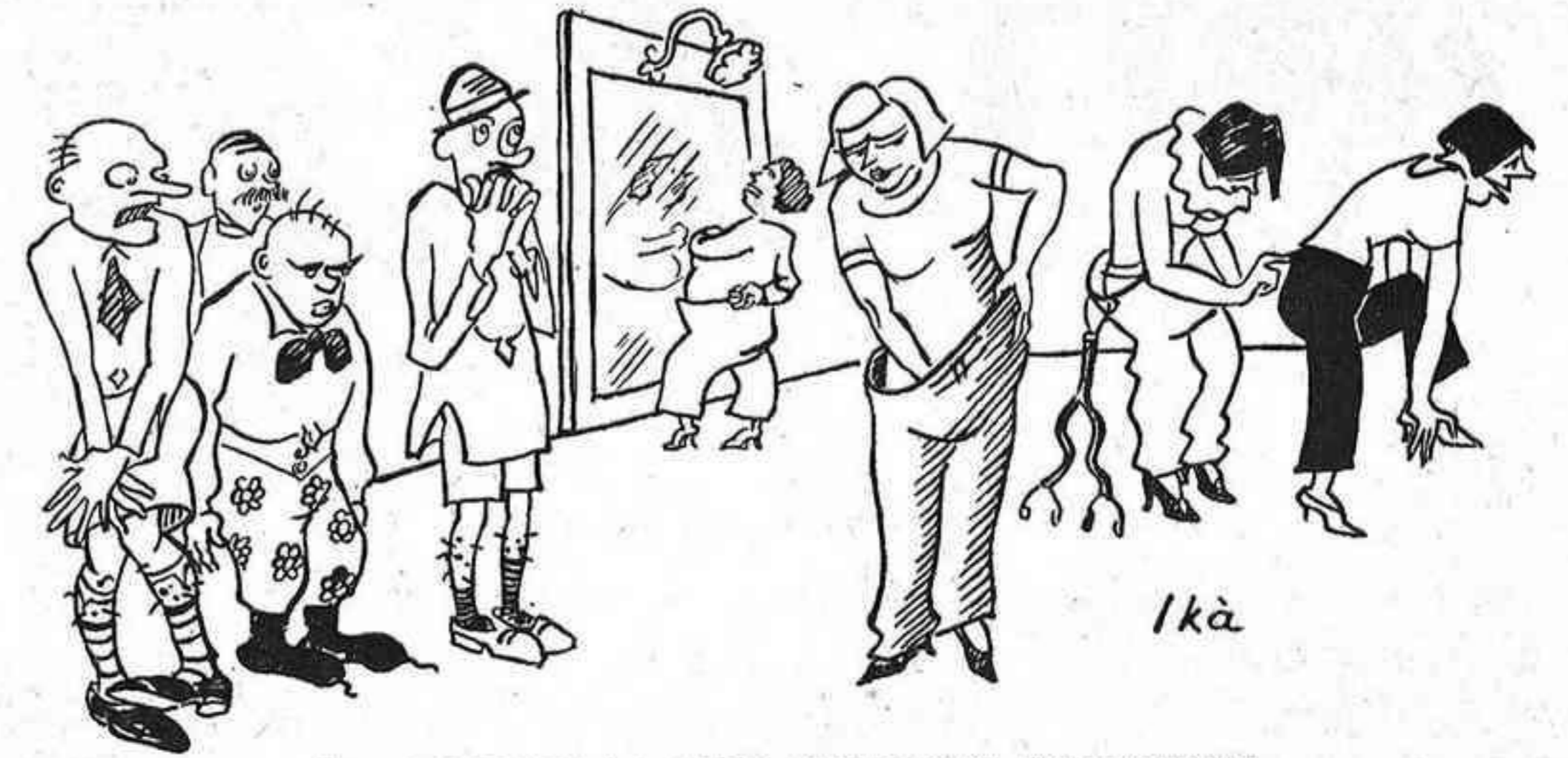
LES DONES DE LA LLIGA PUBLIQUEN UN MANIFEST

Sortírem de la villa; pels arbres cantaven tot d'ocells fets amb paper de Banc i de la Chade. brevari, sense ficar-se en res i, malgrat, dominant-ho tot. Don Esteve i la dona, cap al tard, anaren a les quaranta hores; fins aleshores havien anat a teatre.