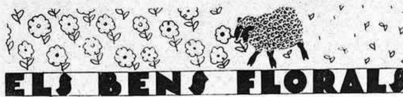
ELS BENS FLORALS