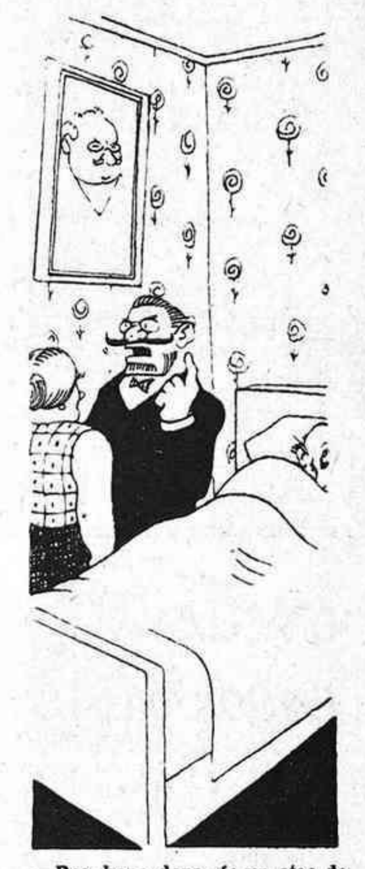
—Res, bona dona, és un atac de gola. —Ja ho pot ben dir, doctor; ja li ho deia jo que no li provaria el café amb gotes.

Quan va fer el seu primer discurs, el senyor Melquíades Alvarez, en tocar la qüestió catalana va tenir un cobriment de cor; però no ha escoltat els advertiments del destí i ara reincideix: en comptes de cobriment de cor, però, ara ha estat un cobriment de cervell, malaltia més greu; car més val un malalt que calla que un que parla; però, en fi, ¿com voleu que callés un personatge anunciat pel seu presentador amb