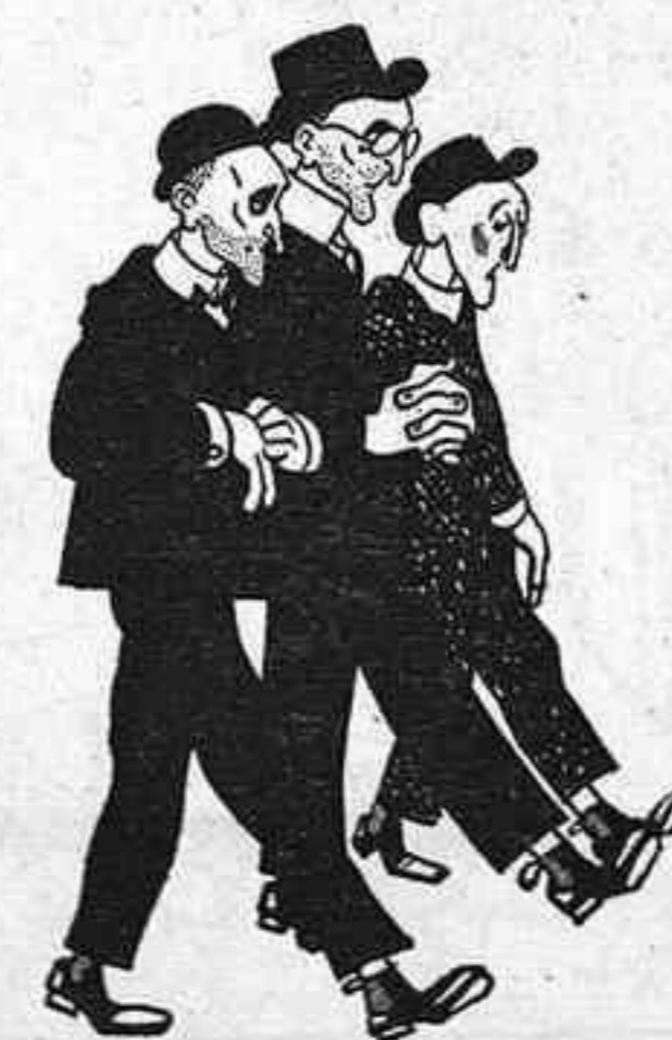
—Ara, amb vestit de país ¿qui és capaç d'endavinar si són jesuïtes?

En Segarra prepara una obra del segle XVIII i mig, immortal com totes els seves. Serà de riure.