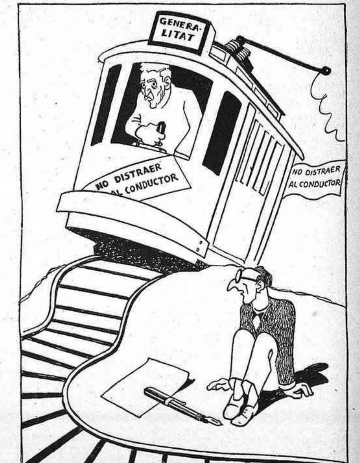
El President no pot fer declaracions