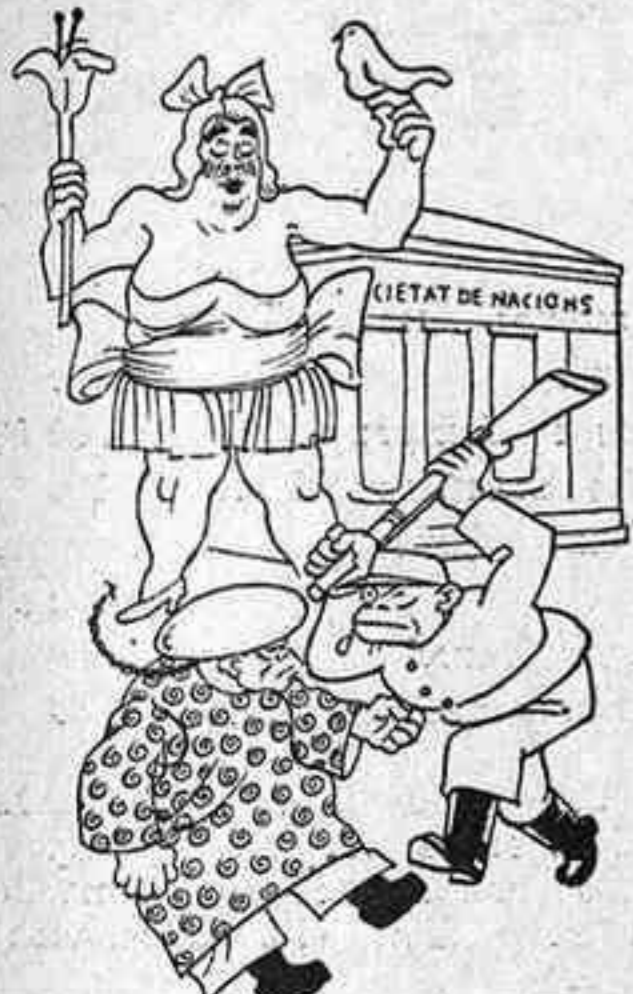
LA GUERRA GROGA

Hem servit tres xacولات als pares. Hi ha dues amaçones marejades. Ah!, la marejada és del S. S. O.