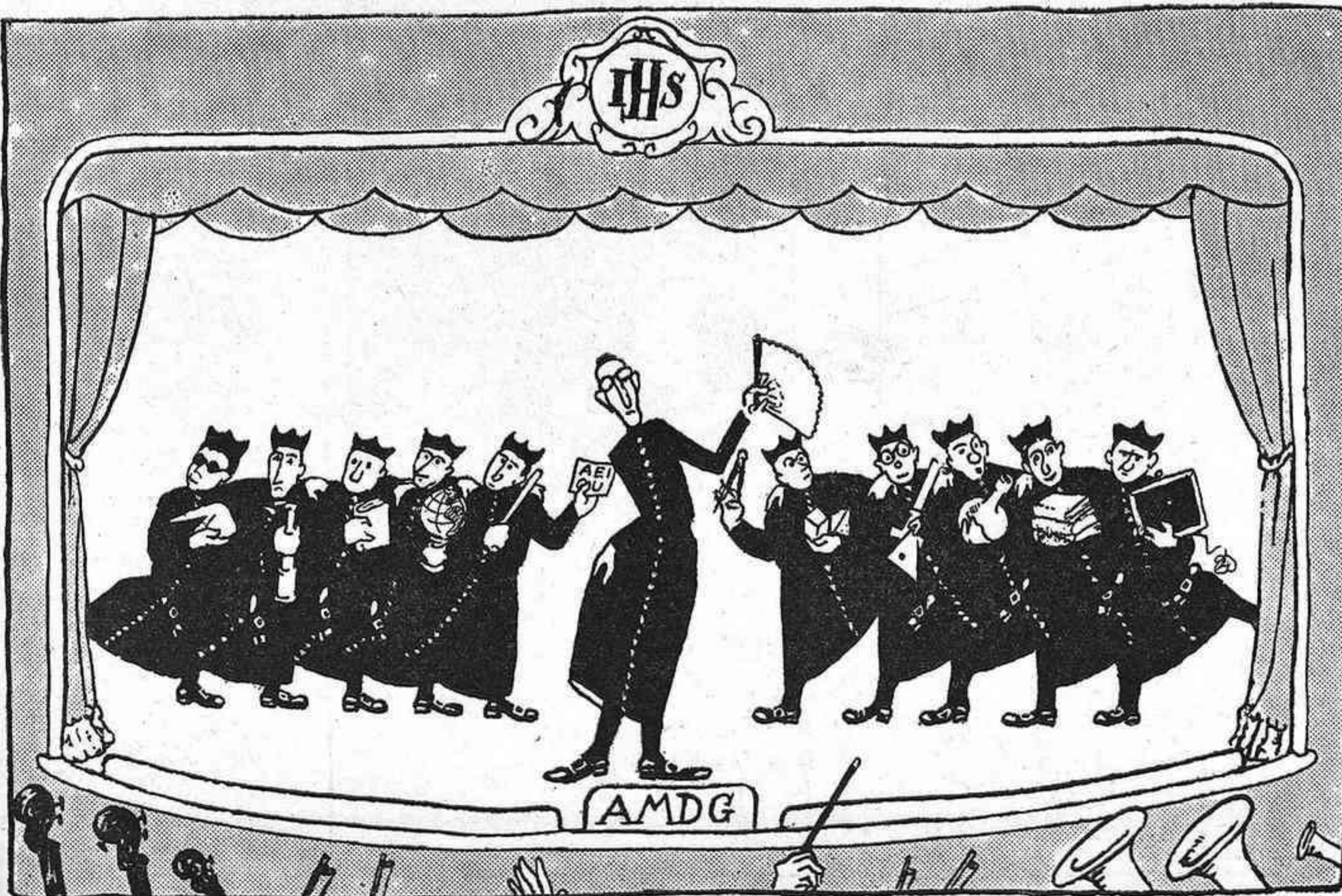
El debut de la companyia

Agafeu uns quants bots jesuïtics. Tireu en una caldera uns grapadets del primer bot quatre culles del segon, tot el contingut del tercer i del quart, 10 gotes provincials i després ho feu disoldre tot plegat.