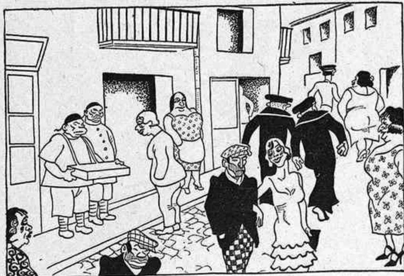
El barri xino de Barcelona, pocs moments abans de declarar-se el conflicte xino-japonès.

Poca mobilitat en el «Buenos Aires» (Turisme).