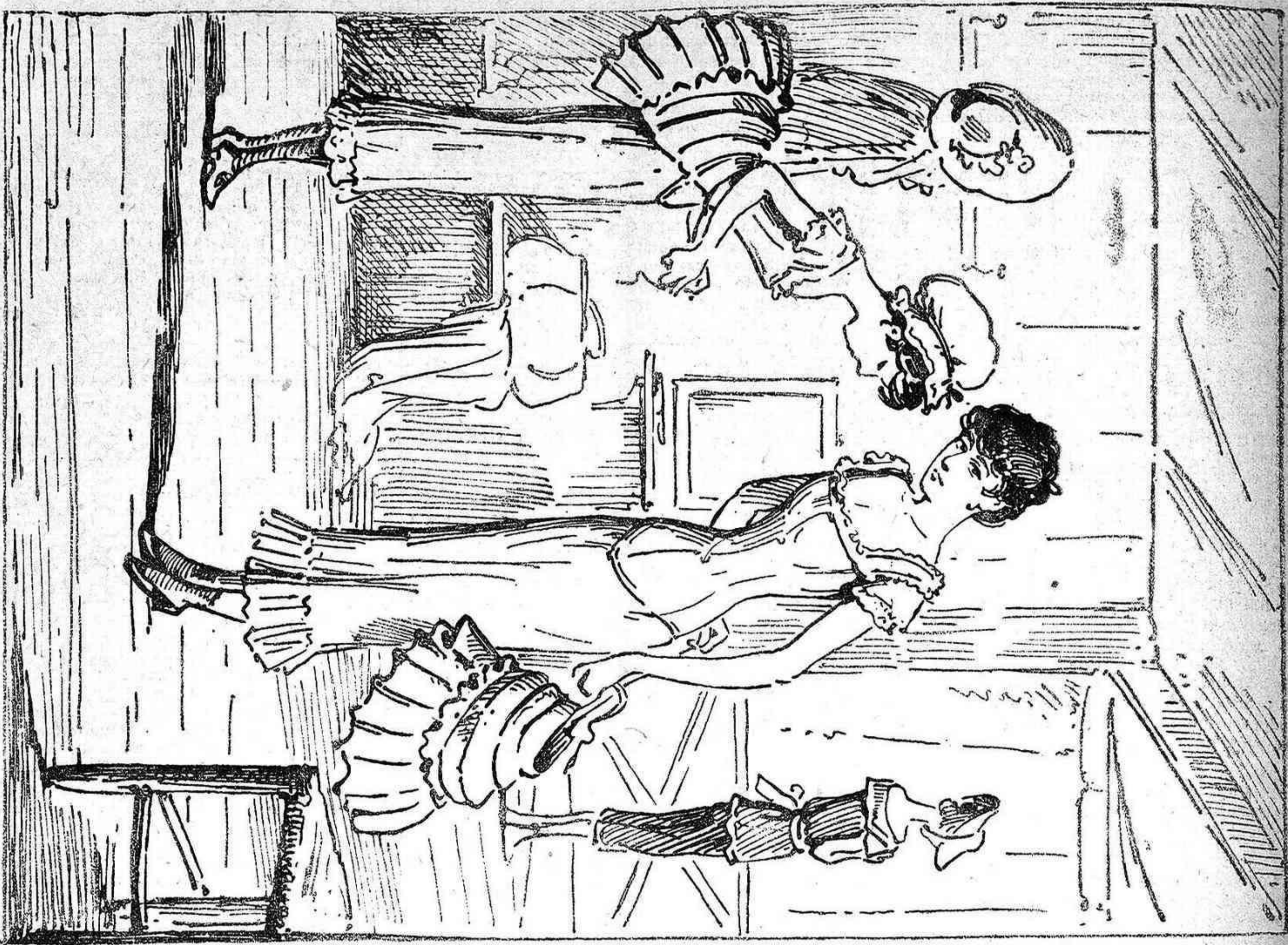
Las que s' ho posan y s' ho treuhen.