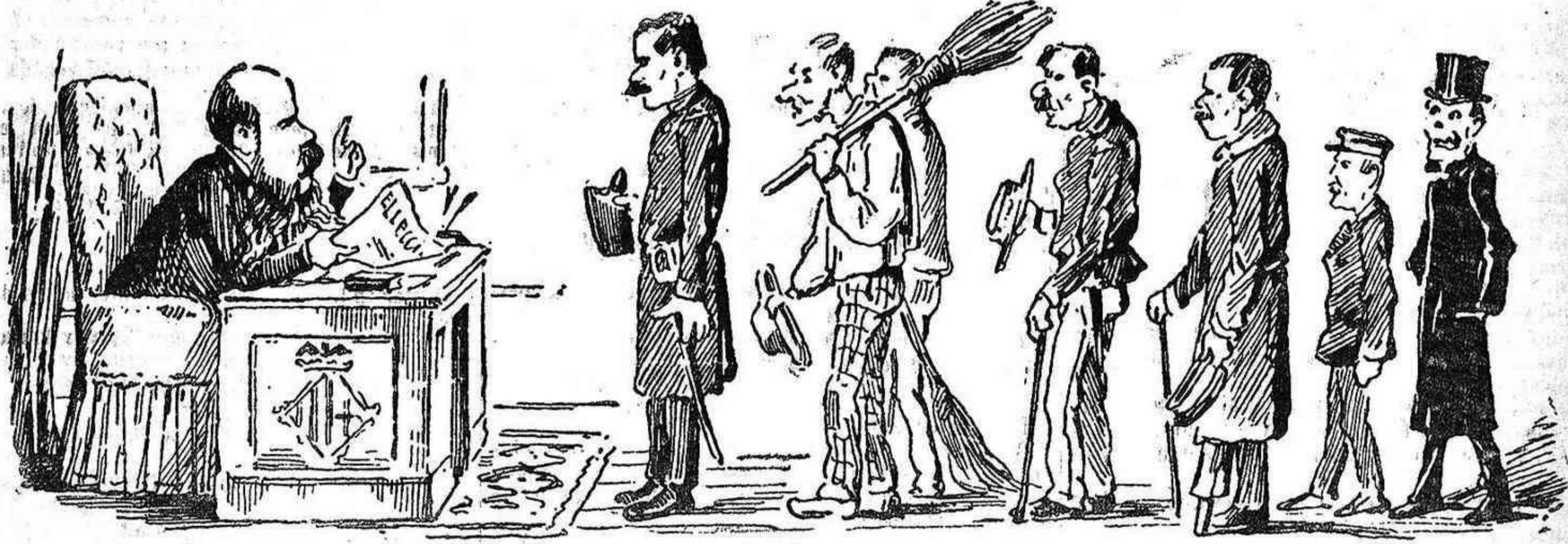
ELECCIONES MUNICIPALES.—Señores funcionarios. Las elecciones se aproximan... Cumplid todos con vuestro deber... Cuarenta y nueve concejales desde sus escaños os contemplan.