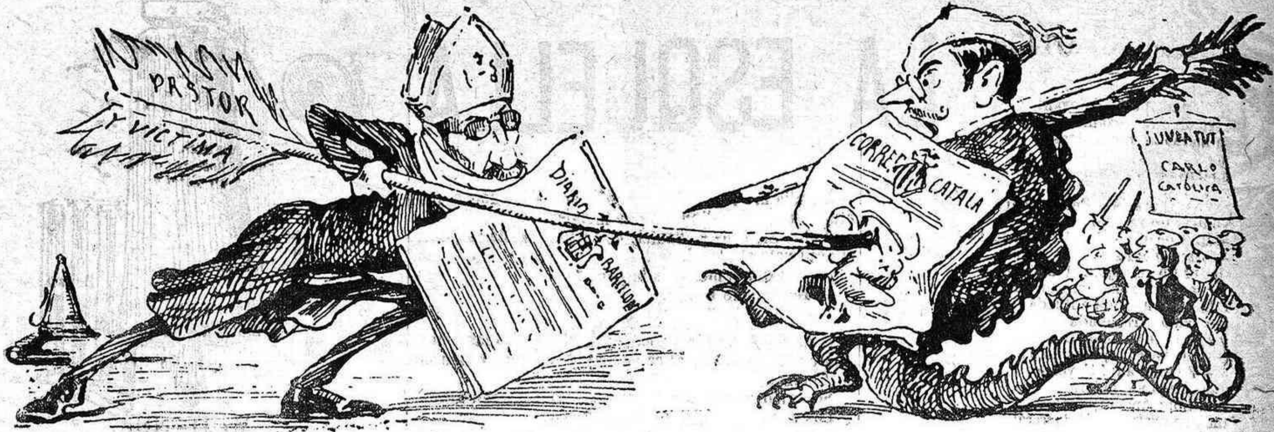
Gran batalla ha comensat entre carcas y mestissos.