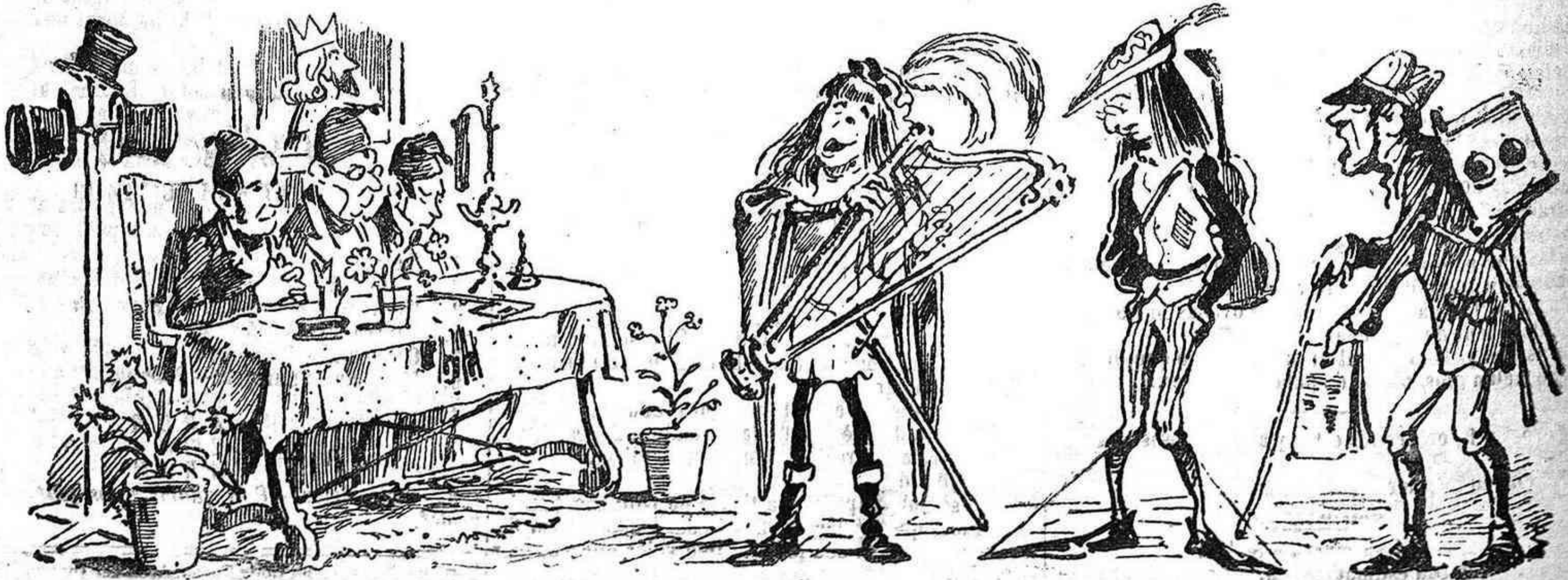
JOCOS FLORALS DE 1883.—E se farà la feste á la faysó de les antigües usançaes ó no se 'n cantarà gal ni galina.