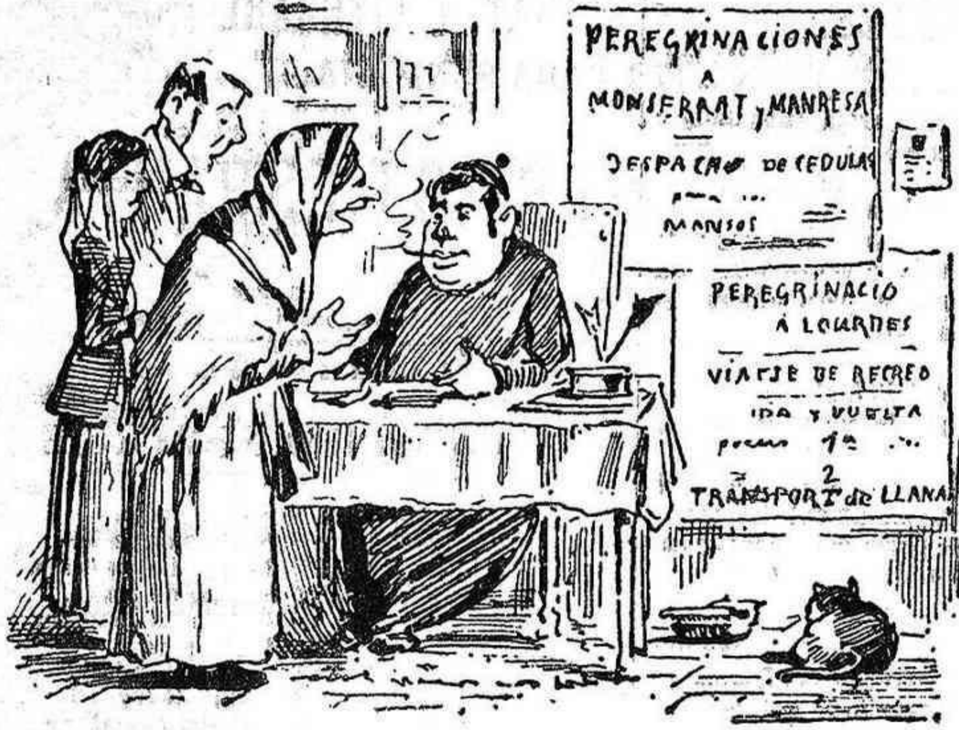
PEREGRINACIONES.—Ja 's coneix que s'acosta 'l temps de sortir á pastorar.