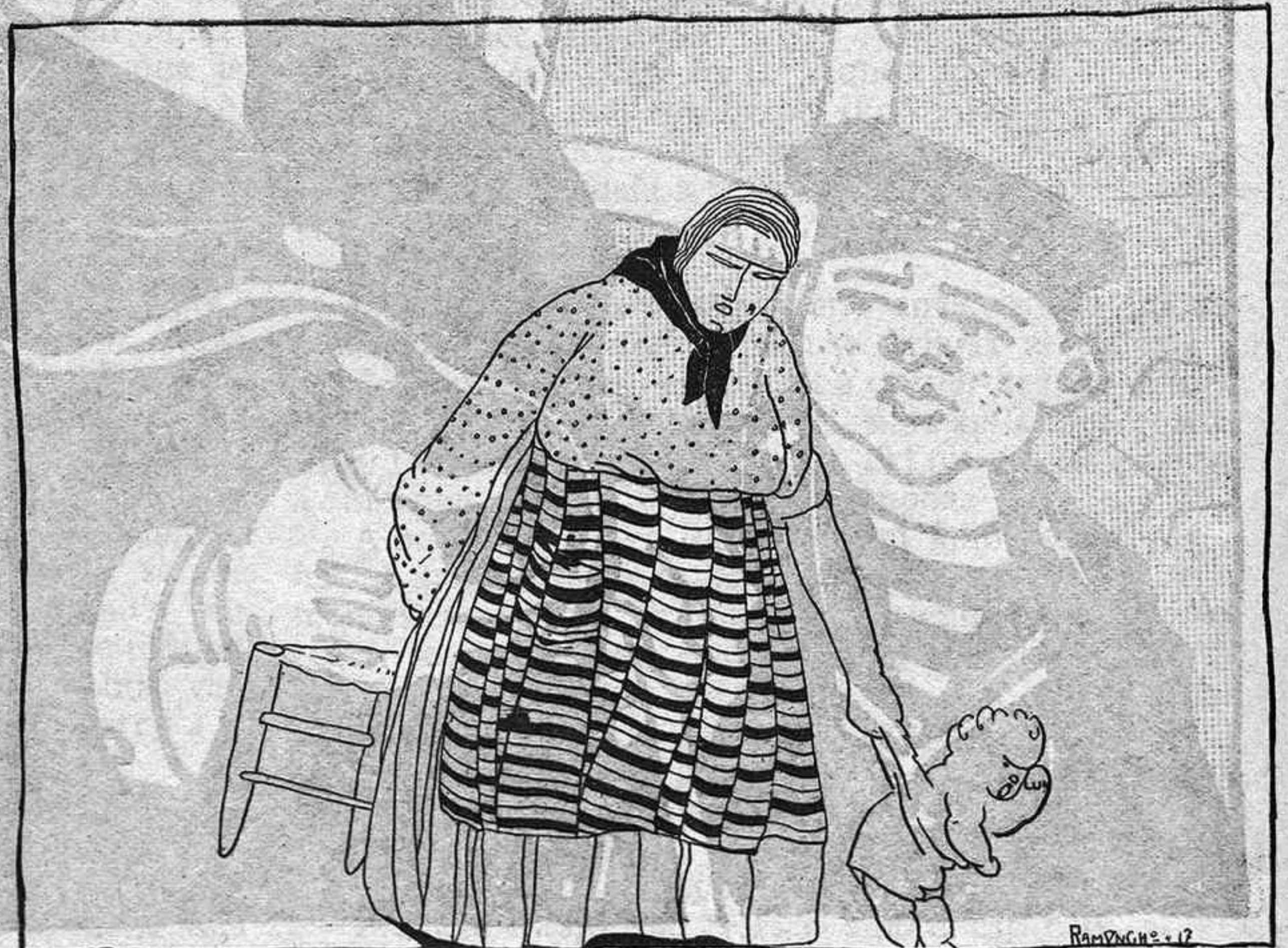
LA MALA MADRASTRA

Aqueixa estrena i una altra, del mateix autor, que se'n