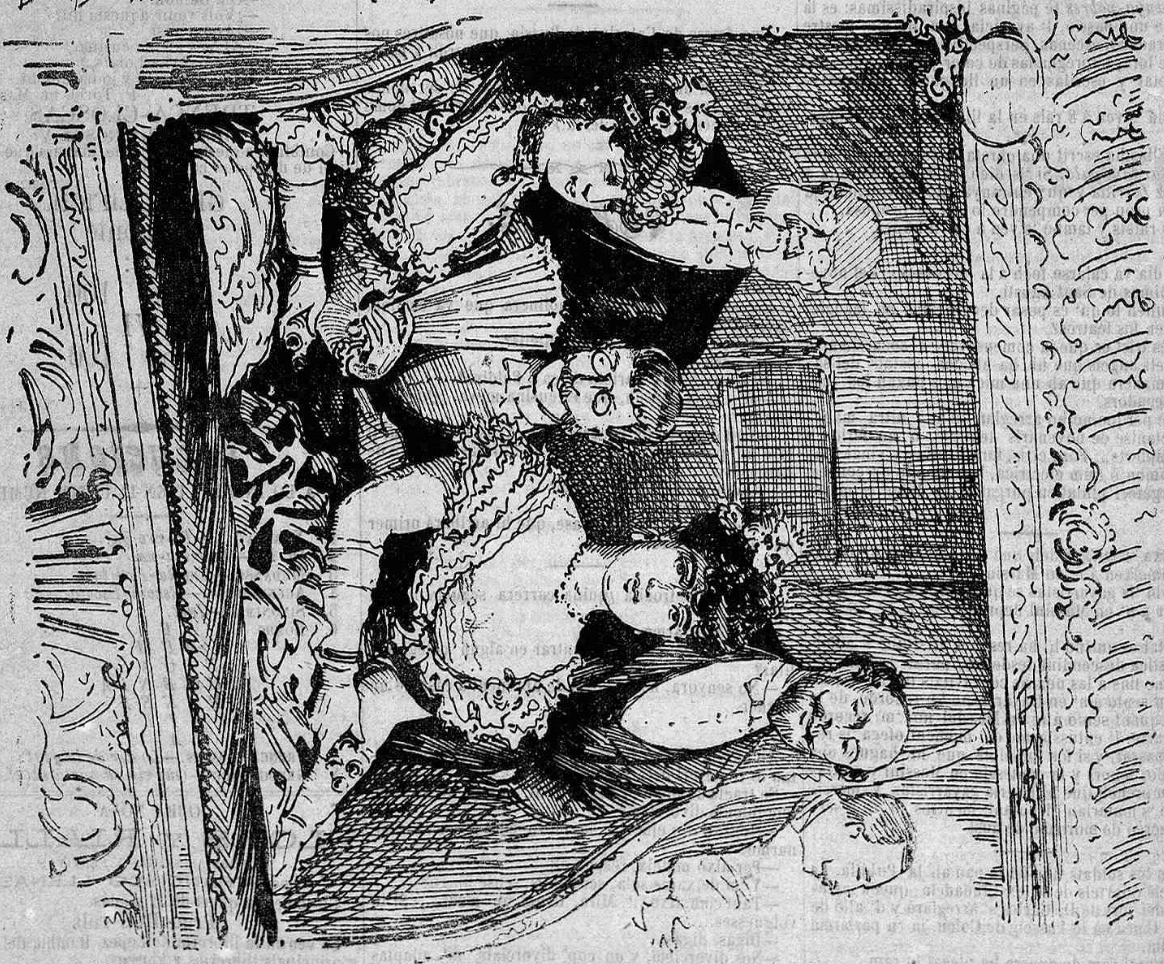
Al vespre á veure en Gayarre.