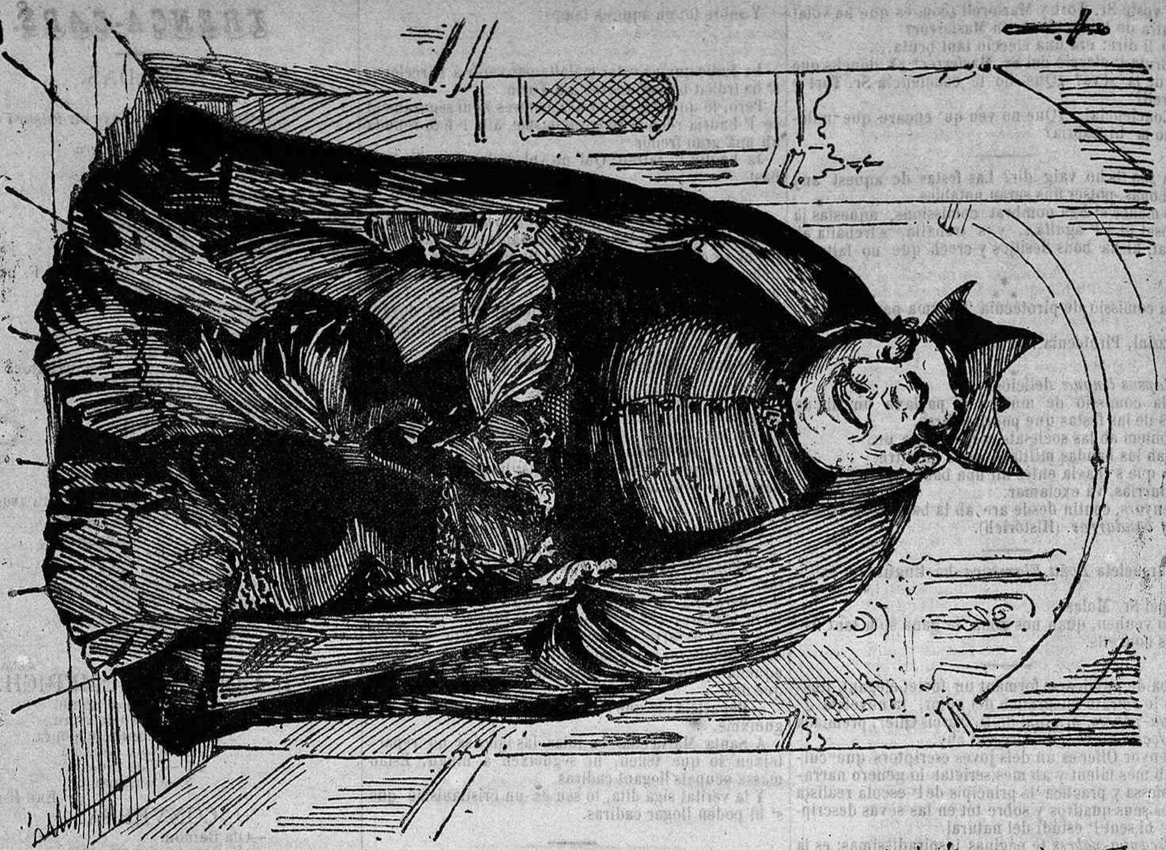
Al dematí á veure 'l confés.