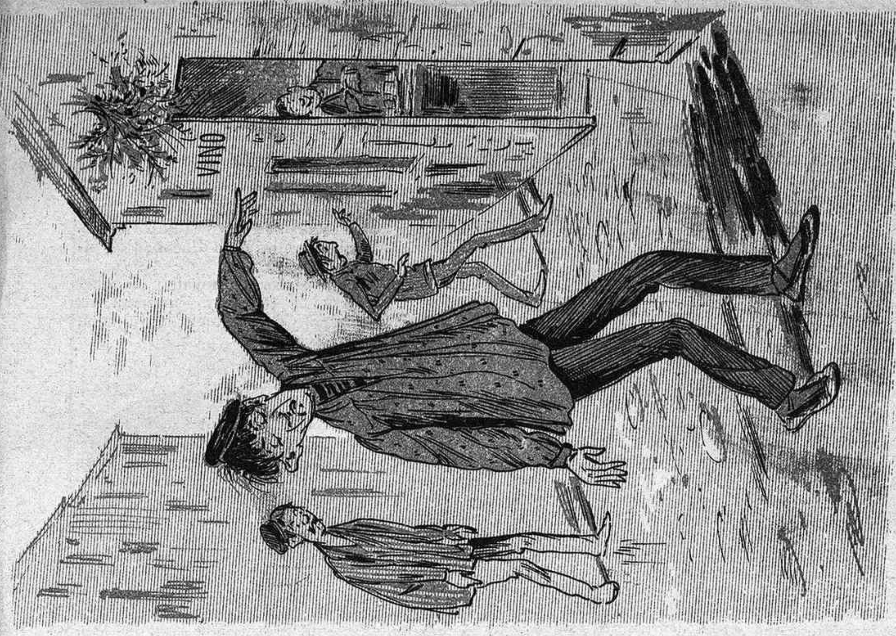
L' afició que alguns devots tenen á las altiras estacions, acaban casi sempre ab l' ajuda del carretó