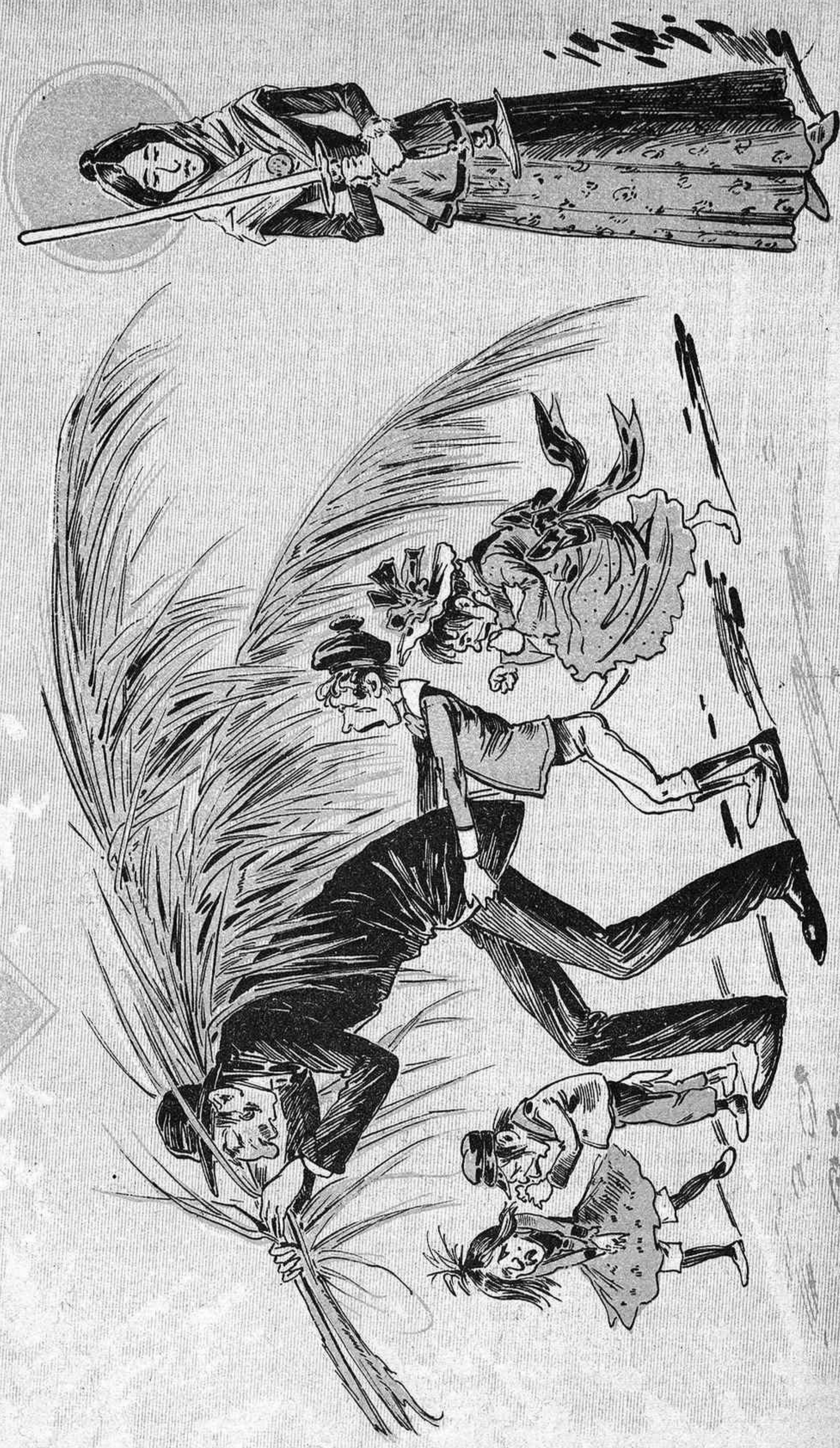
Vais, ve hi ha res com el goig de la família. Donava guet veure al sevyó Bemat tornant el goig a la família. Donava guet veure esquena, per evitar las rabequierías deis quatre serafins que no volían portarlos per falta de confituras.