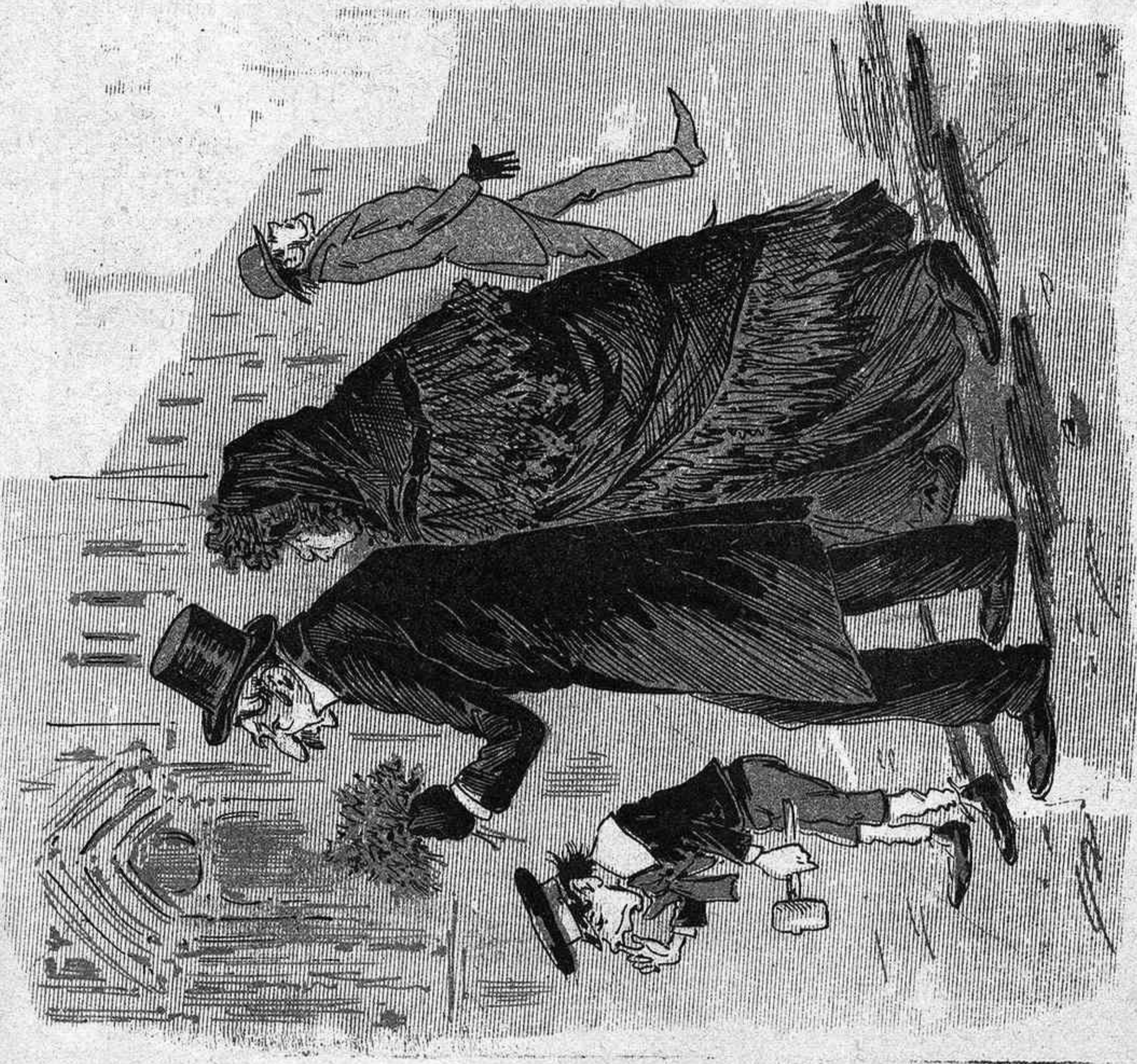
—Apa Caimiú : no rondinis y camina ab un xich de brillo, qué no mes ne faltan visitarne dotze per estar llestos