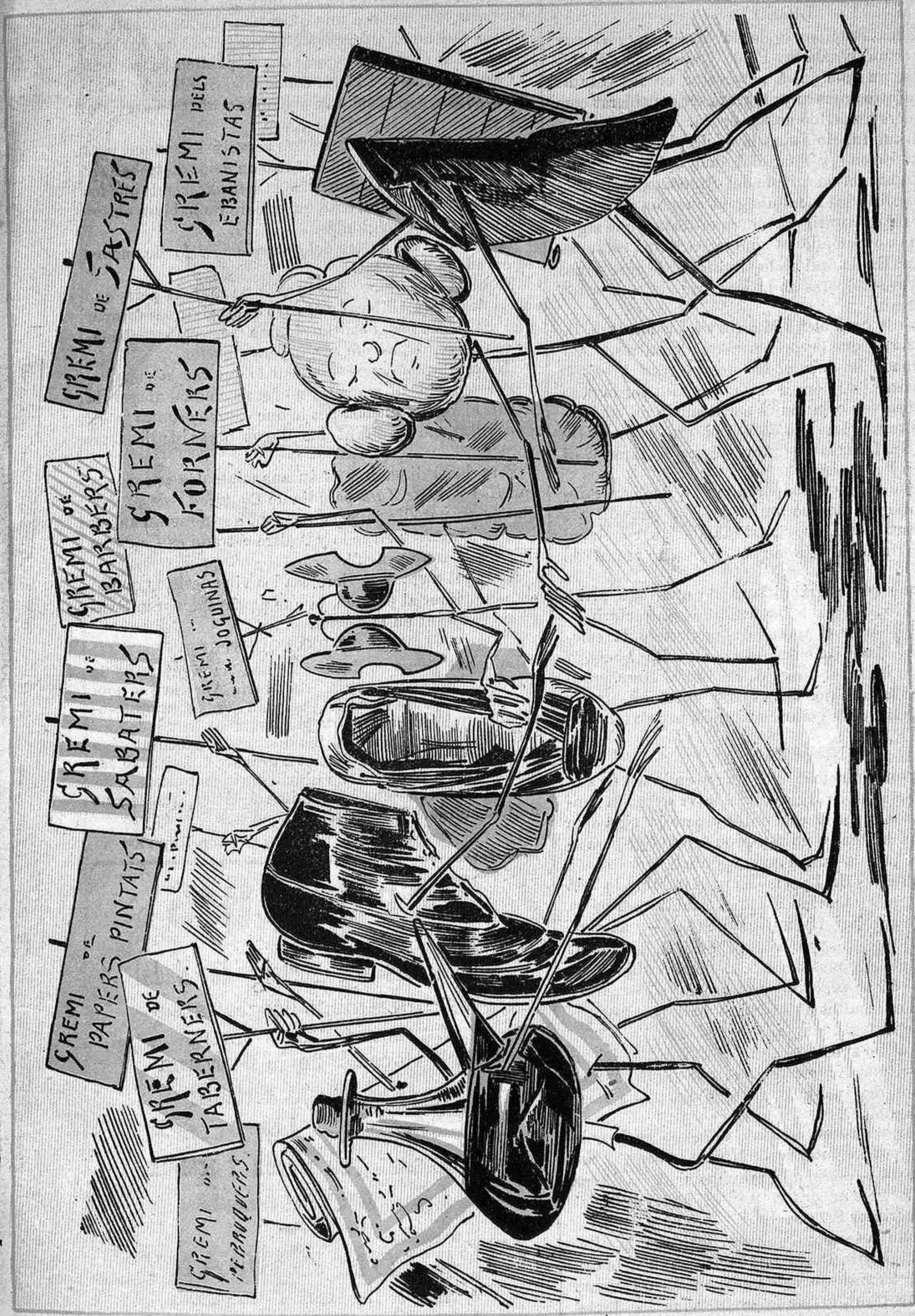
Al gas declaran la guerra els gremis de la ciutat, ja veurém d' aquí uns quants días qui posa l' esquella al gat.