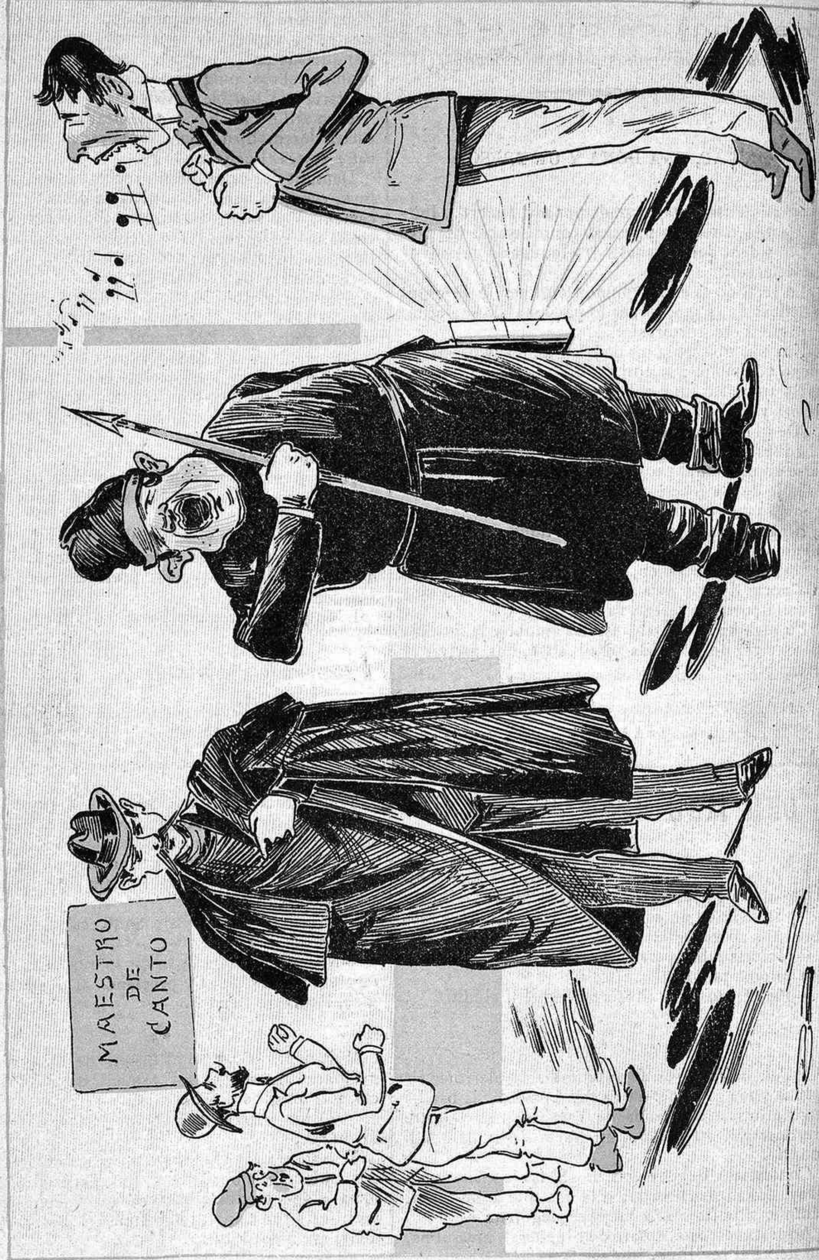
Cada época te las sevas mononias: Ara comensa la gran xifladura dels cantadors. Els aspirants a Paleis, es contan per dozenas que fan qua a la porta del mestre Gouia.