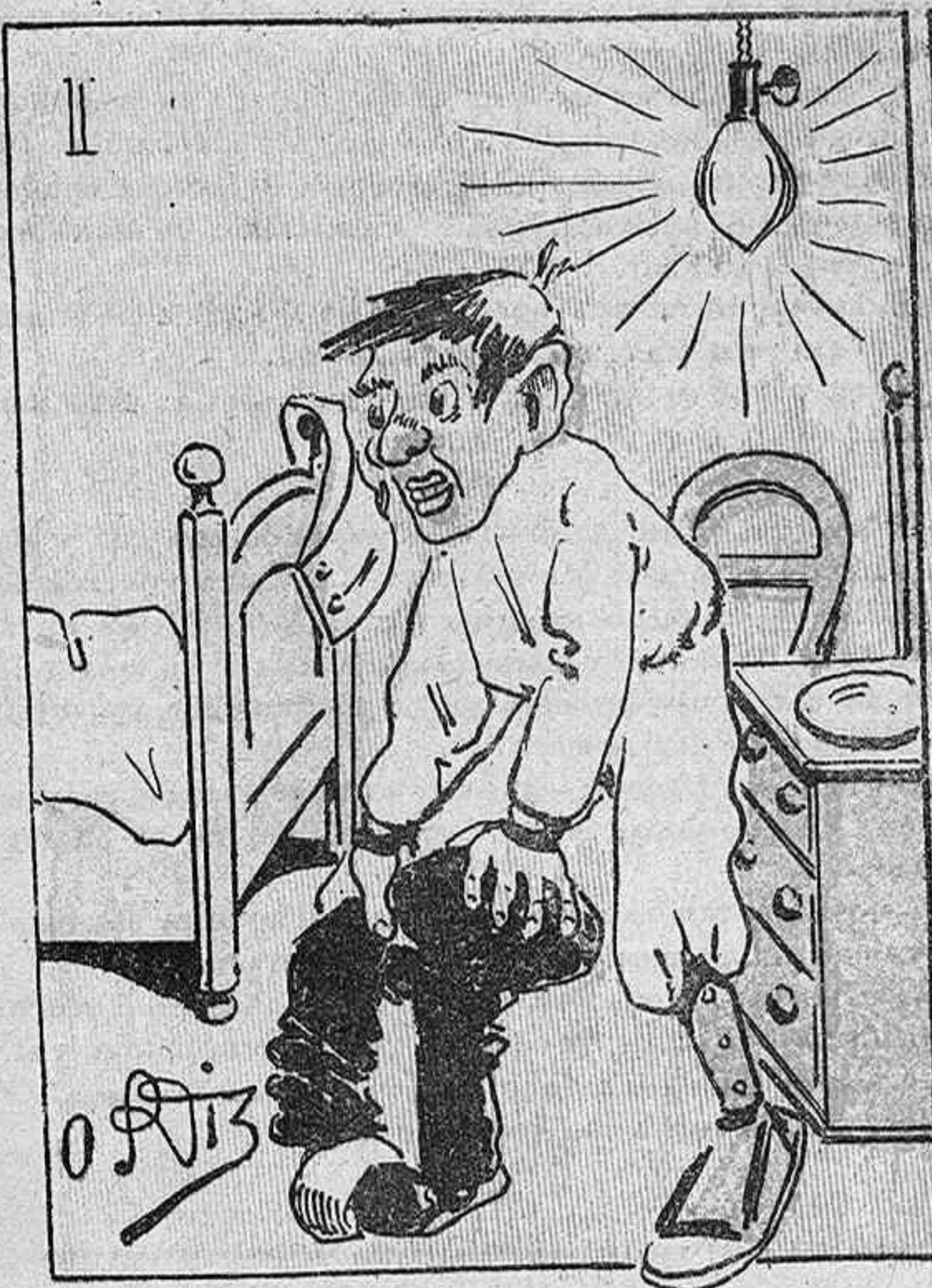
—Apa, Nofre ¡cap al llit! ¡Jo estich tip de tant burgit!