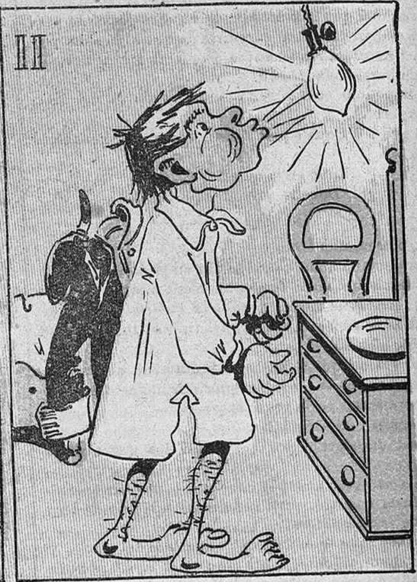
—¡Veig qu' aquest llum es molt plaga! ¡Jo prou bufo... y no s'apaga!