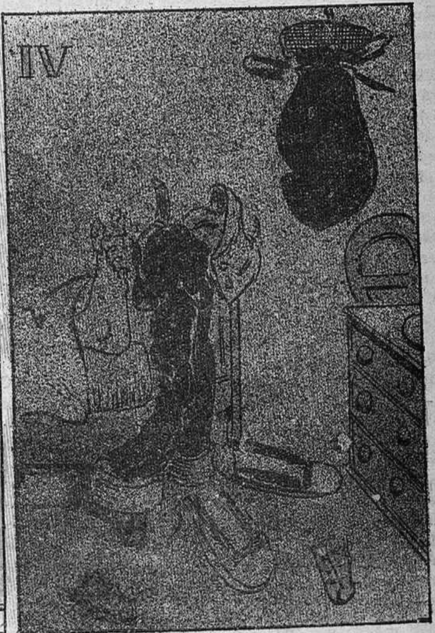
—¡Vaja, jo puch ser pagés; mes de tonto no 'n tinch rés?