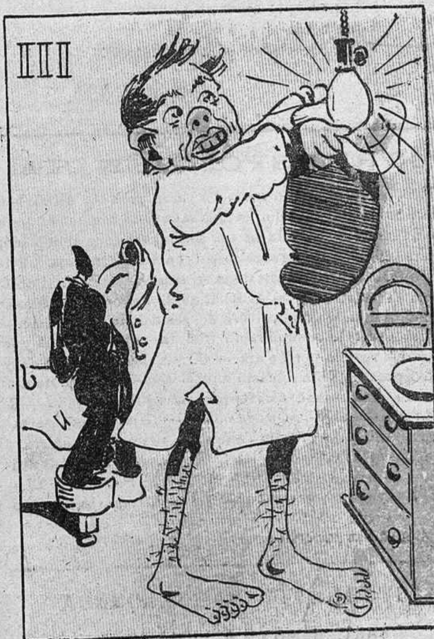
—No s'apaga? ¡Ay bona nina! ¡Malo ab la barretina!