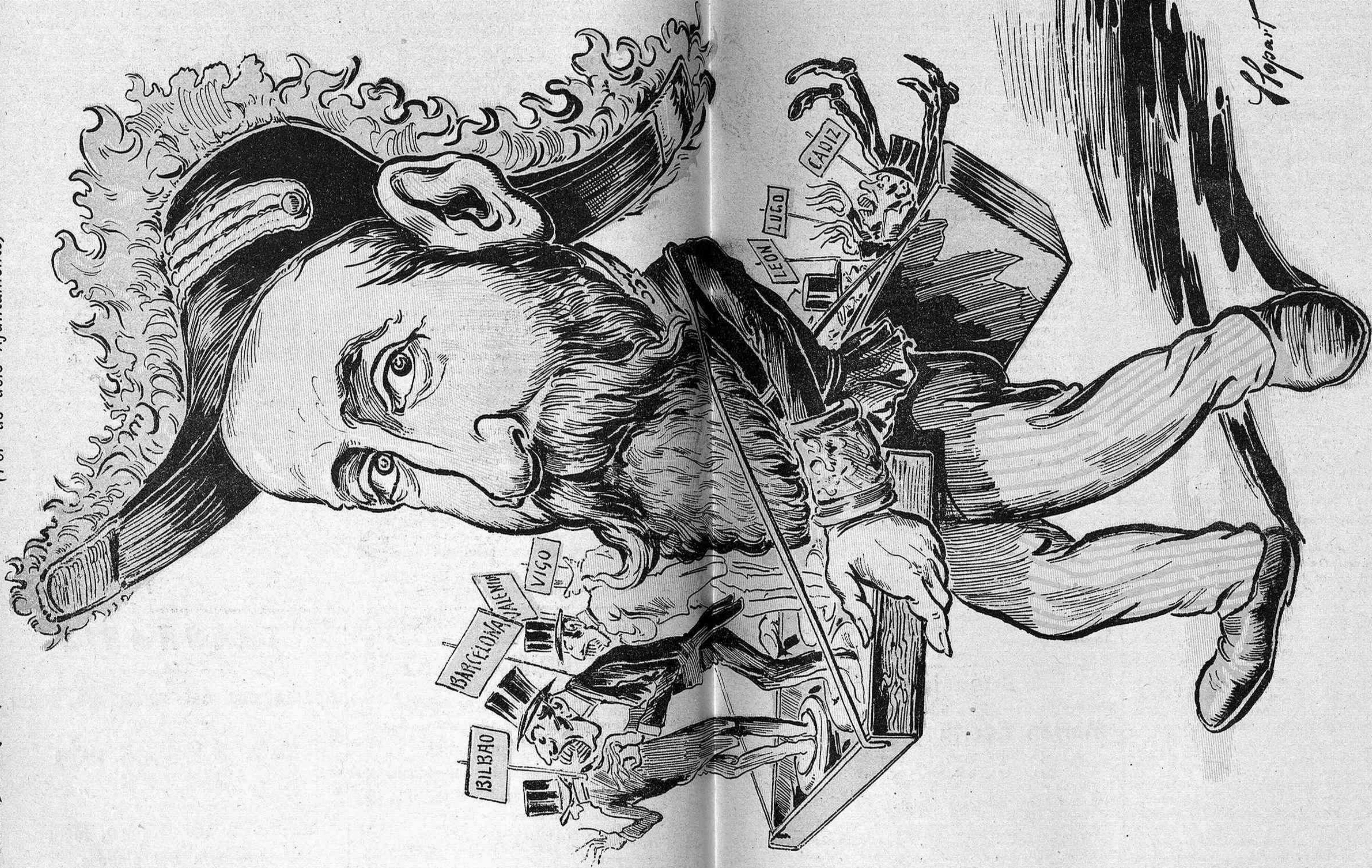
L'últim modelo que 'l'forn are cou. Aquets secretaris son del motillo nou.