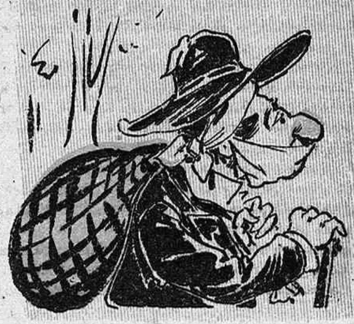
A péu m' en torno á Uldecona. ¡Prou festas de Barcelona!

—A cada punt surt y entra, are pols, are mullat... ¡vaia, prou! portéume á casa! no vuy fer més els gegants!