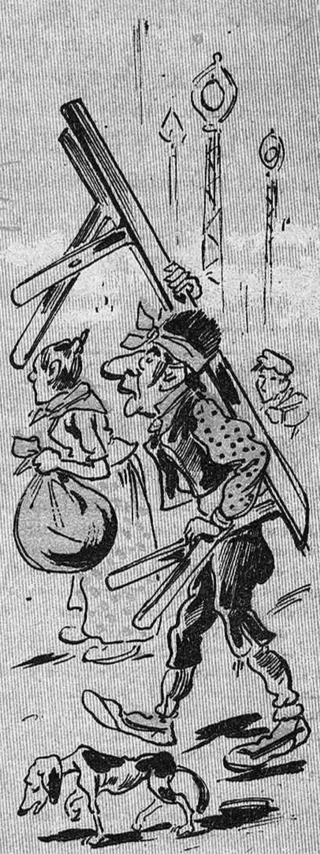
Carregats ab els neulers ja s' en van els forasters.