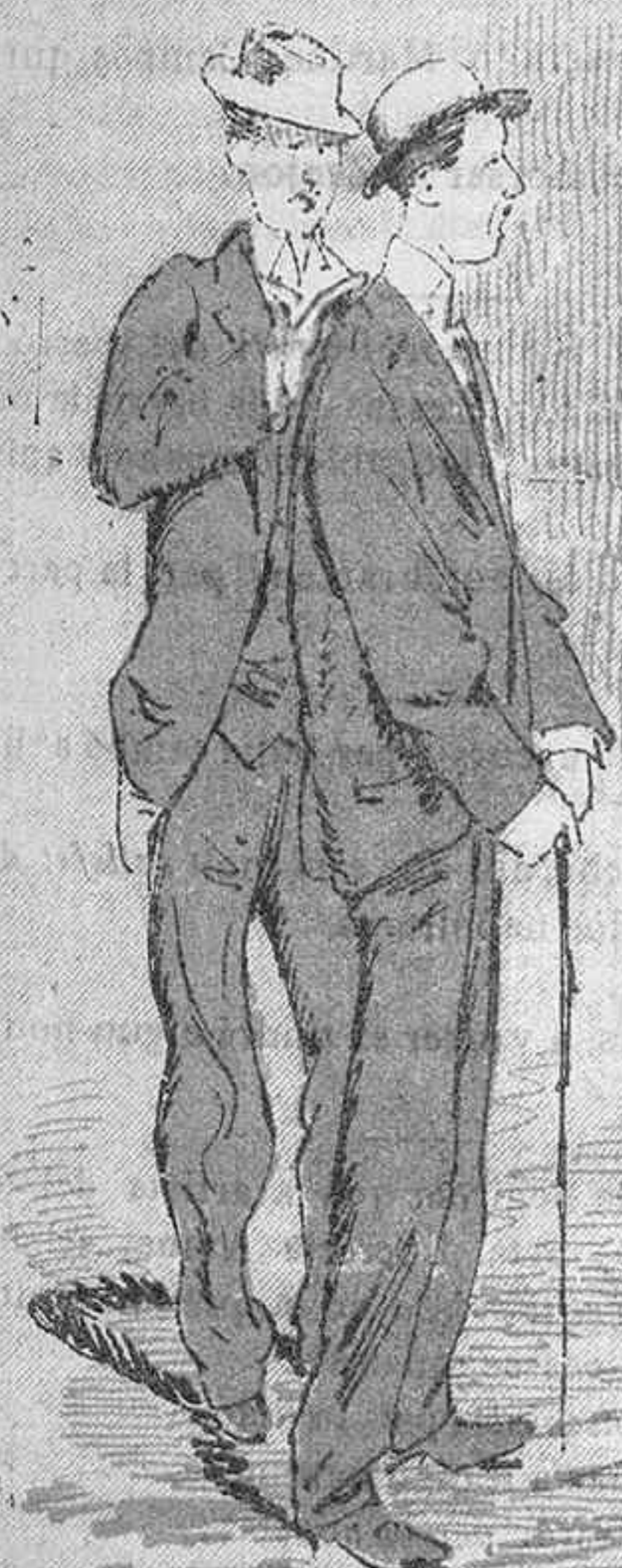
--Noy, jo 'm pensava que ho feyan avuy y diu «el siglo que viene»... entornemsen.