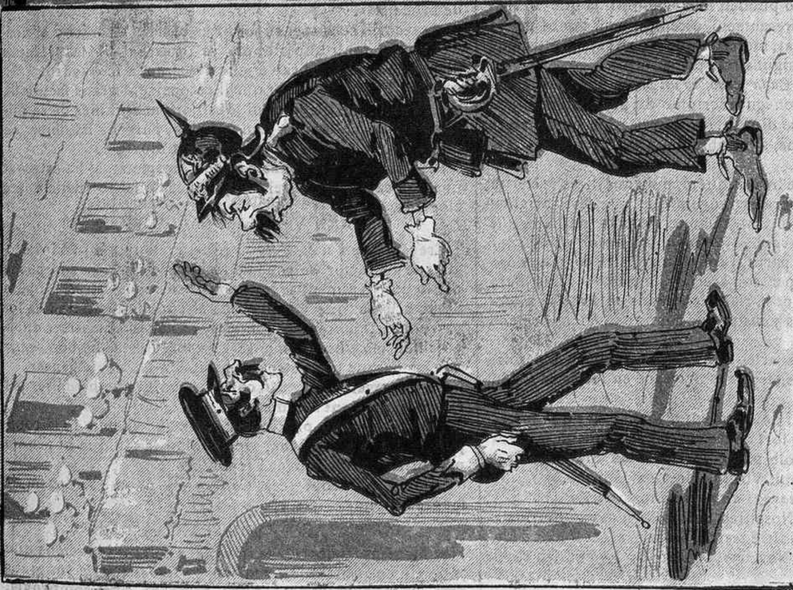
—Dicen que el señor Crostoni no niega res & ningú... yo estoy por pedirle un vestit nou. —¡Me caso ab rondal Jo l' hi portare la décima del any passat!