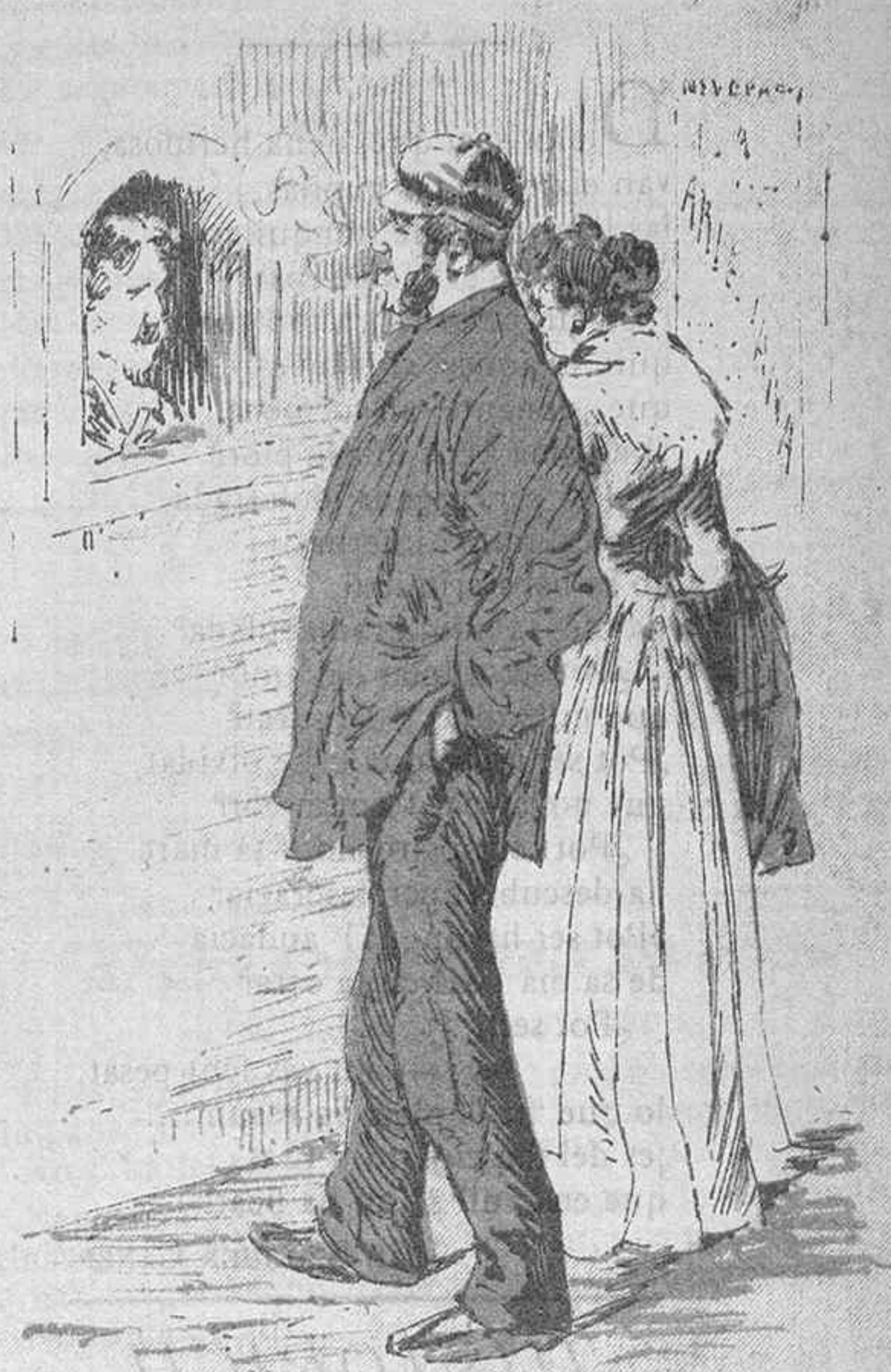
--No hi ha butacas? y donchs qu' hem de seure a terra?