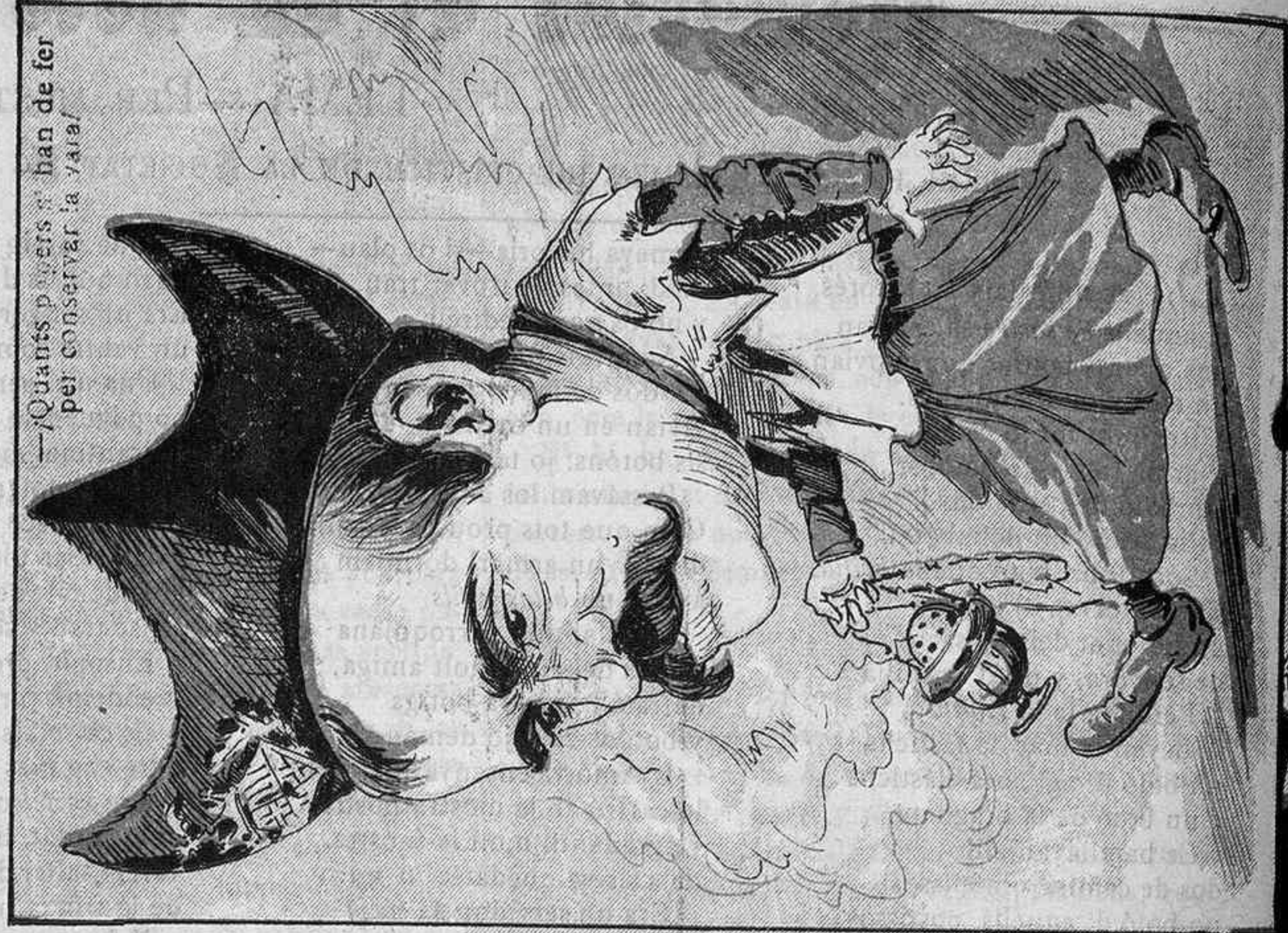
—/Quants papers s'han de fer per conservar la vara.