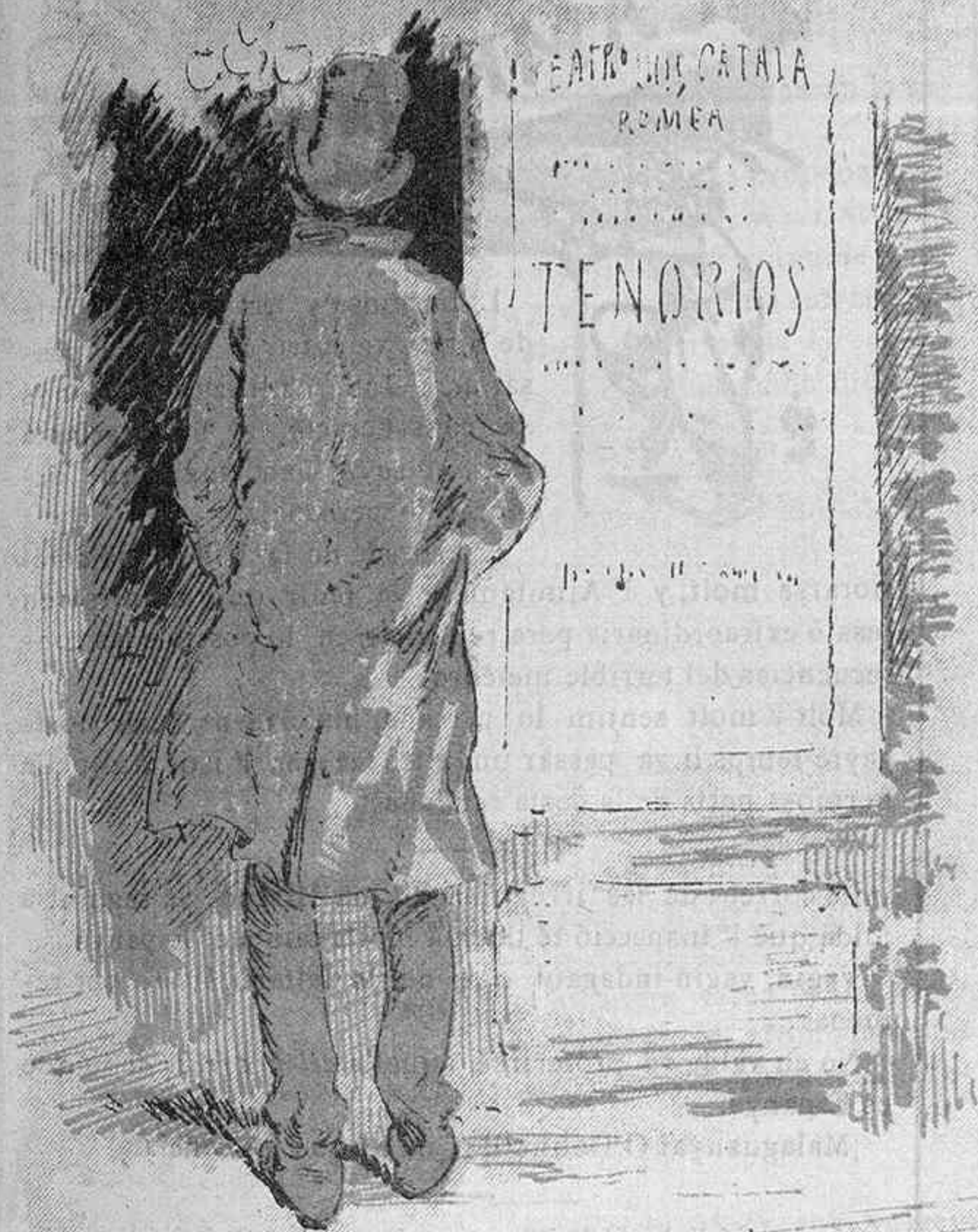
--Crech qu' ab avuy l' hauré vista trenta tres vegadas.