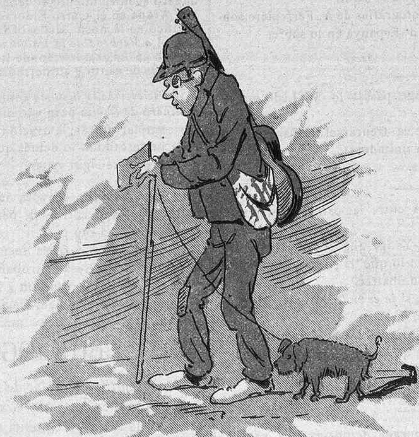
Veig que lo fer de cego dona mes que 'l treballar.