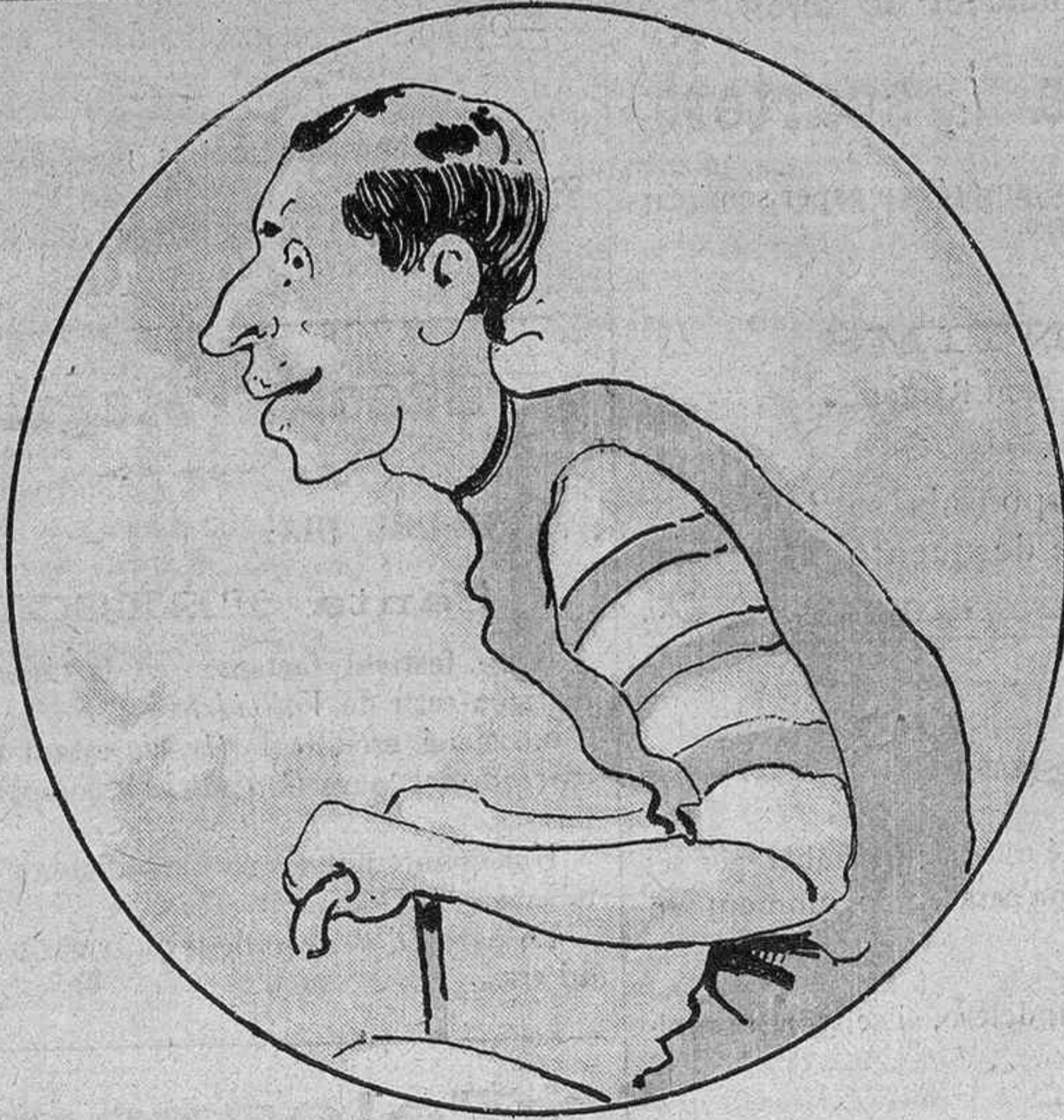
—Aquella polla es la que 'm farà quedar malament.