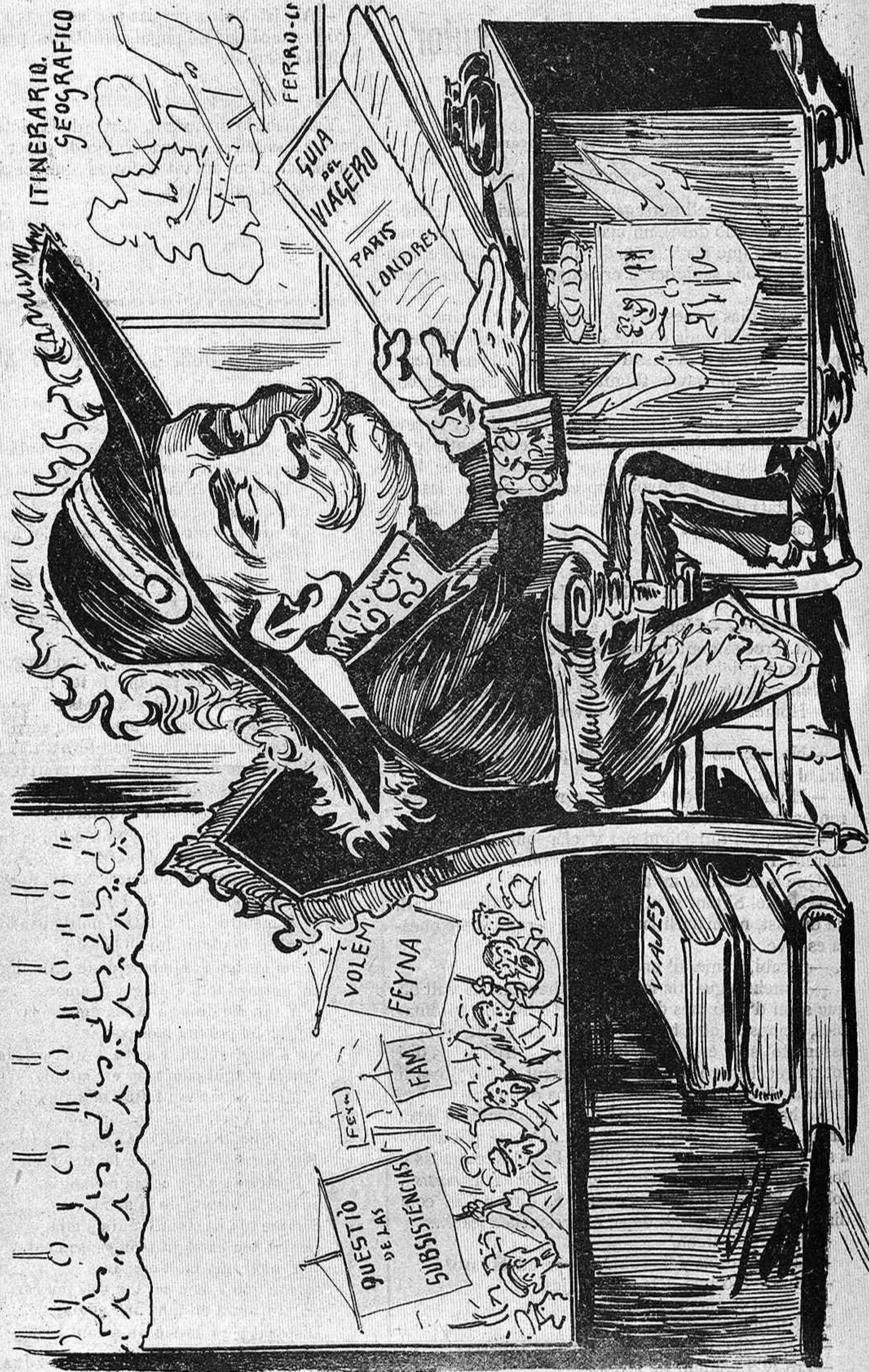
Mentres ell per divertir-se desplega l'activitat, el poble 's distreu la gana demanantli pa y treball.