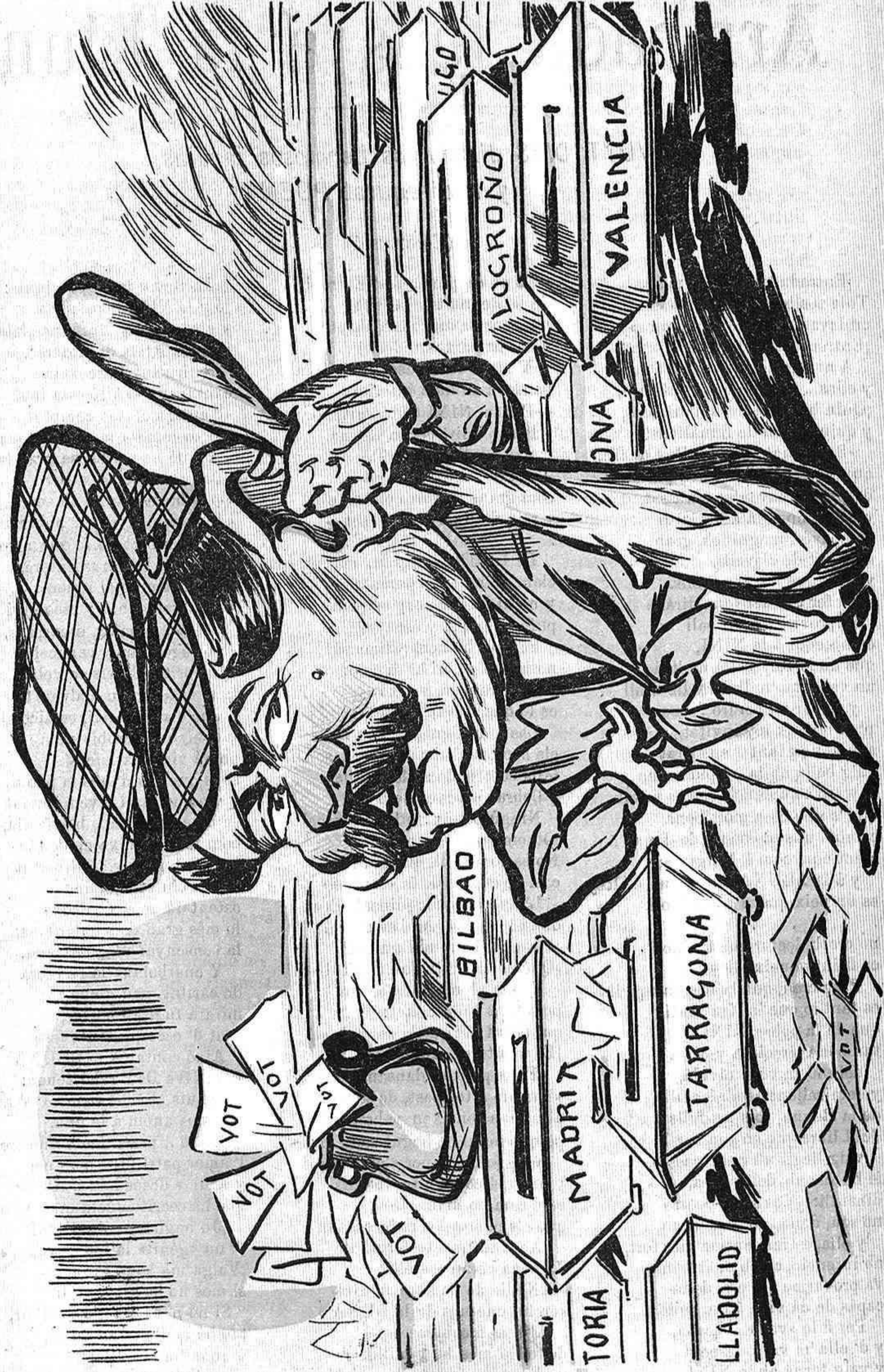
Podrà caure en Vilaverda sens deixar res de profit, sols quedarà per memoria qu' es el pinxo del tupí.