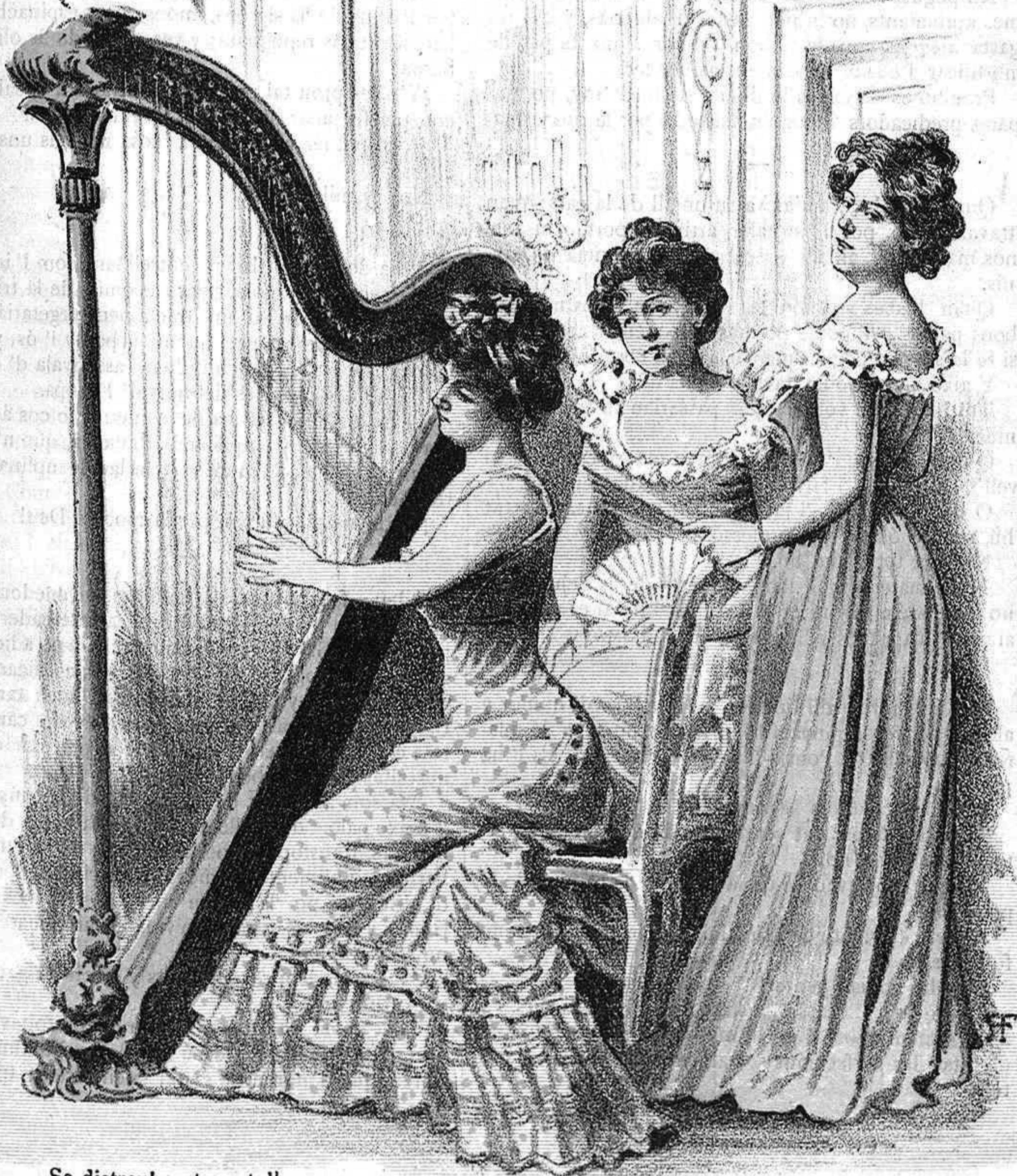
Se distreuen tocant l' arpa, y com que no fan cap mal, no crech que 'ls hi digui res lo nostre volent ferlos