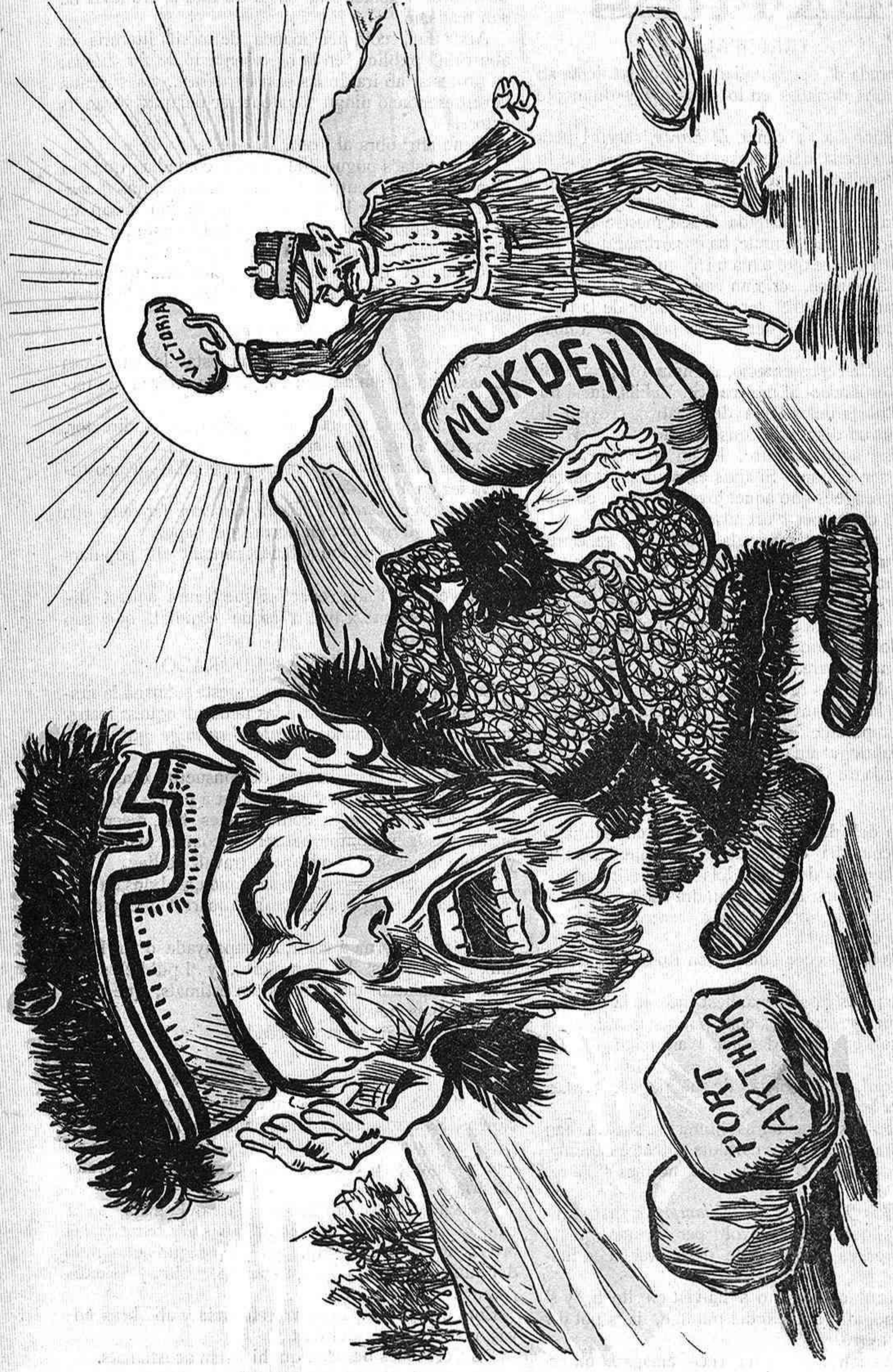
Posat á rebre pallissas, una més no vé d' aquí... ¡A cada porch, diu el ditxo, i' hi arriba 'l seu sant Martí!