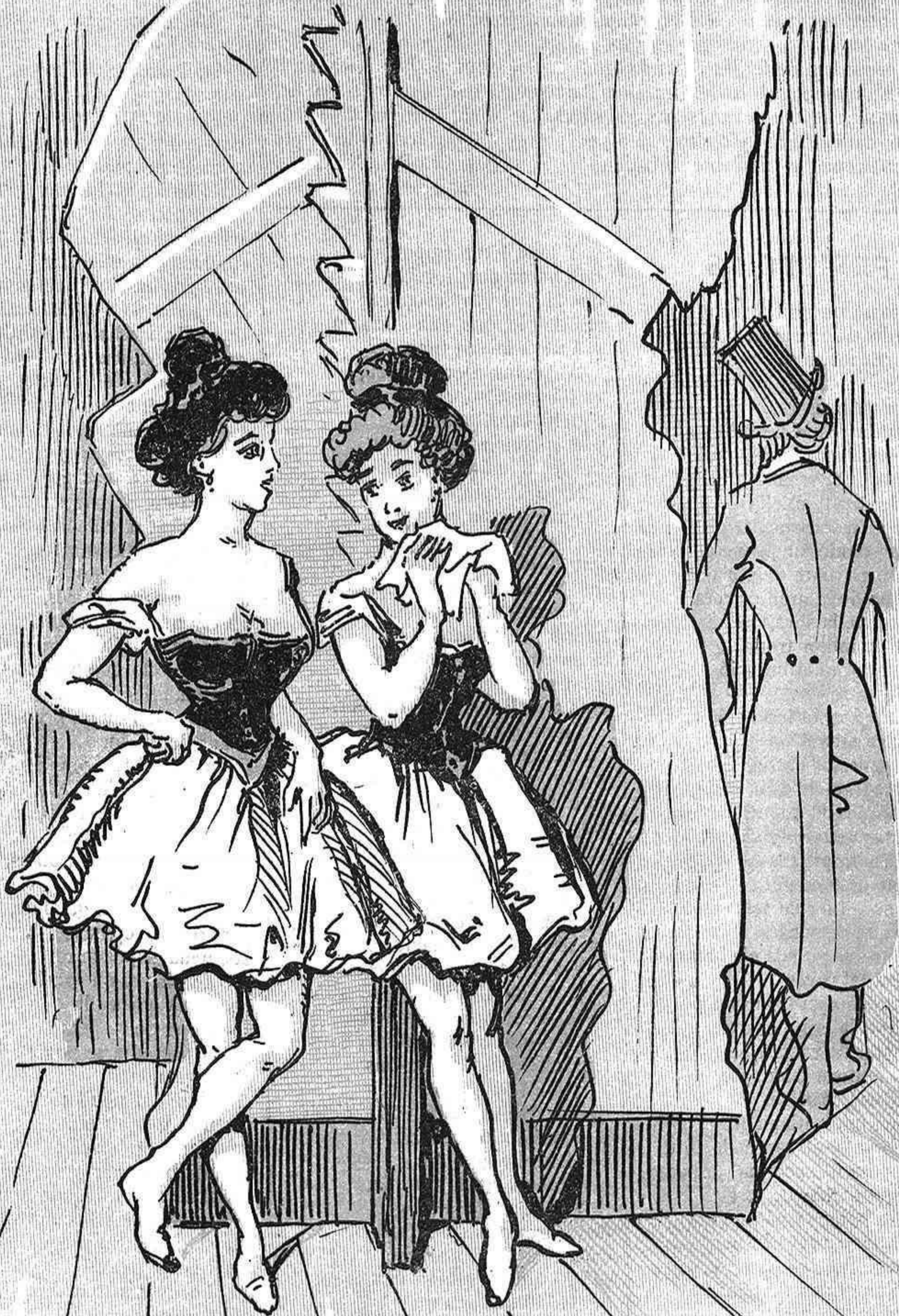
La Mundeta y la Remey, duas colometas de bastidors, qu' encare que sembli mentida son mares de setze criaturas.