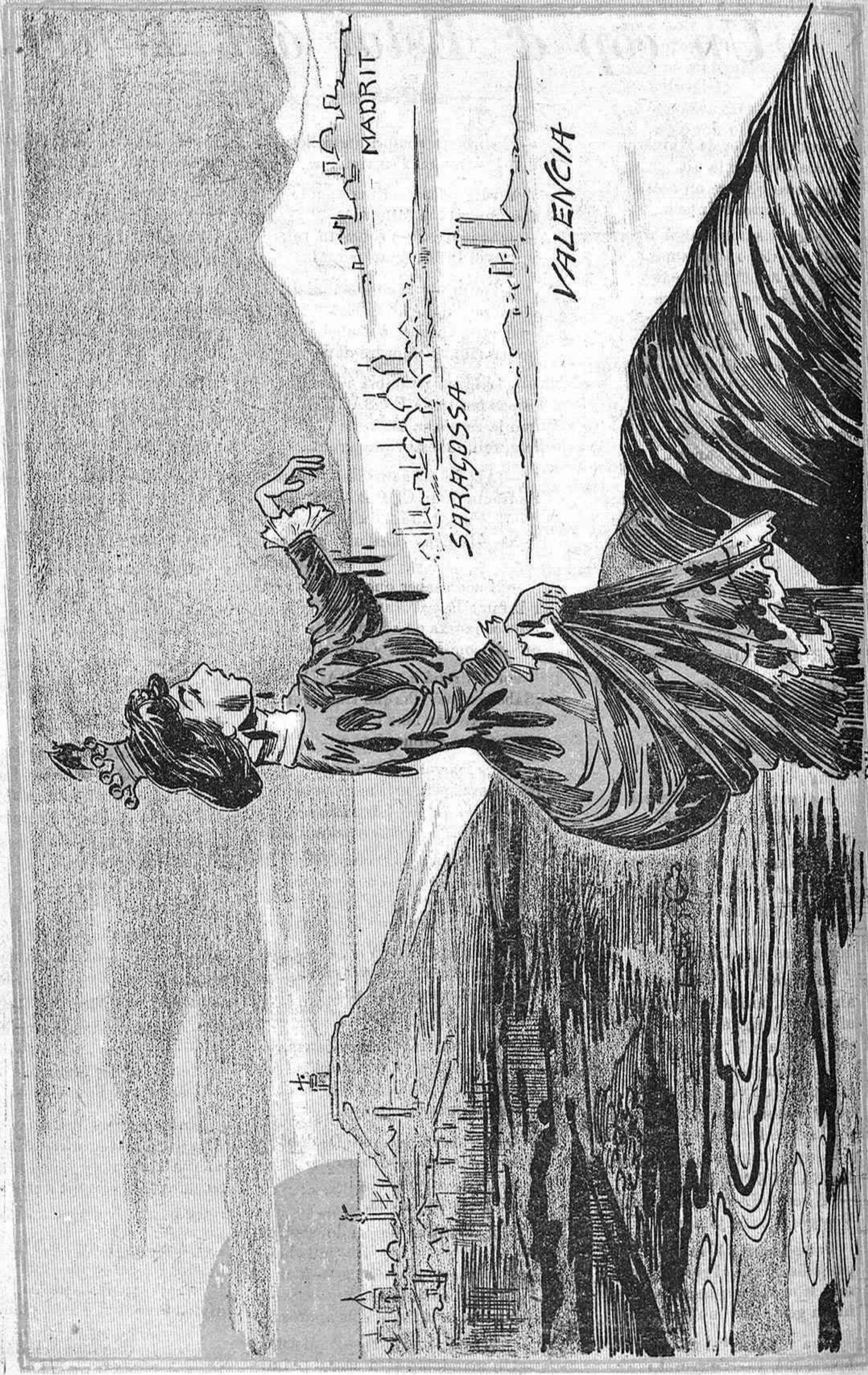
--¡Ditxosos camps y montanyas per la neu pintats de blanc! jo en cayent quatre gotas, bruta y negre 'm veig pel fang!