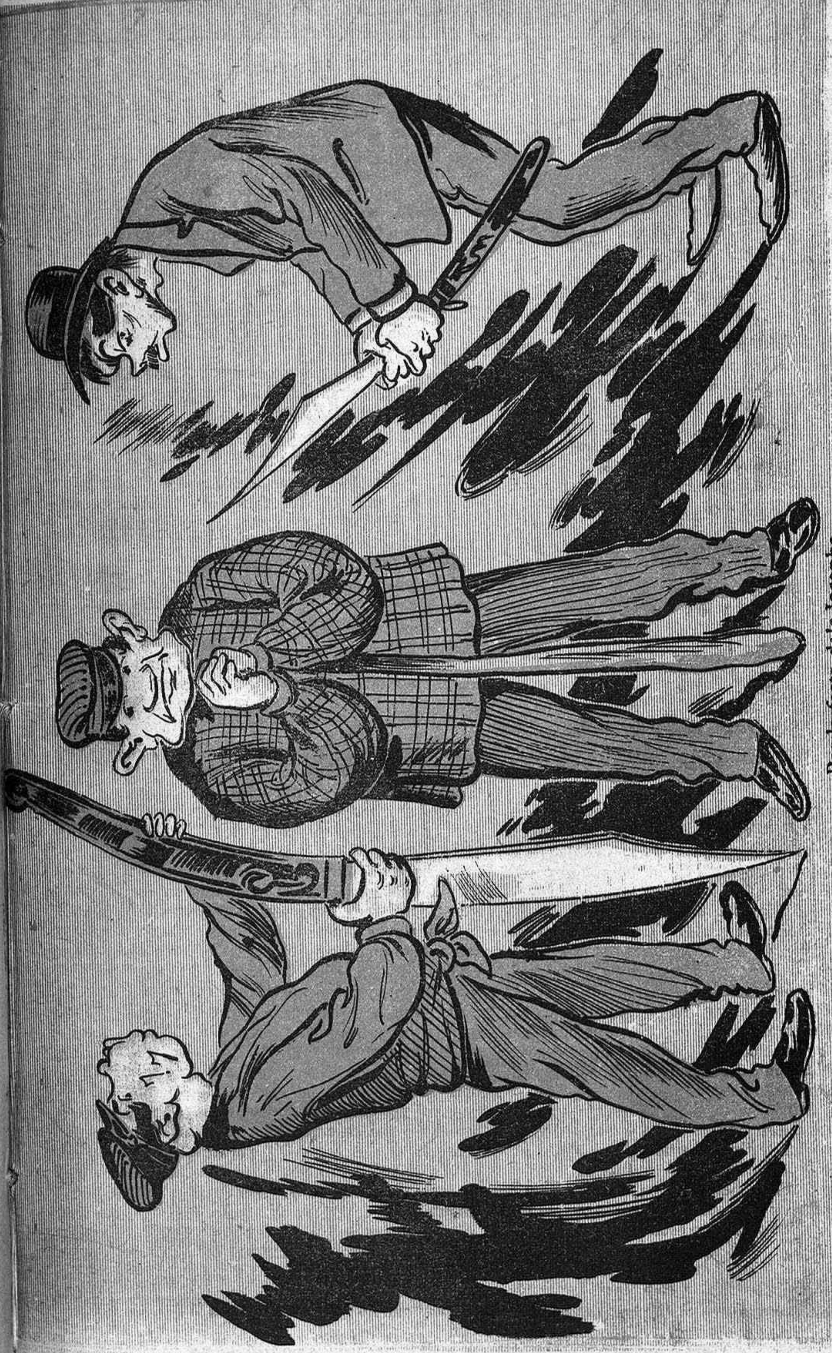
Per la festa dels Josepchs si volen celebrà 'l Sant, disposin d' aquets matòns qu' esperan omplir vacant.