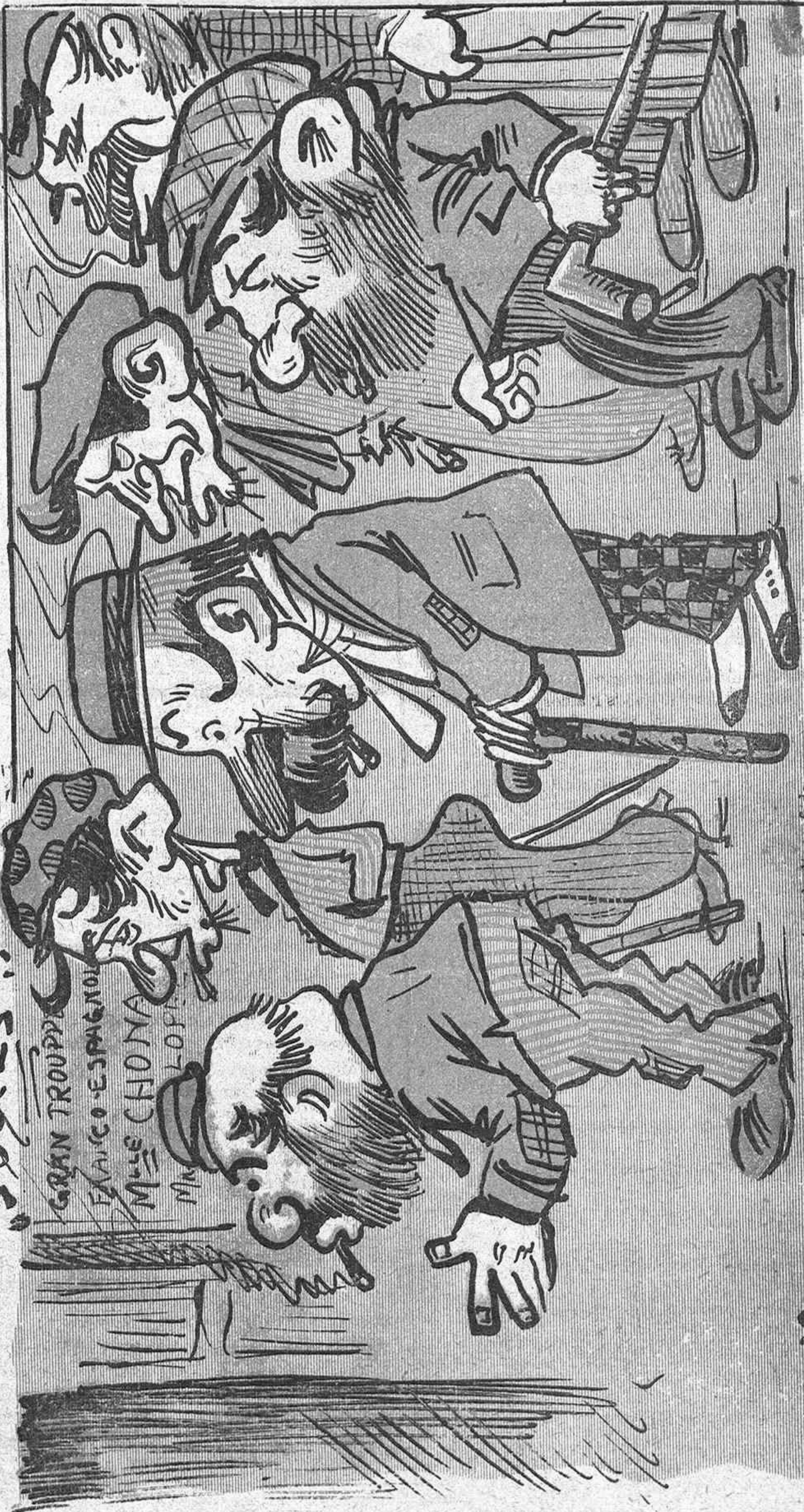
En vista de l' agafada que de valents ara han fet, venim per si necessitan algún pinxo baratet.