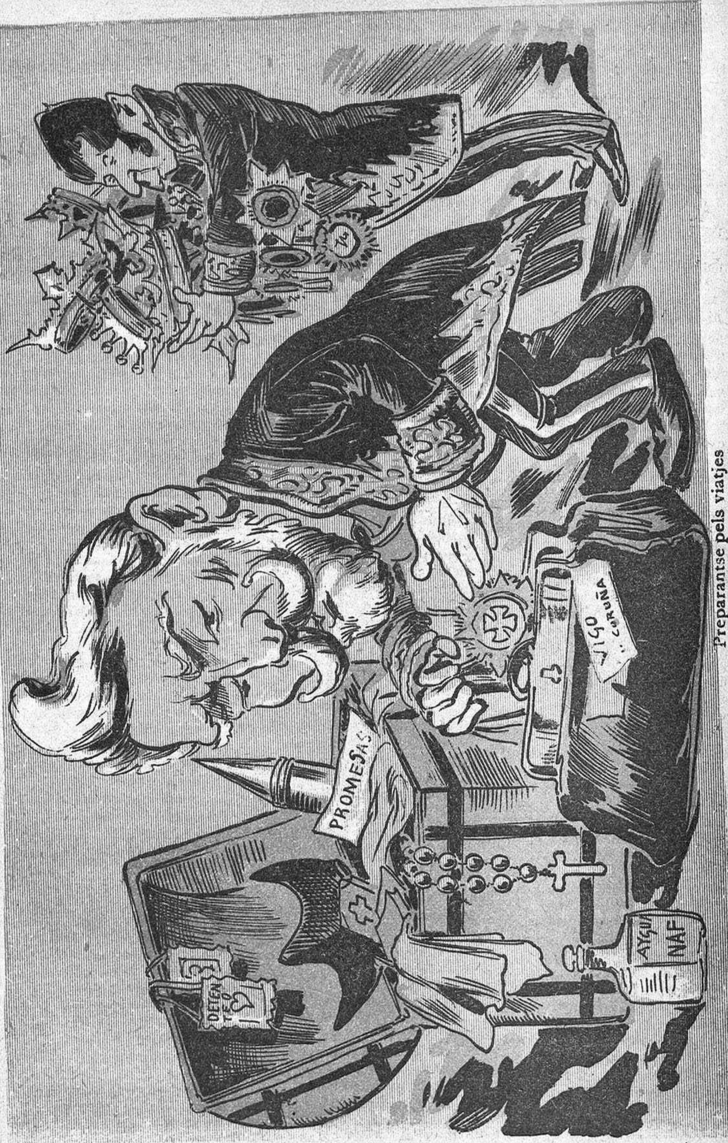
Preparantse pels viatjes en Mania passa fatichs ficant dintre 'ls equipatjes creus y titols pels amichs.