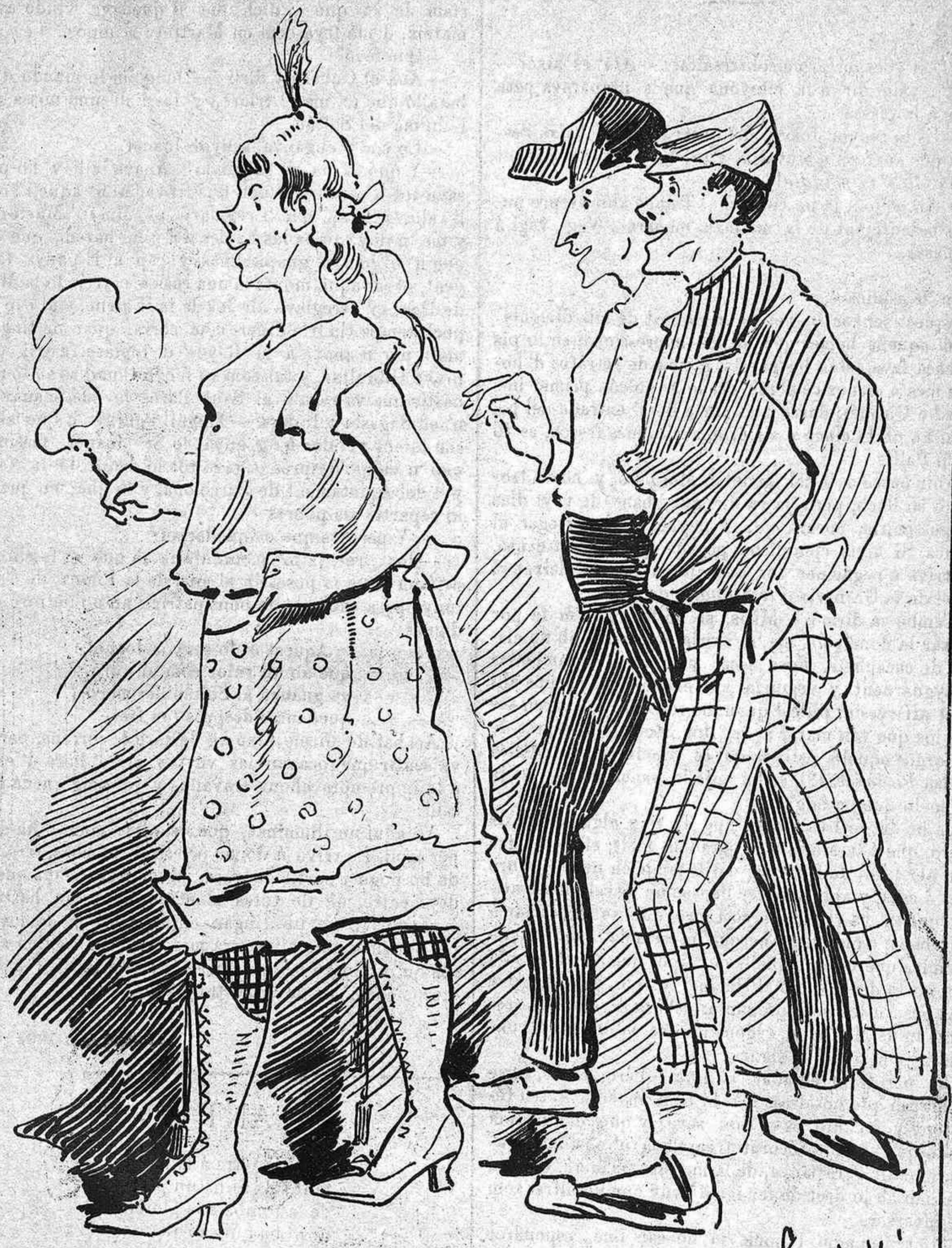
—De quina Kábila ets! —De la del carrer de la Mare de Deu.