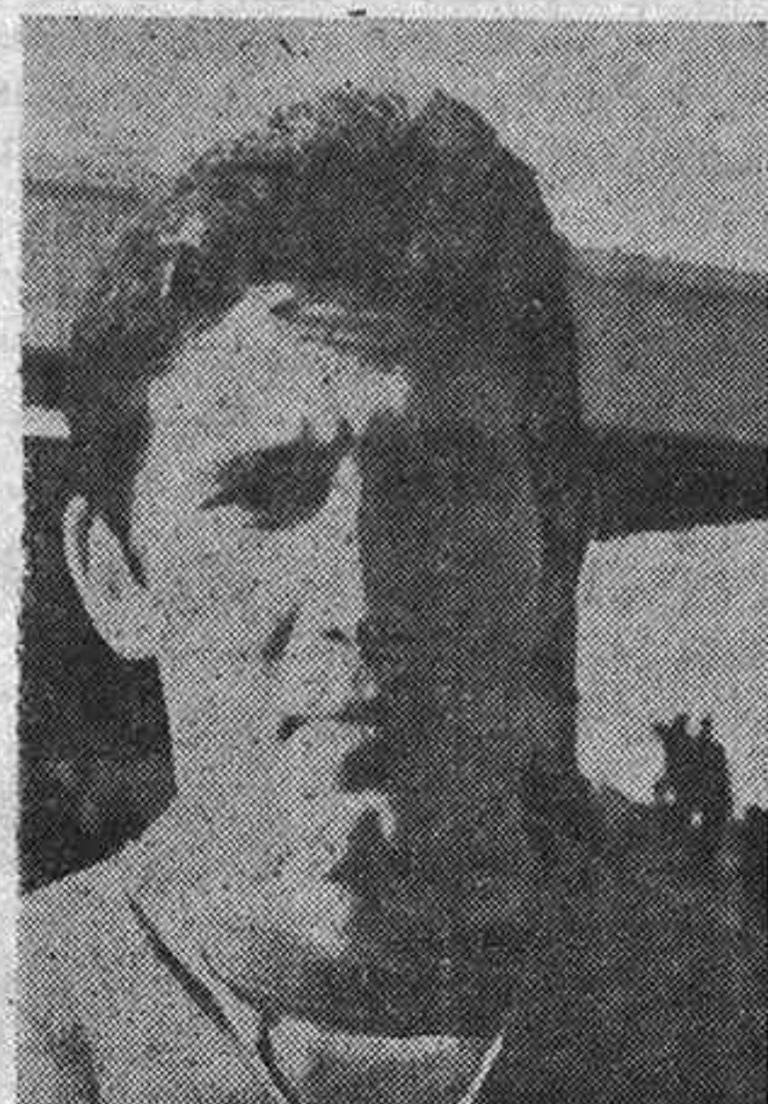
AVELINO: El mejor en la formación deportivista

gunda piedra de toque, después del partido de entrenamiento frente al Atlético de Madrid, ha sido el equipo filial: el Marchamalo. En este equipo intervinieron casi todos los jugadores ce-