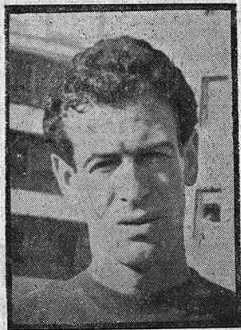
Maíz: Artífice de la victoria ante el Alcázar. Marcó los dos goles y defendió cuando fue preciso

El planteamiento fue abierto por parte del Guadalajara, y con la fórmula 3-3-4 para los visitantes, con Gallardo como medio centro organizador.