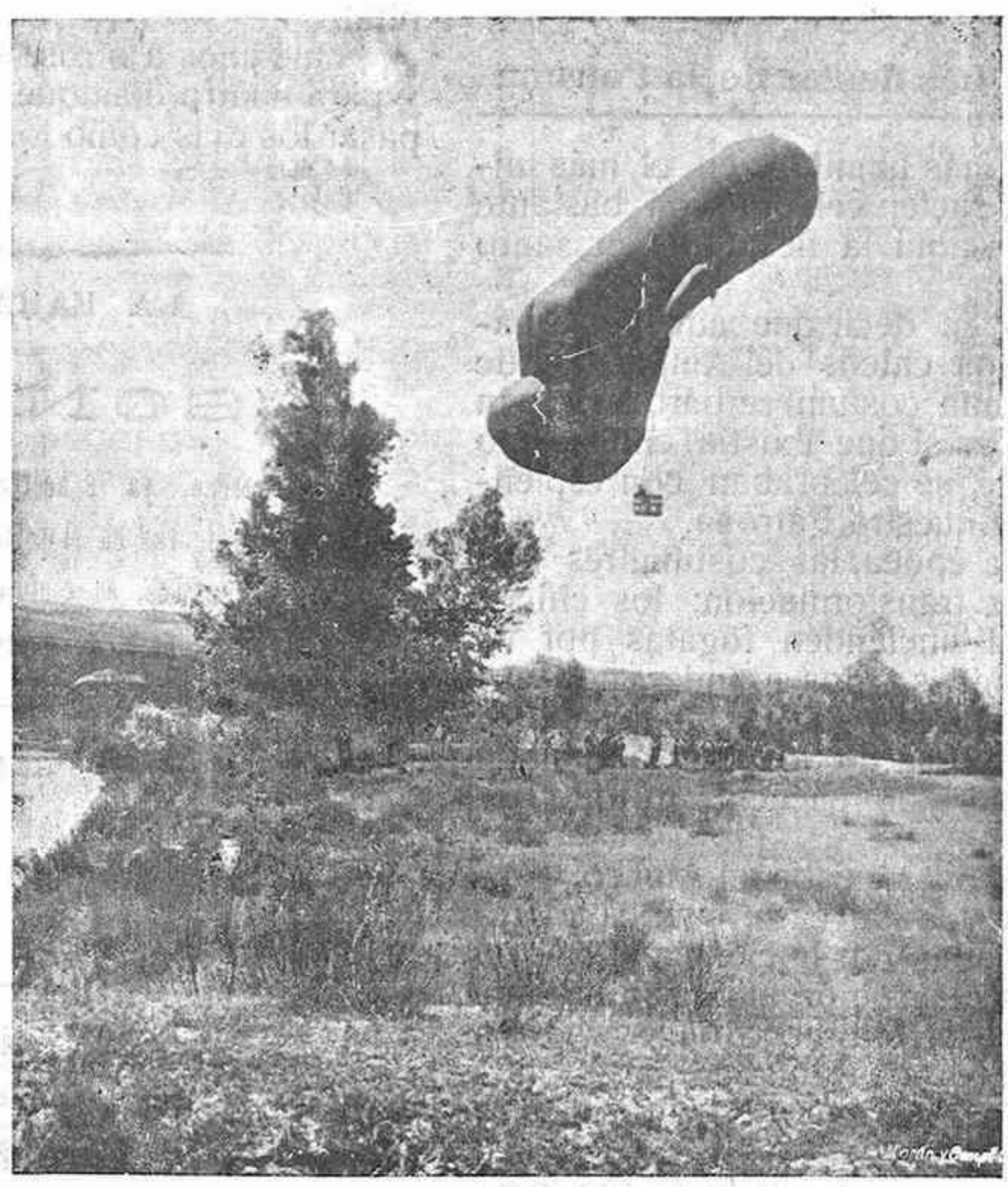
Prácticas de aerostación en las riberas del río Henares

Imprenta y Librería de Antero Concha Plaza de Correos, 2 —Guadalajara