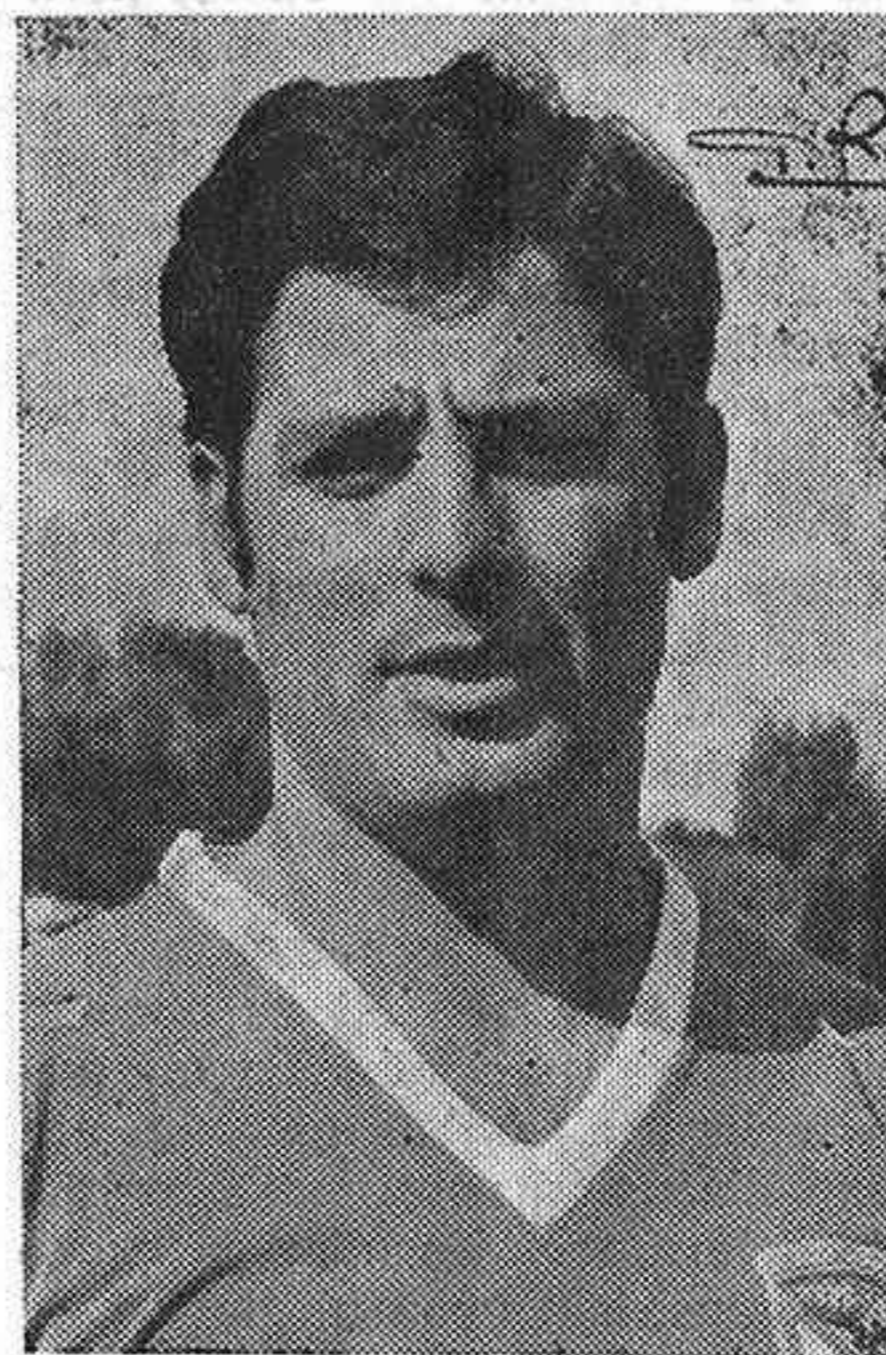
PINTADO: El mejor en el bando alcarreño

nica de juego que perduraría a lo largo de los noventa minutos, siendo en el treinta y cuatro cuando se alcanza el segundo tanto local, al ser derribado Cáceres en el área, marcando él mismo el penalti reglamentariamente.