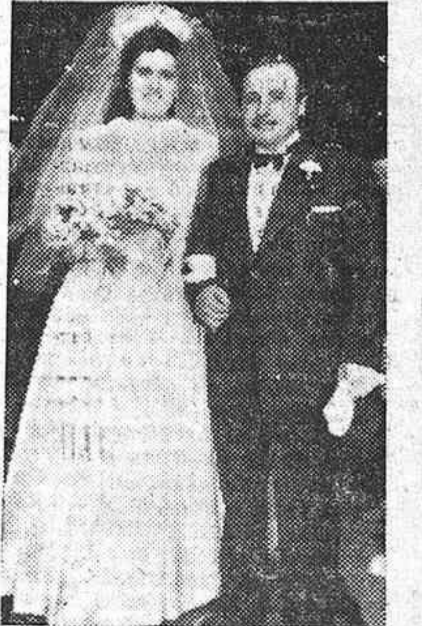
Los contrayentes después del acto nupcial.

vestido de glase natural y bonito tocado de flores y tul.