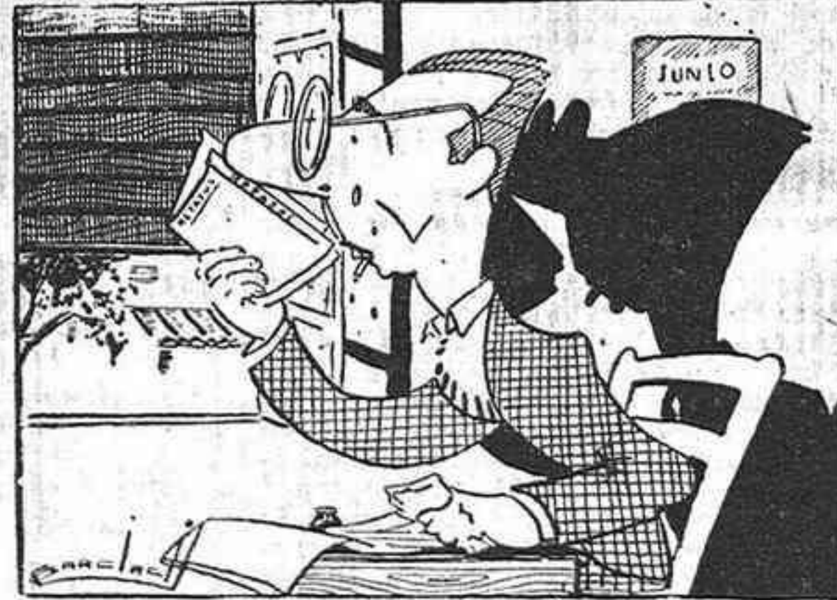
Mucho automóvil, "Haiga", mucho volante, y el puchero del pobre, con dos guisantes.

"El automóvil volante, meta de los técnicos norteamericanos".