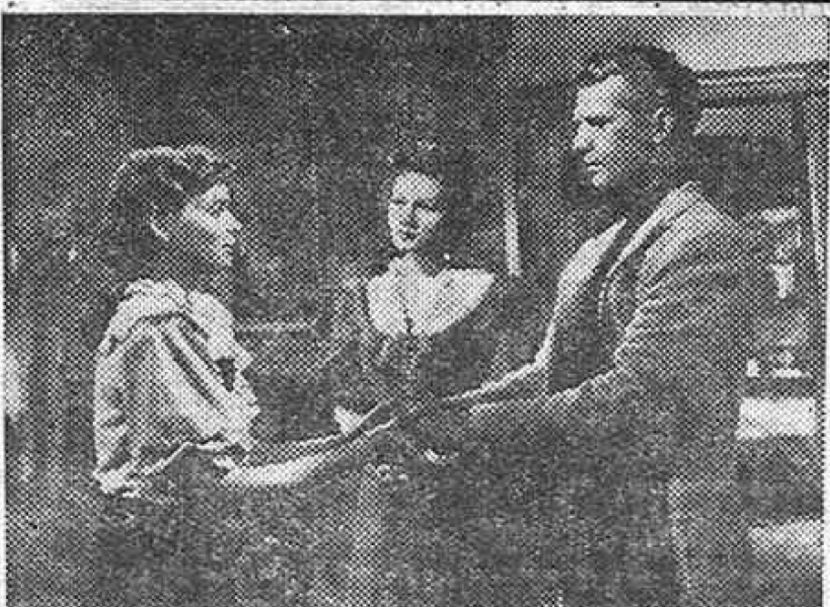
1948, que desde hoy se ofrecerán la selecta pan-