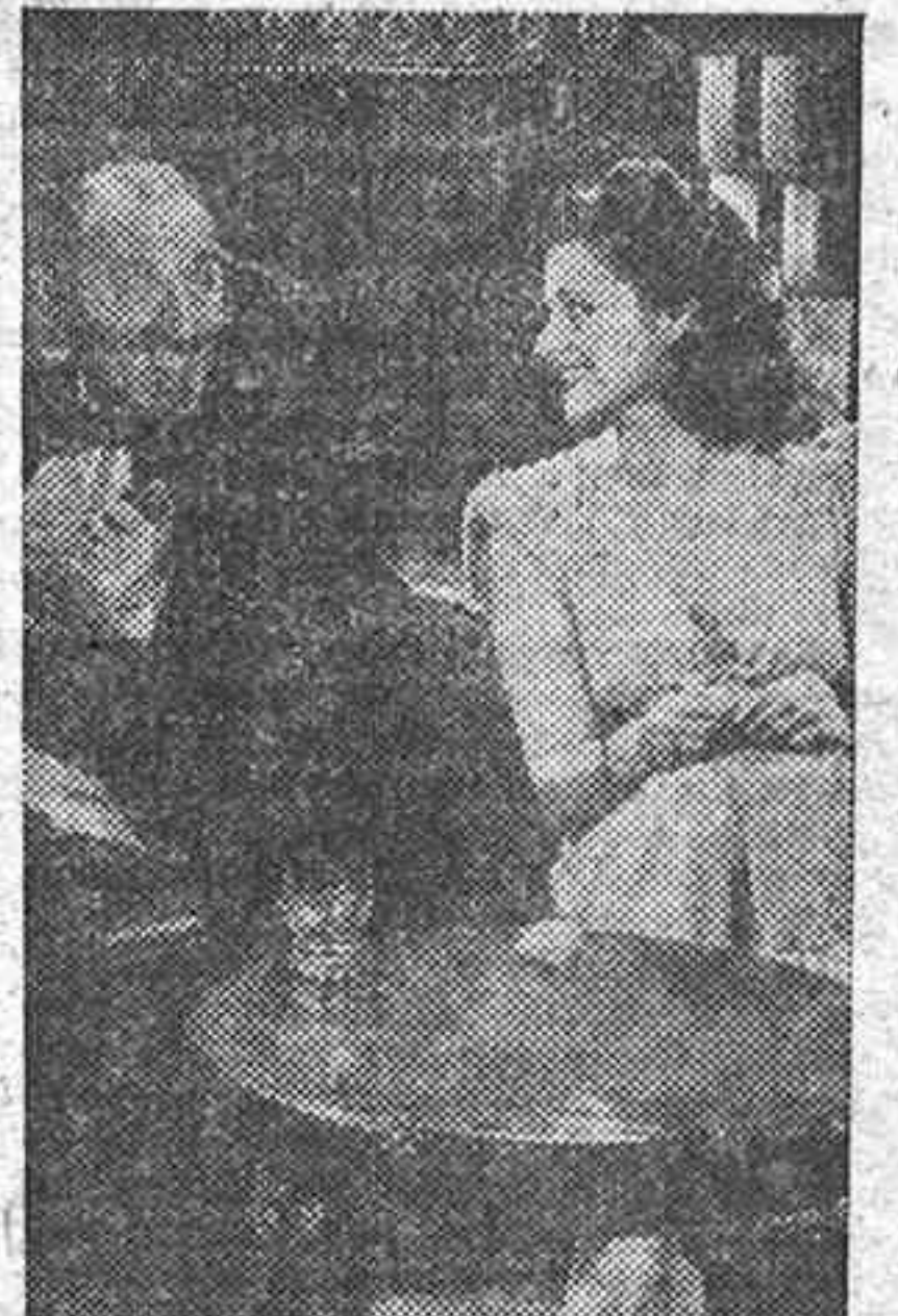
He aquí a la magnífica actriz británica Margaret Lockwood en la superproducción de Chamartín "Historia de amor", que hoy se estrena en el lujoso cine Avenida

La historia pasional de tres seres, cuyas vidas se cruzan en circunstancias extraordinarias