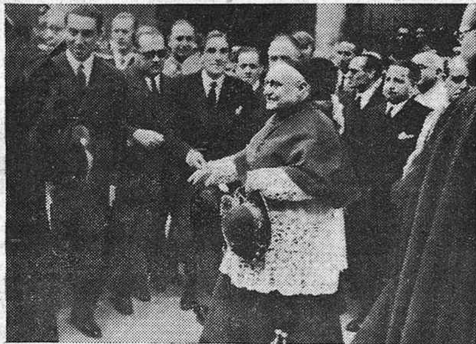
El doctor Pla y Deniel a la salida del templo

que no se borrará jamás de la mente de los testigos. Júbilo por numerosas razones, la más justificada esa de ser el motivo de la solemnidad el enfervorecido cariño de Guadalajara, de la diócesis toledana, de España—representada en su primer obispo y en las autoridades—a la Madre de Dios. Otro motivo importante es ver hermanadas en ese amor a las "dos naciones ibéricas hermanadas en misión"—que dijo el embajador de Portugal—, que son los vínculos más fuertes. Así, razones muchas y muy variadas.