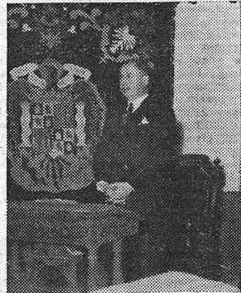
El embajador durante la ceremonia religiosa.

El gobernador civil y el presidente de la Diputación acompañaron a su eminencia reverendísima y al embajador hasta el límite de la provincia.