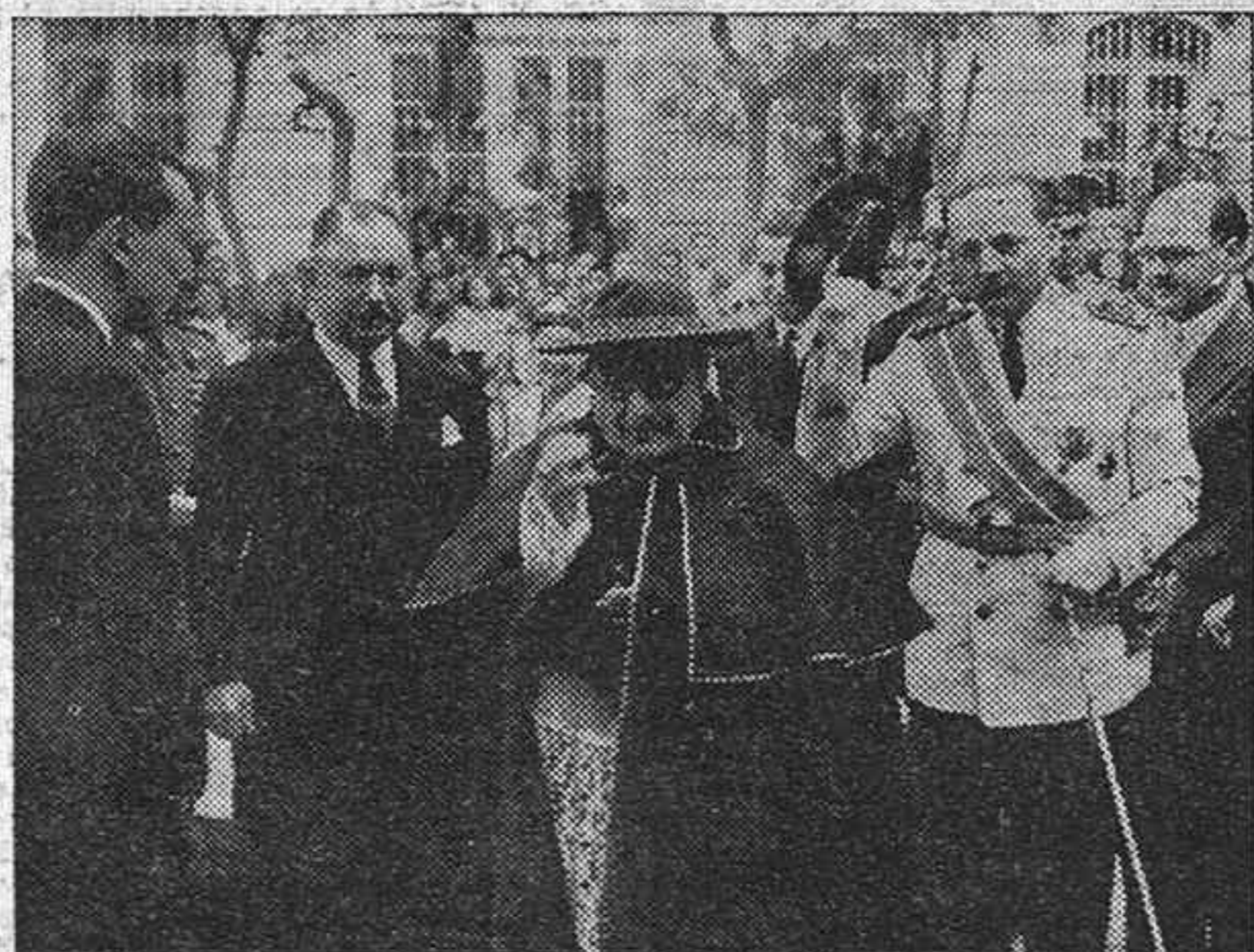
El cardenal primado, acompañado del embajador de Portugal en Madrid y de autoridades civiles y militares, entra en el templo de Santa María, en Guadalajara, donde ayer fué bendita la capilla de la Virgen de Fátima, que desde ahora será objeto del fervoroso culto de aquel católico y noble pueblo.

España y Portugal y la Virgen de Fátima España y San Salvador