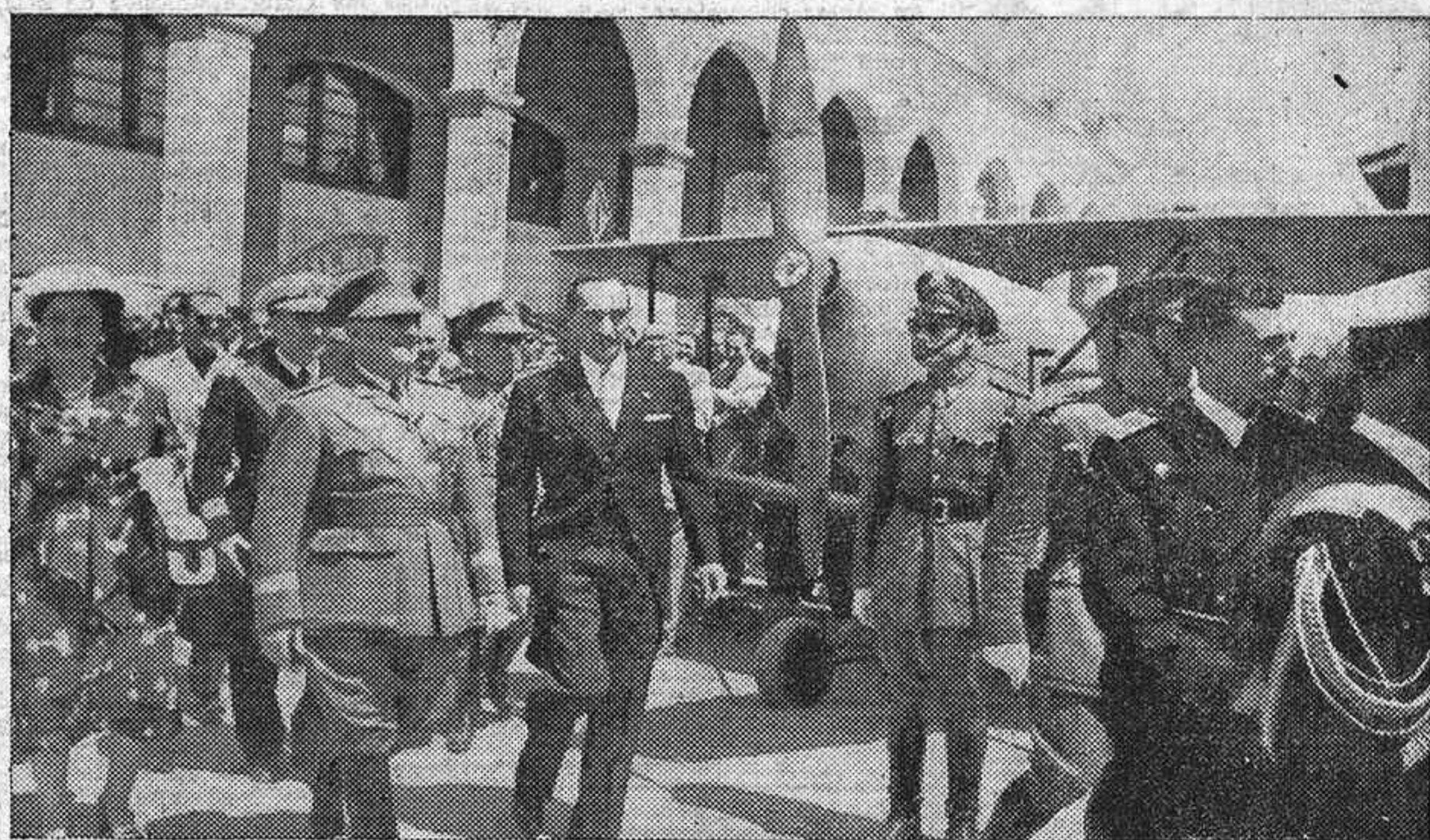
Su Excelencia el Jefe del Estado durante su visita al aeropuerto de Manises

Después de la visita al Museo, el Caudillo se dirigió hacia Ma-