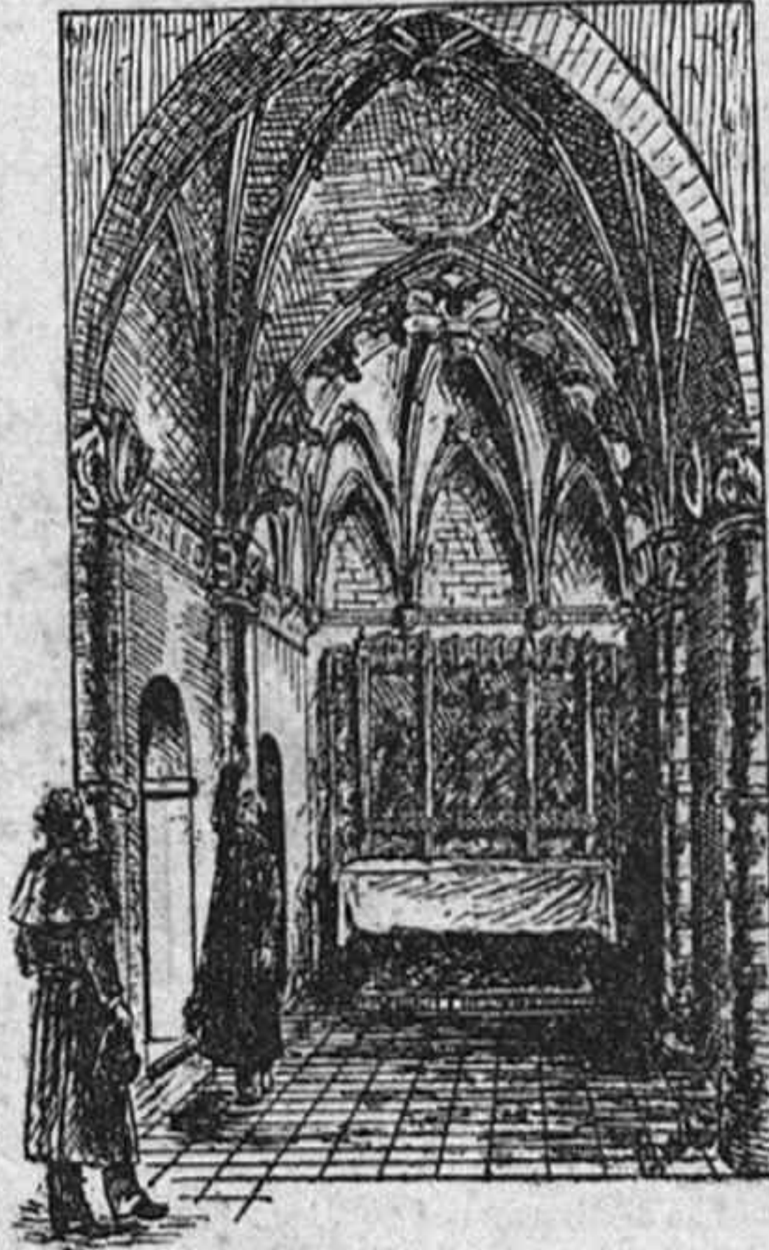
CAPILLA EN SANTA CLARA (Guadalajara).

—No, contestó el abate, antes, si madama lo